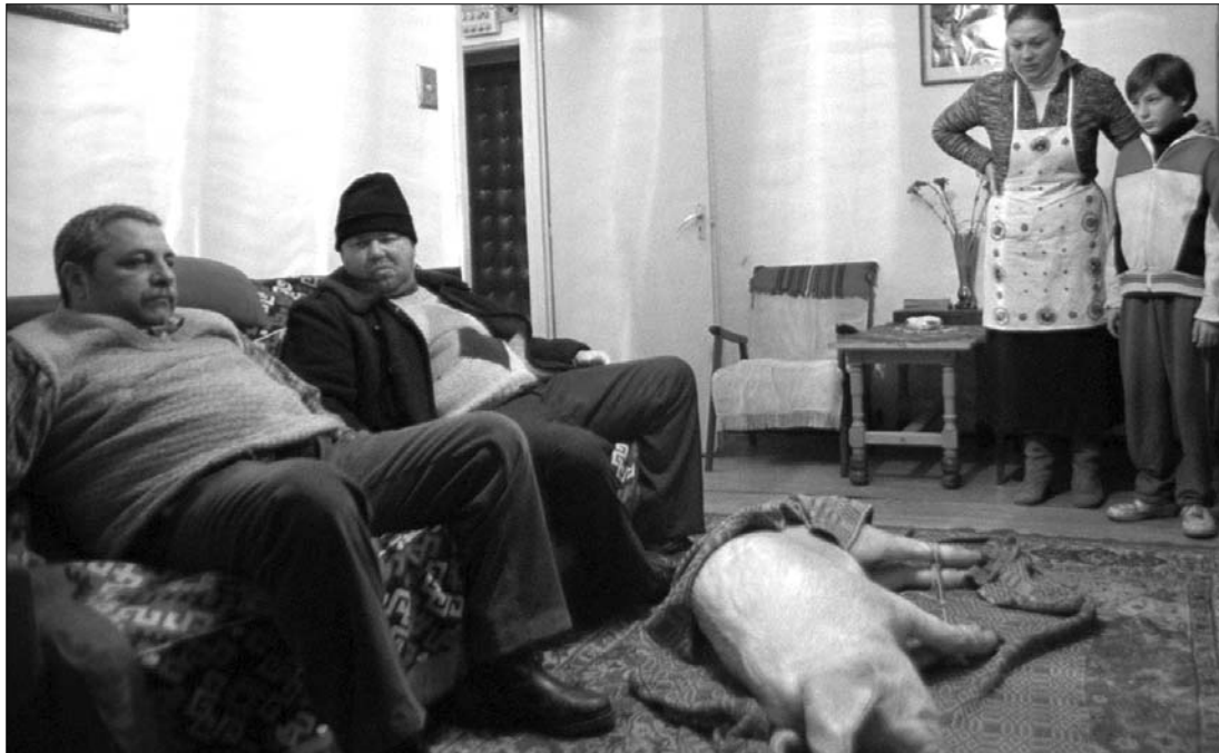
A Mesék az aranykorból című, a múlt rendszert rekonstruáló alkotás nyitotta tegnap a Román Filmhetet Budapesten