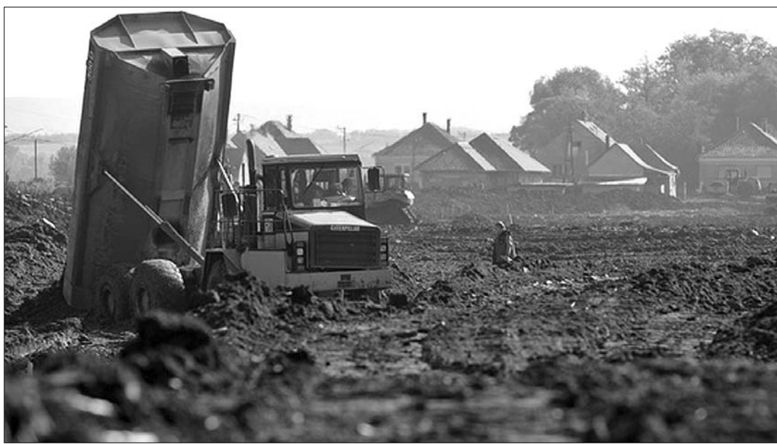
Világrekord gyorsasággal épült meg a kilométeres védőgát a vörösiszap-tározó megpedését követően

Borbély László szerint nem mértek szennyezést a Dunán