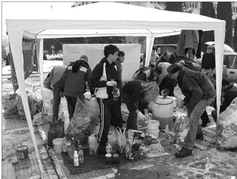
A Zöld Székelyföld Egyesület olajgyűjtési akciója mozgósította az erdélyi magyarokat.

Tájékoztatója szerint a másik általános cél, hogy vidéken is aktívabbá tegyék a civil szervezeteket, hiszen jelenleg 87 százaléka városokban fejt ki tevékenységét.