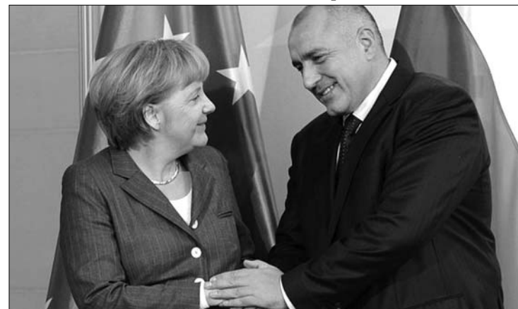
Angela Merkel kancellár a romakérdésről is tárgyalt Bojko Boriszovval

zaküldésére Franciaországból Bulgáriába. Ez a kérdés egyébként közös probléma Bukaresttel. A német kormányfő közvetlenül megérkezése után tárgyalóasztalhoz ült bolgár kollégájával, Bojko Boriszovval, és fogadta őt Georgi Parvanov köztársasági elnök is. A nap folyamán felszólalt a német-bolgár gazdasági fórumon. Angela Merkel most először jár ebben a két országban 2005-ben történt hivatalba lépése óta. ◀