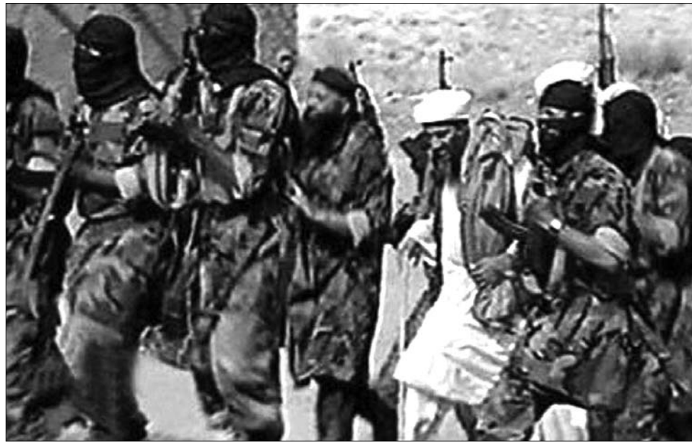
Katonai kiképzés az al-Kaida egyik táborában

„Ez komoly veszélyt jelent Európában, különösen Németországban és Nagy-Britanniában” – mondta Edwin Bakker, a hollandiai nemzetközi kapcsolatok intézetének biztonság-politikai szakértője. „A motiváció nem minden esetben az iszlámizmus, sokszor életük célját vagy