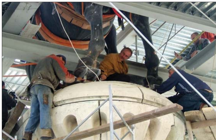
A lovas alakot csak próbából helyezték vissza talapzatára