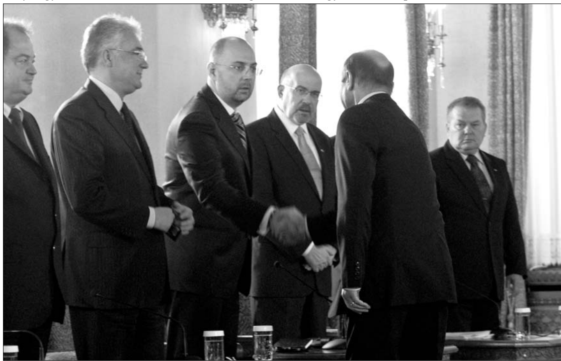
A Cotroceni-palotában tartott tanácskozáson az RMDSZ négytagú küldöttséggel képviseltette magát.

Jó kis szizofrénia – ilyenre csak egy igazán nagy államférfi képes. Mindenható vezetőért tehát nem kell a szomszédba mennünk. De ha mégis megyünk, akkor találunk: itt van mindjárt a szívünkhöz közel álló nyugati szomszéd, (csonka)magyar „anyaországunk”. Csonkaságát ezúttal demokratikus államrendezkedésére vonatkoztatva megállapíthatjuk, hogy az ország legfőbb embere mindent maga intéz: ma a parlamentben napirend előtt rendőrségi híreket ismertett (bejelenti az iszapkatasztrófa okozó cég vezérigazgatójának őrizetbe vételét), holnap alighanem kézzel a gyógyítja a kolontári sebesülteket, úgyhogy előbb-utóbb szenté is avatják. Ami nem is lenne elképzelhetetlen egy olyan országban, ahol a tervezett alkotmány módosítás legfőbb elemeként alaptörvénybe foglalhatják a Himnusz első sorát. Isten, szánd meg a magyart... ◀