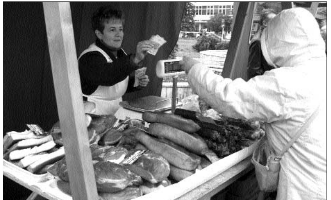
A sajt, a házi szalonna, a kolbász, a házi kenyér, a kürtös kalács, a méz, a savanyúság és a befőtt volt a legkelendőbb