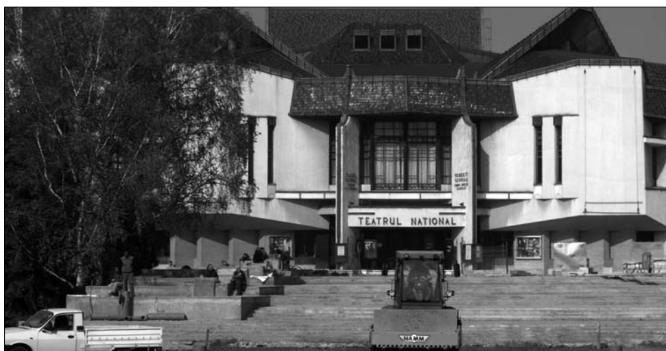
A marosvásárhelyi színház. Kívül-belül átrendezés alatt áll az intézmény