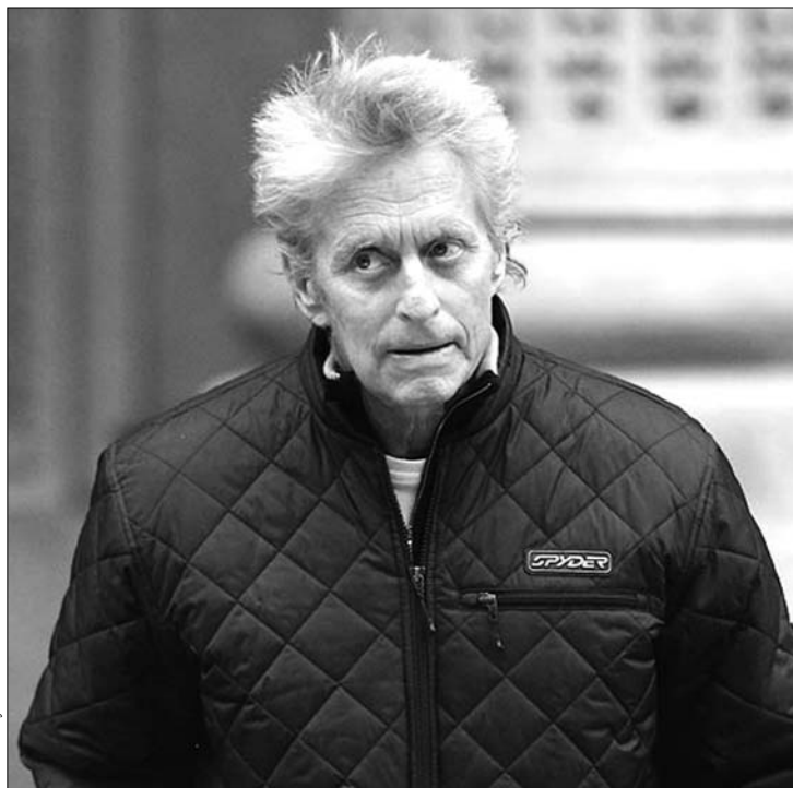
A legfrissebb fotók megkérdőjelezzik Michael Douglas rák elleni „győzelmét”

Nem segít Michael Douglas torokrák elleni küzdelmében a kemoterápia – legalábbis erre utalnak a bulvárlapok tegnap nyilvánosságra hozott fotói, melyeken a színész szemmel láthatólag rossz bőrben van – nagyon lefogyott, arca megviselt és beesett. A 65 éves Oscar-díjas sztár ennek ellenére „nagyon optimista”, bár felesége kezdi elveszíteni a reményt. Amint arról lapunkban beszámoltunk, Catherine Zeta-Jones nemrégiben megszakította európai körútját, és visszatért New Yorkba, hogy férje mellett lehessen. A színésznő egyik barátja szerint Catherine azután döntött a gyors hazautazás mellett, hogy beszélt párja orvosával, s a tény, hogy összeomlva, kislírt szemekkel szállt ki a repülőből, a legrosszabbra enged következtetni. Michael Douglas 1944.