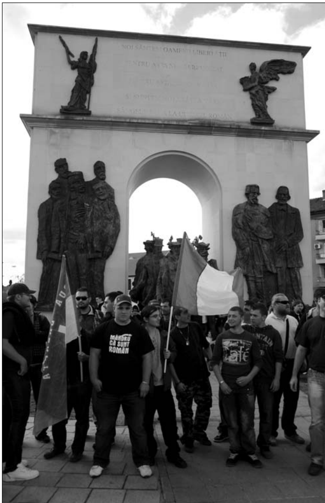
Az Új Jobboldal tagjai nem sok vizet zavartak Aradon

Markó Béla úgy fogalmazott: a Szabadság-szobor