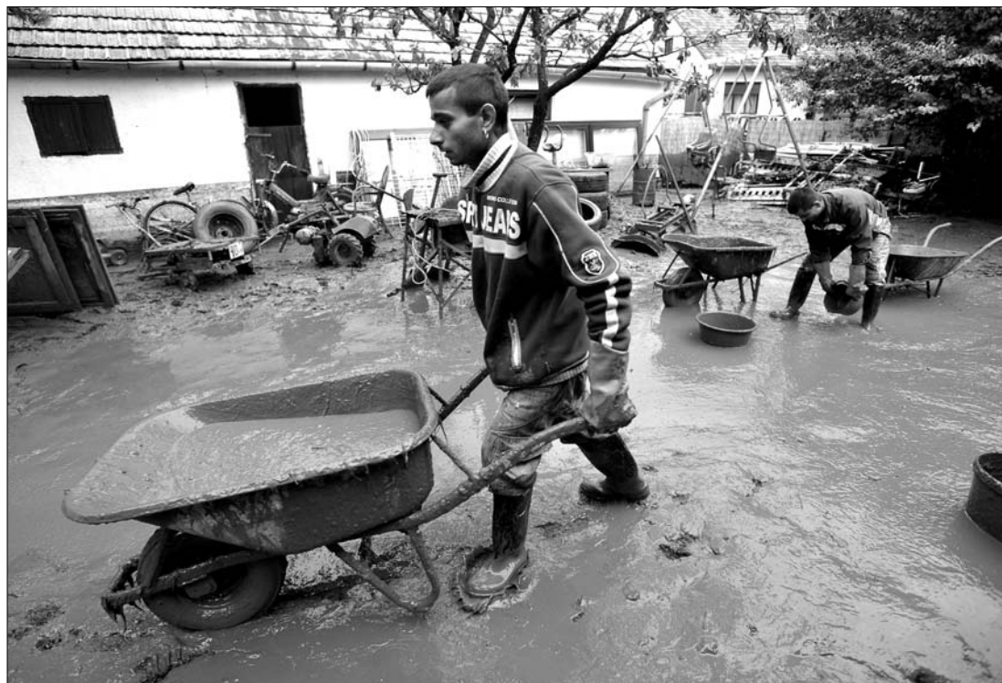
Mentik, ami menthető. A gyári iszap több kisvárost elöntött, négy ember meghalt 120-an megsérültek