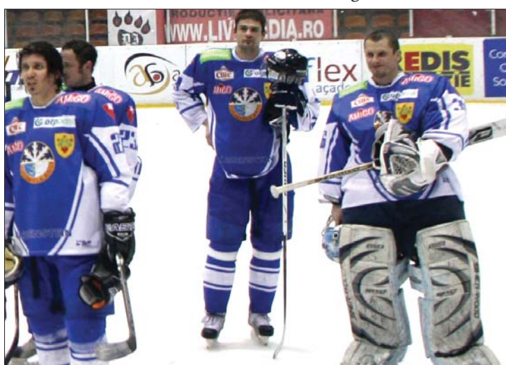
A listavezető HSC Csíkszereda kiütötte a sereghajtó Újpestet.

Sapa Fehérvár AV19–Miskolci Jegesmedvék 3-5. Pénteken újabb fordulót rendeznek az alábbi műsor szerint: Miskolci JJSE–Brassói Fenestela 68, Újpesti TE–Sapa Fehérvár AV19, HSC Csíkszereda–Dab.Docler, Buk. Steaua Rangers–Vasas HC. ◀