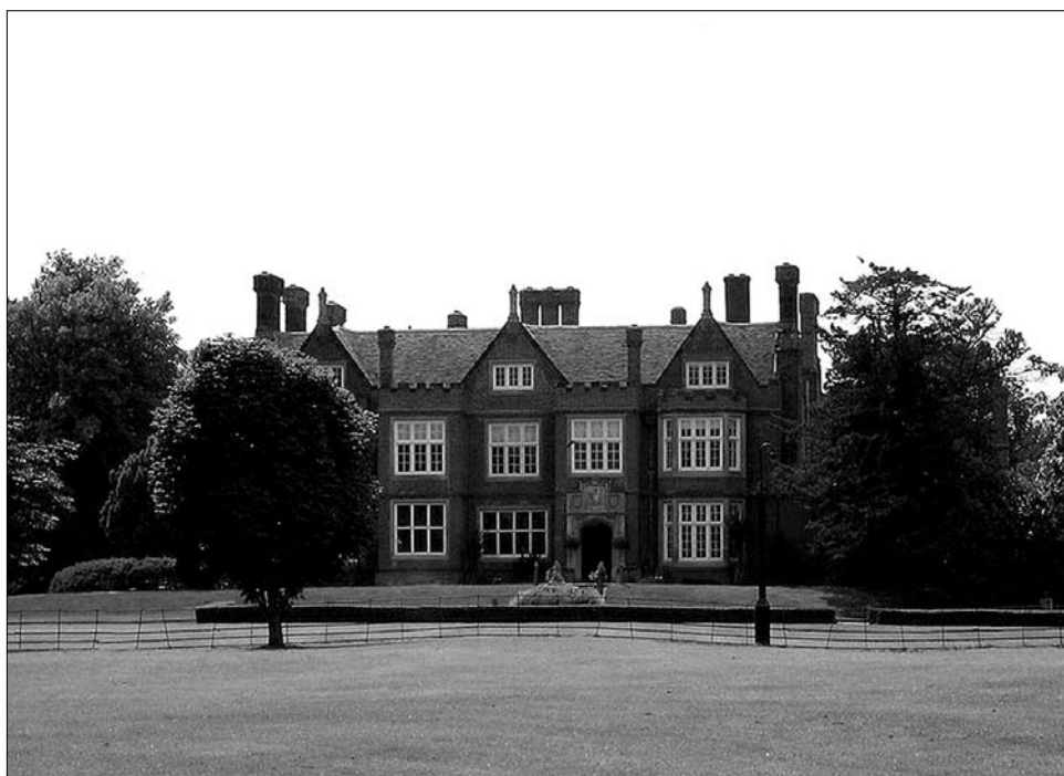
A Robert Geoffrey Edwards által alapított Bourn Hall klinika Cambridgeshire-ban

Edwards és Steptoe 1968-ban arra dolgozott ki különféle módszereket, hogy miként lehet a testen (méhen) kívül petesejtet megterméke-