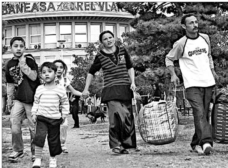
A „nyugati paradicsomból” kiutasított romák röviddel azt követően, hogy megérkeztek a bukaresti reptérre

eurót vett fel, hivatalosan arra, hogy a Suceava megyei Dornești-ben ruhát és ételmisszert juttasson 1945. május 9. előtt született, szegény roma családoknak. Minderről az érintettek semmit sem tudnak, aminthogy – a Monitorul din Suceava című helyi lap tavalyi közlése szerint – senki sem hallott a községben az Idősek Klubjáról és könyvtárjáról, amelynek felépítésére ugyancsak a Romanitin vállalt kötelezettséget. A projekt