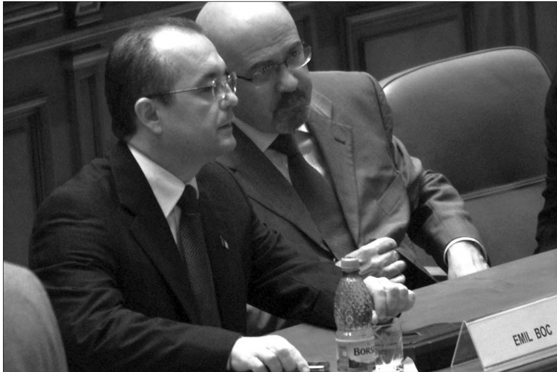
Dupla vagy semmi. Boc és Markó a tanügyi törvénnyel és a bértörvénnyel is vásárra vinné a kormánykoalíció bérét