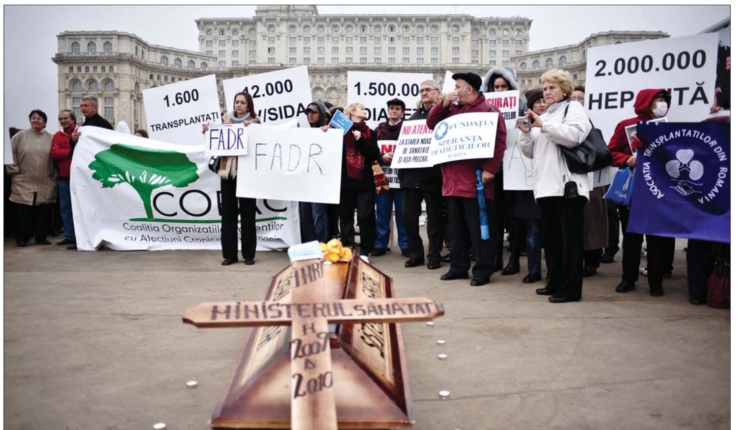
Az utcán kérték jogaikat. A krónikus betegek tavaly a parlament előtt tüntettek, amikor elfogyott a gyógyszerár-támogatásra fordított pénz