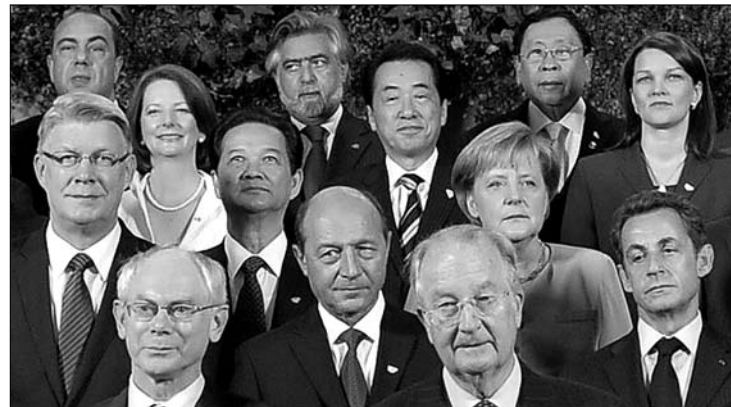
Traian Băsescu lerövidítette brüsszeli utazását, fél nap után hazatér.

Az ASEM 1996. évi létrehozásával az uniónak az volt a célja, hogy számot vessen az ázsiai országok növekvő gazdasági és politikai befolyásával. ◀