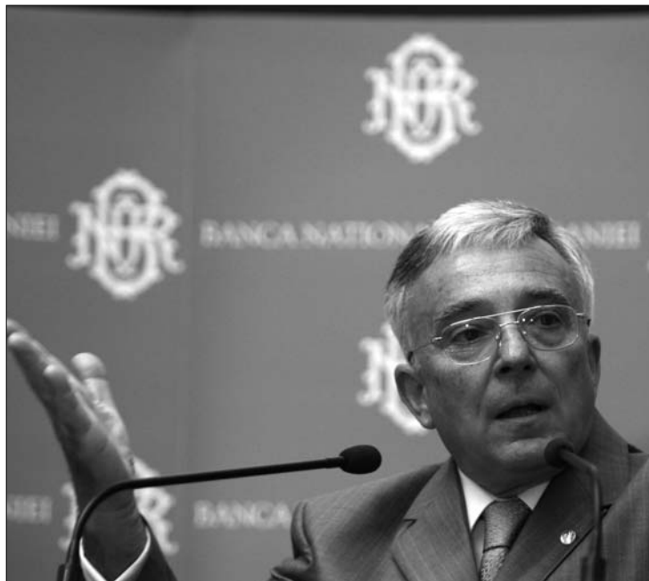
A román jegybanki elnök nem ért egyet az új valutaalapi hitel felvételével

Mint hozzátette, egy ilyen kölcsön nem tenne egyebet, mint nagy adósságterhet helyezne Romániára. Isărescu szerint egy ilyen kölcsönnek legfeljebb elővigyázatossági célokra kellene szolgálnia, és a pénzhez csak vész helyzetben szabadna hozzányúlni. A jegybank kormányzója a gazdasági fellendülés enyhéjére várja, ugyanakkor negatív hatásának tartja az áfaemelését. ◀