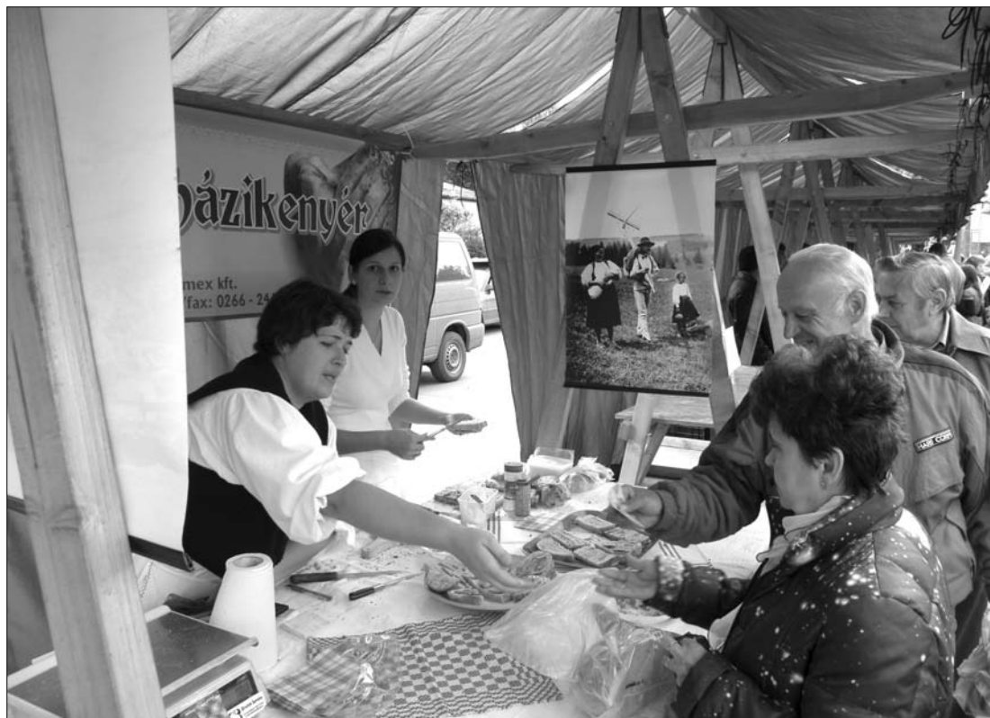
A frissen sült, zsírral megkent és vöröshagymával díszített házikenyert sem volt érdemes kihagyni

A kiállítók zöme a városi sportszarnokban és annak környékén állította fel standját, ám idén először a minifocipálya is benépesült. Itt kapott helyet ugyanis az idei rendezvény újdonságának számító Székely Termékek Fesztiválja, amelyet a Hargita Megyei Tanács támogatásával szerveztek meg.