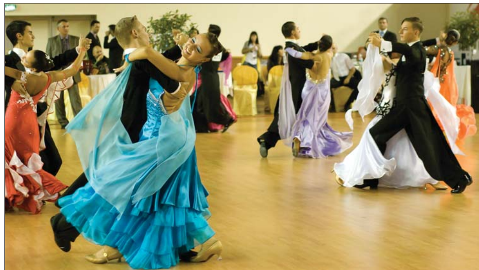
Maga színvonalú nemzetközi sporttánc-versenyt rendeztek meg a Cenik alatti városban.