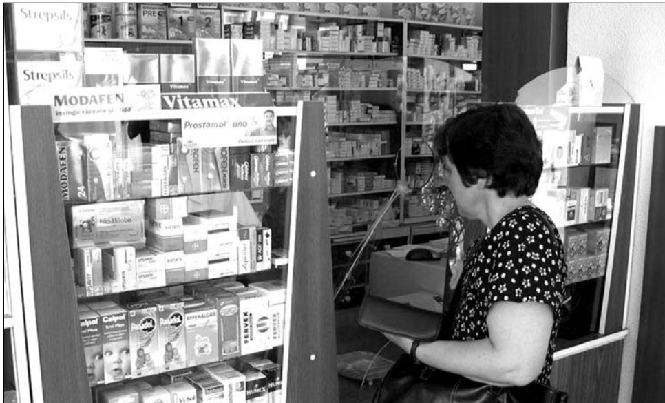
A krónikus betegek egyelőre ingyenes gyógyszert kapnak a hazai patikákban

„Egyesületünknek van olyan tagja, aki 2-3 ezer lejt fizet a gyógyszerekért havon-