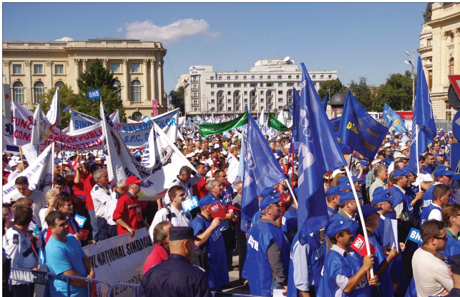
Hiábavaló tiltakozás? Az Országos Szakszervezeti Tömb felhívására tegnap mintegy nyolcezeren tüntettek Bukarestben

Eredménytelenül egyeztetett tegnap a kormány a tüntető szakszervezetek vezetőivel