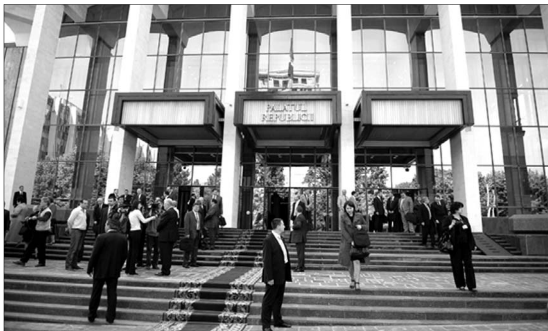
Tegnapról kényszerszabadságra mentek a moldovai képviselők, a választásokat november 28-ra írták ki

A moldovai törvények értelmében, ha a képviselők képtelenek megválasztani az elnököt, akkor fel kell oszlatni a parlamentet. Ez azonban 2009-ben azért nem történt meg, mert a törvények azt is előírják, hogy évente csak egyszer kerülhet sor erre a procedúrára, és abban az évben egyszer már feloszlották a törvényhozást. ◀