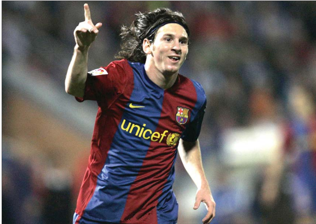
A katalán csapat argentin kiválósága, Lionel Messi sérüléssel bajlódik, és nem biztos, hogy pályára léphet ma