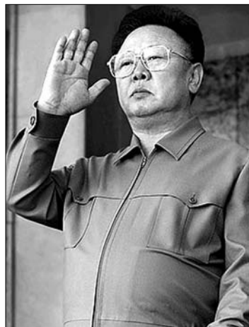
Észak-Korea ura: Kim Dzsong Il

► Megkezdődött tegnap az észak-koreai állampárt rendkívüli gyűlése, az előzetes tervnek megfelelően, és ezen meghosszabbították Kim Dzsong Il főtitkár megbízatását. A KCNA észak-koreai hírtügynökség megerősítette, hogy tábornokká nevezték ki a jelenlegi vezető legkisebb fiát, a lehetséges utódként emlegetett Kim Dzsong Unt. Összesen hat embert emeltek tábornoki rangra: Kim Dzsong Un mellett, köztük volt Kim Dzsong Il húga, Kim Kjong Huj is. A kinevezések hétfőtől hatályosak.