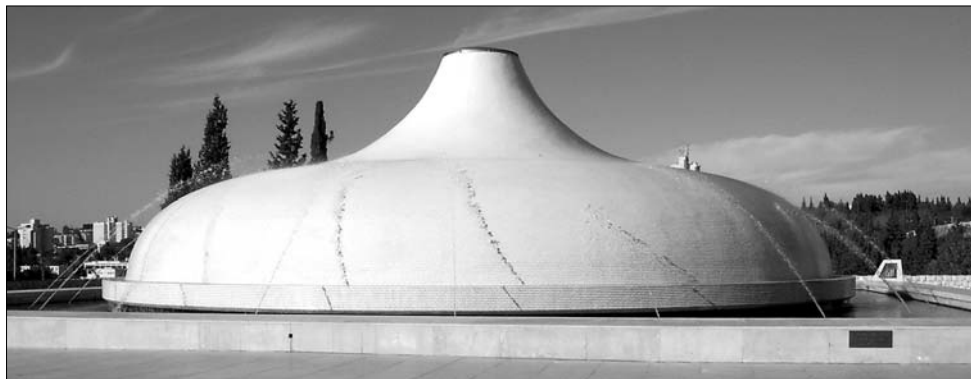
A hatalmas Izrael Múzeum részét képező Könyv Szentélyének tartalma is Csíkba érkezik

Ezt követően a Heltai Alapítvány székházában szakmai szempontból kiértékelik a gálaműsort, majd táncszállal folytatódik a Harmadik, a Heveder és a Szározfa zenekarok közreműködésével. ◀