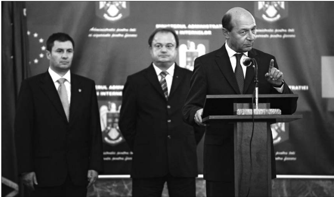
Traian Băsescu arra figyelmeztette Traian Igașt (balra), hogy tartson fegyelmet a belügyi intézményekben.

Közben videofelvételek és fényképek alapján sikerült azonosítani hármát az öt rendőr közül, akik a múlt pénteki, illegális felvonulásba torkolló tüntetésen fegyverrel az oldalukon vettek részt. További vizsgálatok