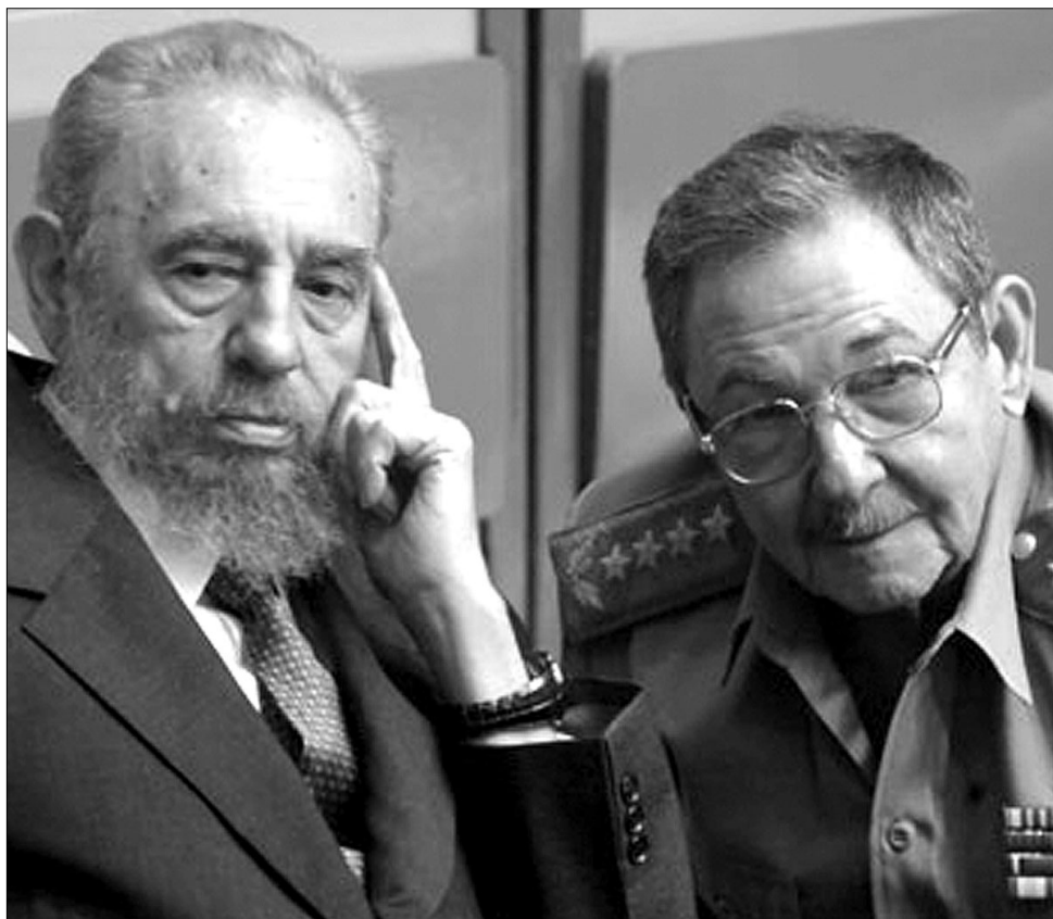
Fidel és Raul – a Castro-testvérek megosztják egymás közt a hatalmat Kubában

A havannai rezsim által két héttel ezelőtt bejelentett lépések drámainak tűnnek a közvetlenül érintettek szempontjából, mégis szerények ahhoz képest, amire egy hatékony piacgazdasághoz vezető, reális gazdasági reform érdeké-