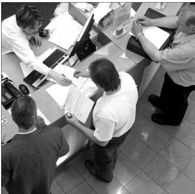
Egymilliárd lej adósságot halmoztak fel a romániai cégek 2009-ben

Az EOS felmérése szerint 2007 óta az országban 2,1-ről 3,1 százalékra romlott a be nem hajtott adósságok mértéke – ezt tükrözi a vállalkozók pesszimizmusa is, akik a jövőben a fizetési szokások romlásával, vagy éppen stagnálásával számolnak. Borúlátásukat Kovács is megerősíti, azzal érvelve: a cégek az elkövetkezőkben még nehezebben juthatnak hitelhez. Ez pedig szerinte semmiképp sem segít a gazdaság fellendülésén. ◀