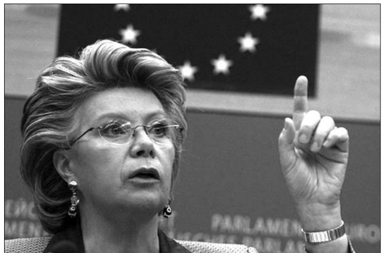
Viviane Reding uniós szerződésességű vádolja a franciákat

Megbírságolta a nagyváradi önkormányzat Tőkés László fiát, amiért engedély nélkül nyitott kávézót a Körös-parti városban. (Gándul) ▶ Az utóbbi öt év legsúlyosabb „apanázsát” küldték haza az országba a külföldre szakadt román állampolgárok 2010 első félévében. Bár a BNR adatai szerint a magánszemélyek pénztartalásainak összege tizenöt százalékkal maradt el 2009 hasonló időszakától, így is meghaladta a 2,1 milliárd eurót. (Adevărul) ▶ A román polgárok 61 százaléka elégedetlen a hazai oktatási rendszerrel, és szívesen küldené gyermekét külföldi tanintézménybe. (Adevărul) ▶ Hónap végén Romániába látogat Jacques Rogge, a NOB elnöke, aki a nagyváradi Területi Olimpiai Tanulmányi és Kutatási Központ felavatásán vesz részt. (Curentul)