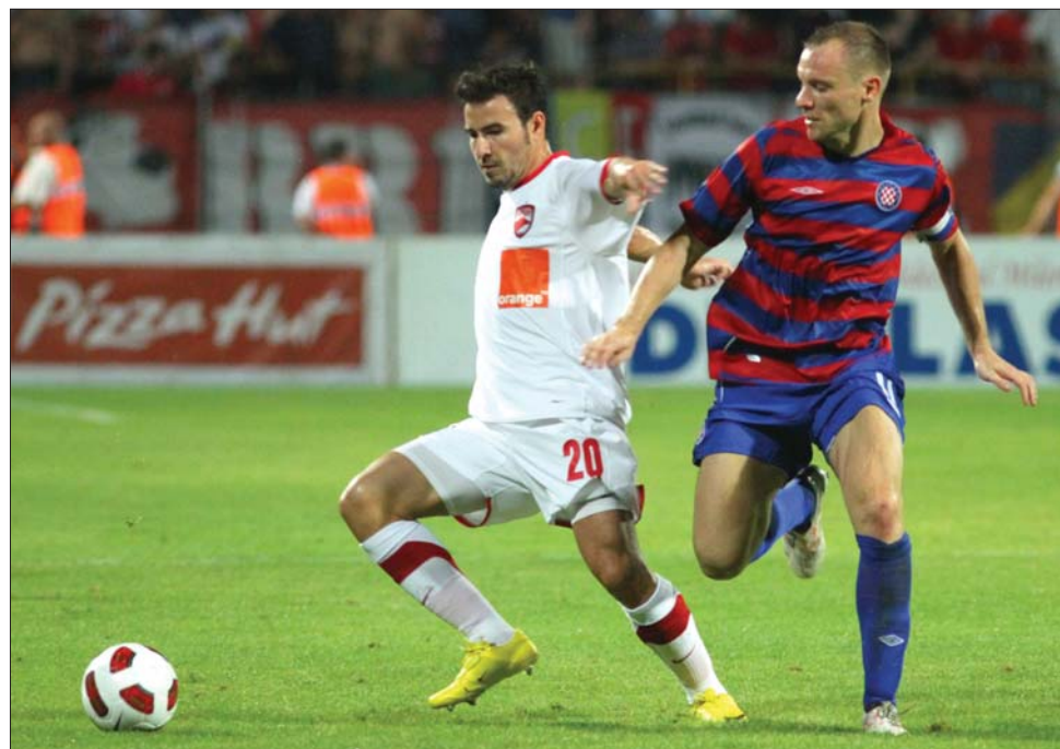
A Liga 1 őszi szakaszában a Dinamo játékosai (fehér mez) vannak a legjobb formában