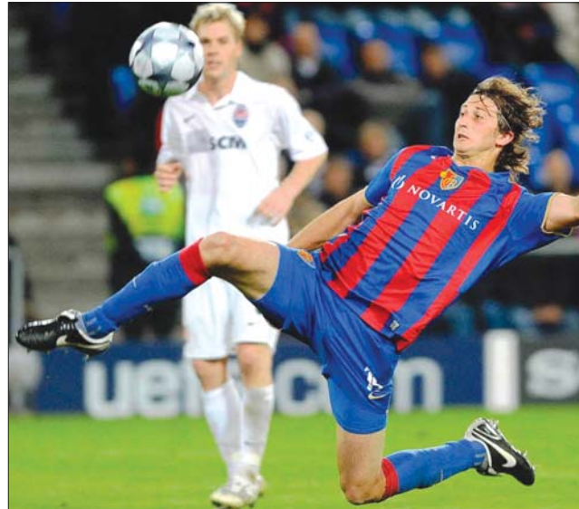
A svájciak a Sheriff Tiraszpol legyőzése után jönnek Kolozsvárra

Az F-csoportban Zsolnán, a szlovák bajnok MSK és a Chelsea találkozik. Mindkét