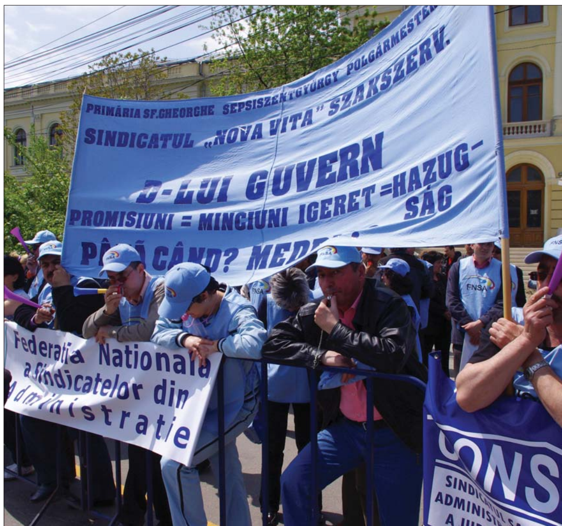
A szakszervezetek ma már képtelenek összehangolni tervezett tiltakozó akcióikat