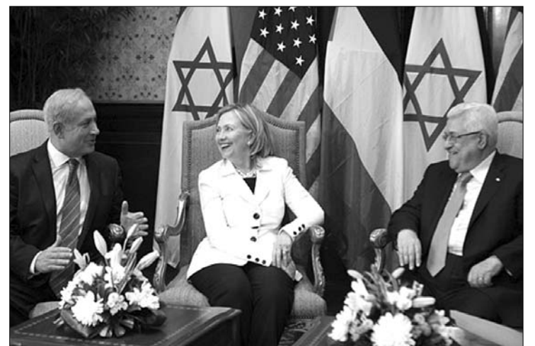
Benjámín Netanjahu, Hillary Clinton és Mahmúd Abbász Sarm-el-Sejkben

Mitchell közölte, hogy a tárgyalások ma, Clinton részvételével Jeruzsálemben folytatódnak, s az izraeli és palesztin tárgyalóküldöttség a következő napokban ismét összeül, mielőtt a csúcstelepek újabb találkozót tartanak. ►