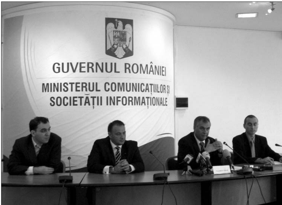
Valerian Vreme távközlési miniszter: év végéig kiépítjük az online adófizetési rendszert

„Az illetékek online kifizetését lehetővé tevő rendszer egy technikai platformon működő hálózatot jelent, szervereket, szoftvereket, melyek működését a minisztérium biztosítja. Ezt az Adó- és pénzügyi Hivatallal (ANAF) közösen hozzuk létre – magyarázta az ÜMSZ kérdésére az államtitkár. – A rendszer segítségével az interneten keresztül bárholonnan ki lehet fizetni a különböző illetékeket és adókat. Egy online nyomtatvány kitöltésével az összeg átutalható anélkül, hogy a polgároknak be kellene menniük a közhivatalba, vagy a bankba. Ez a lehetőség jelentősen egyszerűsíti az ügyintézés menetét és