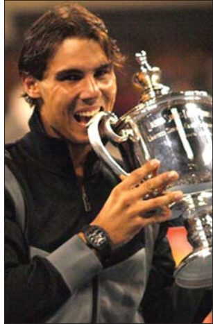
Rafael Nadal

▶ A spanyol Rafael Nadal nyerte a férfi egyes döntőjét a szerb Novak Djokovic ellen a New Yorkban zajló amerikai nyílt teniszbajnokságon. Az eső miatt hétfőre halasztott döntőt félbe kellett szakítani csaknem két órára – a második szettben 4-4-es állásnál –, mert ismét eleredt az eső a flushing meadows-i centrum felett. A 24 éves Nadal 3 óra 43 perces küzdelemben győzte le Djokovicot: 6-4, 5-7, 6-4, 6-2. A US Open megnyerésével Rafael Nadal lett minden idők harmadik legfiatalabb –