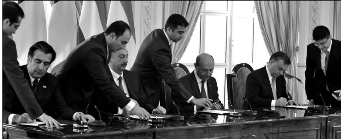
A gázvezetékromán részről Traian Băsescu, magyar részről Orbán Viktor kormányfő írta alá