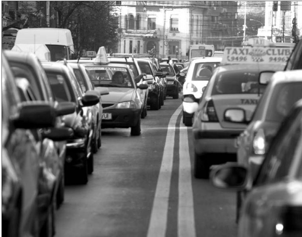
Kifizető a körültekintő közlekedés az érvényben lévő szabályok szerint