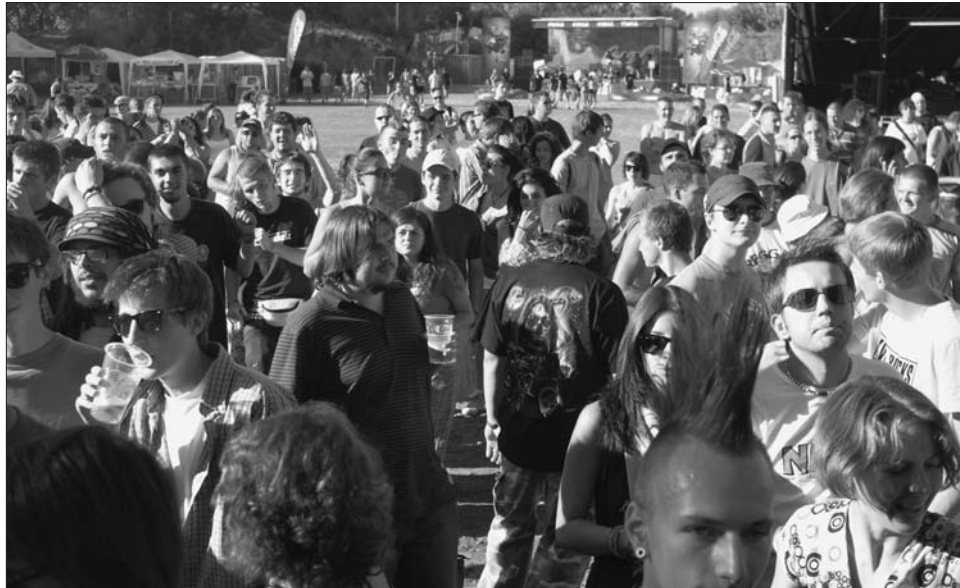
Elkezdődött a marosvásárhelyi Vikend-telepen Erdély legnagyobb fesztiválja