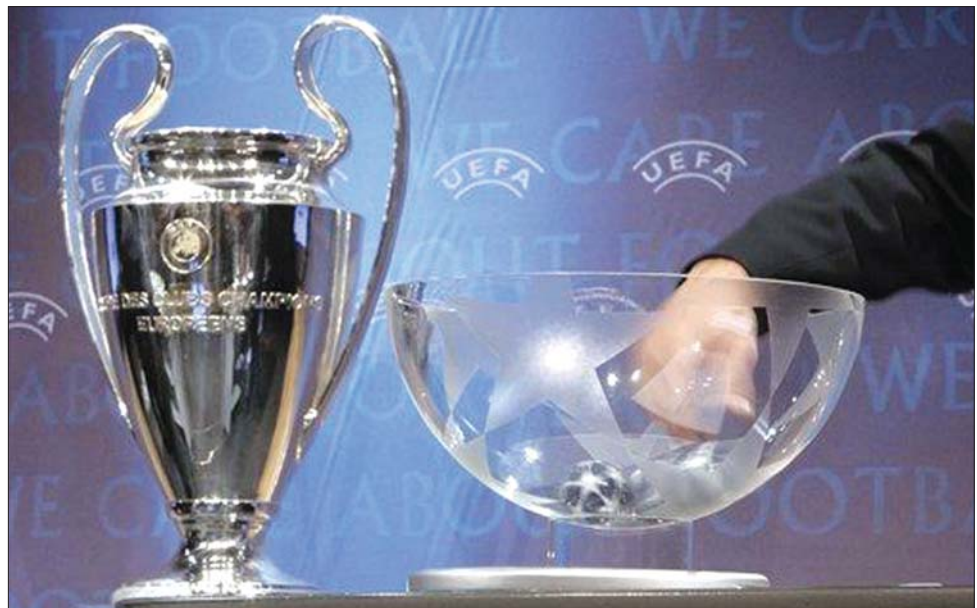
A kolozsvári vasutasok egy csoportba kerültek a Bayern Münchnel, az AS Rómával és az FC Bázellel

Megnevezték az év legjobbjait is: Julio César (kapus, Internazionale), Maicon (háttvéd, Internazionale), Wesley Sneijder (középpályás, Internazionale) és Diego Milito (csatár, Internazionale). Közülük utóbbit választották 2010 legjobb labdarúgójának. ◀