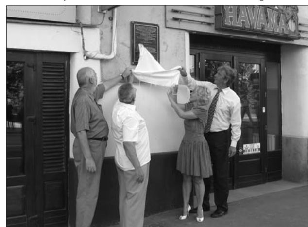
Régi és új táblát is felavattak tegnap Nagyváradon