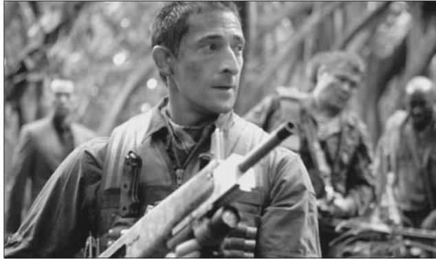
Adrien Brody merész „sikváltása” a legújabb Predator-film főszerepe – a közönség dönt, bejött-e neki

A magyar rendező akcióhorrorja lendületes, a megfelelő arányban véres alkotás, legnagyobb erőssége viszont mégis – legalábbis a rajongók szemében – az elődfilmek előtti tisztelgés: őserdőben játszódik, akárcsak az első rész, a Predator-vadászok/áldozatok hasonlítanak a '87-es, Schwarzenegger vezette csapathoz, akárcsak fegyvereik, de, mondhatni, nem változott a Predatorok hőrzékeltés látása sem. A szereplőválasztás, helyesebben főszereplőválasztás azonban nem biztos, hogy a legszerencsésebb. A Zongoristában (2002, rendező: Roman Polanski) való játékaért Oscarral jutalmazott, szintén magyar származású Adrien Brody, úgy vélem, nem a legihletettebb opció – bár lehet, csak az előítélet mondatja ezt. Akárcsak a „Predator-analfabétákkal” azt, hogy ez egy rossz film.