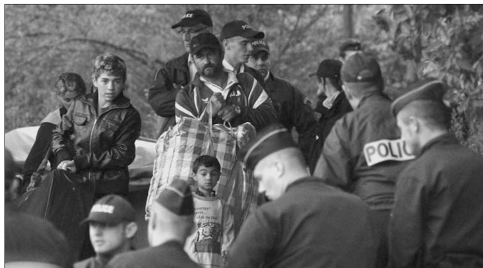
Több tucat francia rendőr gondoskodott arról, hogy a Romániába hazatelepülő felüljenek a gépre