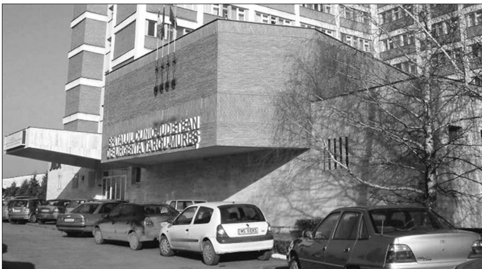
A stratégiai fontosságú marosvásárhelyi kórházakban sincs elég orvos és ápoló

A működésképtelenség hátán vergődő intézményekben azonban már elfogyott a türelem. Maros megyében 200 meglévő poszt betöltését tiltja az érvényben lévő rendelkezés, az ország egyik legtekintélyesebb egészségügyi központjában krónikus szakemberhiánnyal küzd az intenzív terápia, az idegsebészeti osztály, a sürgősségi ügyelet, a neonatológia, és elengedhetetlenül szükség lenne aneszteziológusok alkalmazására is. A Maros megyei Egészségügyi Igazgatóság tájékoztatása szerint jelenleg 6134 alkalmazottal