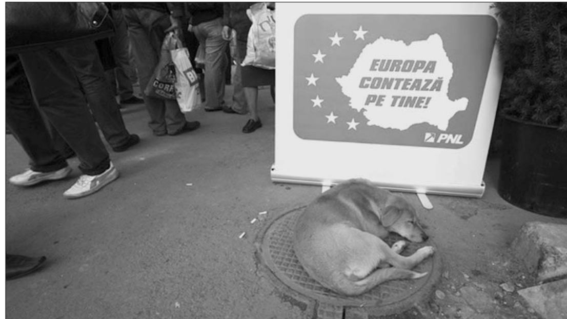
Európa számít rád – hirdették EP-kampányokban a romániai pártok. A választók már nem számítanak az EU-ra