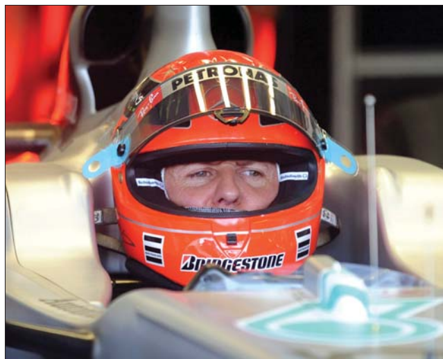
Michael Schumacher tíz helyes rajtbüntetést kapott

„Nem igazán értettem, hogy miért büntettek meg. Pedig remekül kezdtem, sikerült Fernando támadását visszaverni az első kanyarban. Az újrakezdésnél problémák voltak a rádióval, nem nagyon tudtam, hogy mikor megy majd ki a biztonsági autó. Szerencsétlen voltam, és csalódott vagyok, úgy gondoltam, meg tudom nyerni a mai versenyt” – kesergett a harmadik helyen célba ért Sebastian Vettel, aki 1:22,362 perccel a leggyorsabb kört futotta a Hungaroringen. ◀