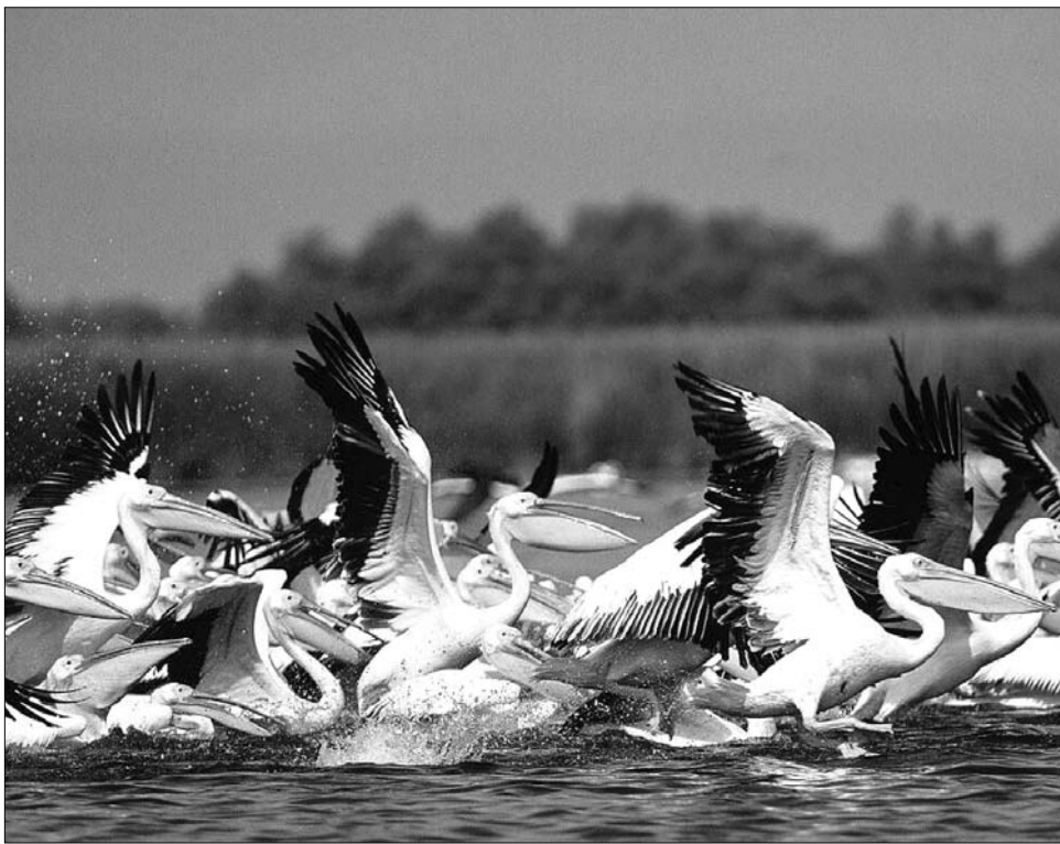
Csatornaépítési láz a Duna-deltában. Veszélybe kerülhet a térség csodálatos élővilága?

A két ország között áprilisban diplomáciai tárgyalások folytak a kérdéstről – minden eredmény nélkül. Ukrajna azt veti Románia szemére, hogy „gerilla-taktikát” foly-