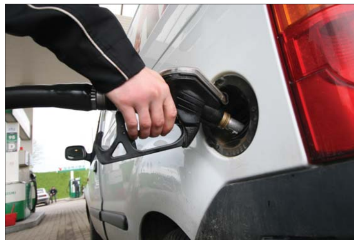
Becslések szerint a benzin ára hamarosan a 6 lej is elérheti

▶ Hat lej fölé emelkedhet rövidesen az üzemanyag ára, ha a jelenlegi világgazdasági feltételek nem változnak, vélik a román olajpiacon jelen levő szereplők, akik ugyanakkor rámutatnak: az árdrágulás nemcsak a fogyasztó zsebébe csapolja majd meg, hanem az olajtársaságok bevételeit is. 6. oldal ▶