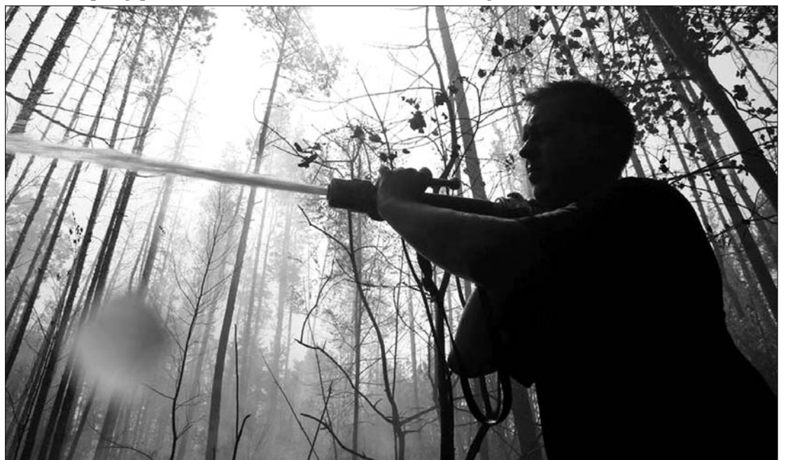
Harcban a lángokkal. Az oroszországi erdőtüzek halálos áldozatainak száma tegnap 34-re emelkedett

akadt terület, ahol a fák koronájának csúcán terjedt hatalmas sebességgel a tűz. A Nyizsnij Novgorod-i repülőteret tegnap a sűrű füstköd, a csekély látási távolság miatt lezárták a forgalom elől. Moszkvában a repülőterek működnek, a szmog a kora délutáni órákra valamennyire elszórt, és enyhült a levegő szennyezettsége. A délelőtti órákban számos káros anyagból a megengedett érték 3-8-szorosát mérték, és estére várhatóan újra romlik a helyzet. Egyes szakértők szerint Moszkvában a füst egész héten érezhető lesz. ◀