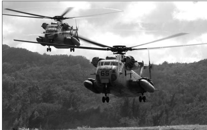
A Sikorsky CH-53 Sea Stallion típusú helikopter

Hivatalos bejelentés szerint az izraeli és a román hadsereg közös hadgyakorlatot tart Blue Sky 2010 elnevezéssel. A The Times tel-avivi beszámolójában izraeli katonai forrásokra hivatkozva viszont azt írta, hogy az izraeli fél egy esetleges iráni hadművelet végrehajtását gyakorolja. A szimuláció részeként többek közt a különleges erők szállítását, kutató- és mentőakciók idegen kör-