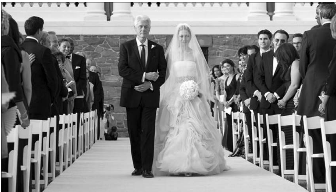
Bill Clinton oltárhoz vezette Chelsea lányát. A kézfogóra több híresség is hivatalos volt