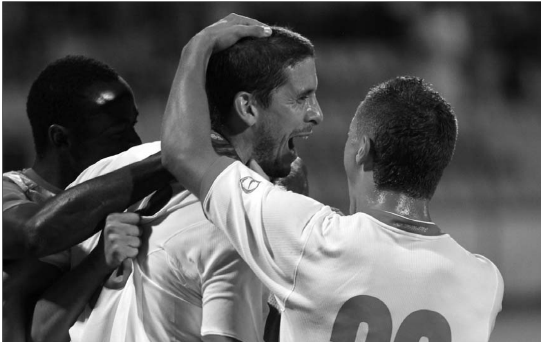
Dinamos gölöröm. A bukaresti gárda nem ijedt meg sem a horvát csatároktól, sem szurkolóiktól

További eredmények: FC Utrecht (holland) – Luzern (sváj-