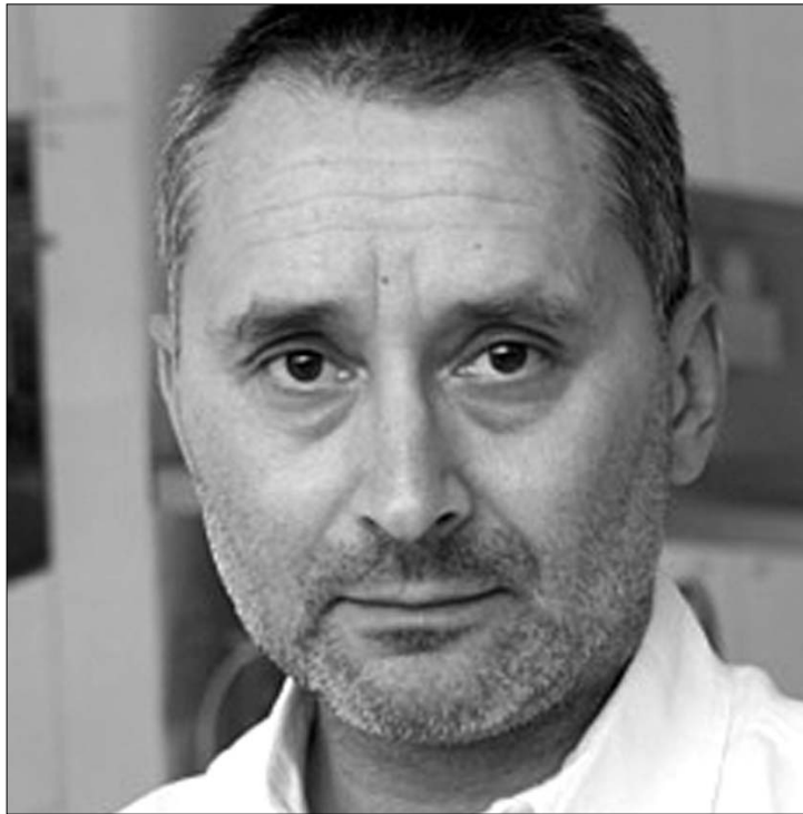
Such György négy évig vezette a magyar közszolgálati rádiót

Az intézmény által kiadott közlemény szerint Such György szakmailag és gazdaságilag legyengült közszolgálati rádiót vett át négy éve, és azt mára stabilan gazdálkodó, modern, hallgatott és népszerű intézménnyé alakította. Négy évvel ezelőtt 47 millió forint hitelből fedezett forráshállyal vette át az intézményt és mandátumának lejártakor mintegy 2 milliárd forintos bankbetét mellett adta át a közrádiót. Mint írták, a hatékony gazdálkodásnak, valamint a költségtakarékos működésnek köszönhetően nyereséggé vált a Magyar Rádió, az elmúlt évet 187 millió forint mérleg szerinti nyereséggel zárta.