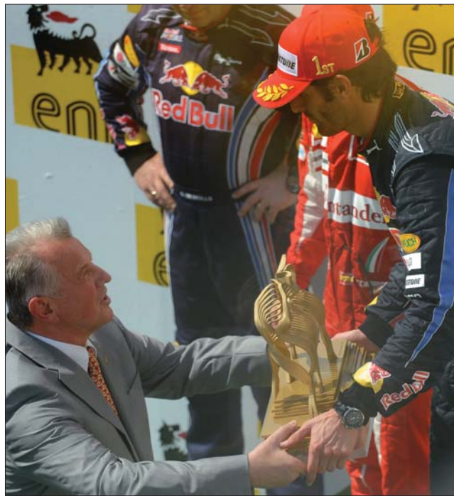
A tróféát Schmitt Pál adta át Mark Webbernek

A boksztucában sok minden történt: Nico Rosberg Mercedesének jobb hátsó keréke önálló útra kelt, Robert Kubica (Renault) figyelmen kívül hagyása pedig a lengyelt és a német Adrian Sutilt