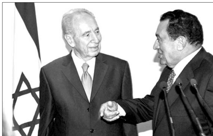
Simon Peresz és Hoszni Mubarak a közel-keleti békéről egyeztetett

ben, hogy közvetlenül egyeztessen a zsidó állammal. Abbasz ezt feltételekhez köti: Izraelnek le kell állítania a megszállt területeken a zsidó telepek építését, és bele kell egyeznie a palesztin állam létrejöttébe az 1967 előtti határok alapján. A Palesztin Hatóság elnökét több arab ország is támogatja ebben a követelésében, mert attól tartanak, hogy Benjámín Netanjahu izraeli kormányfő a végtelenségig elhúzná a tárgyalásokat, hogy azt a látszatot keltse – az Egyesült Államok és az Európai Unió előtt –, hogy kész a meg egyezésre „a területet békéért” elv alapján. ◀