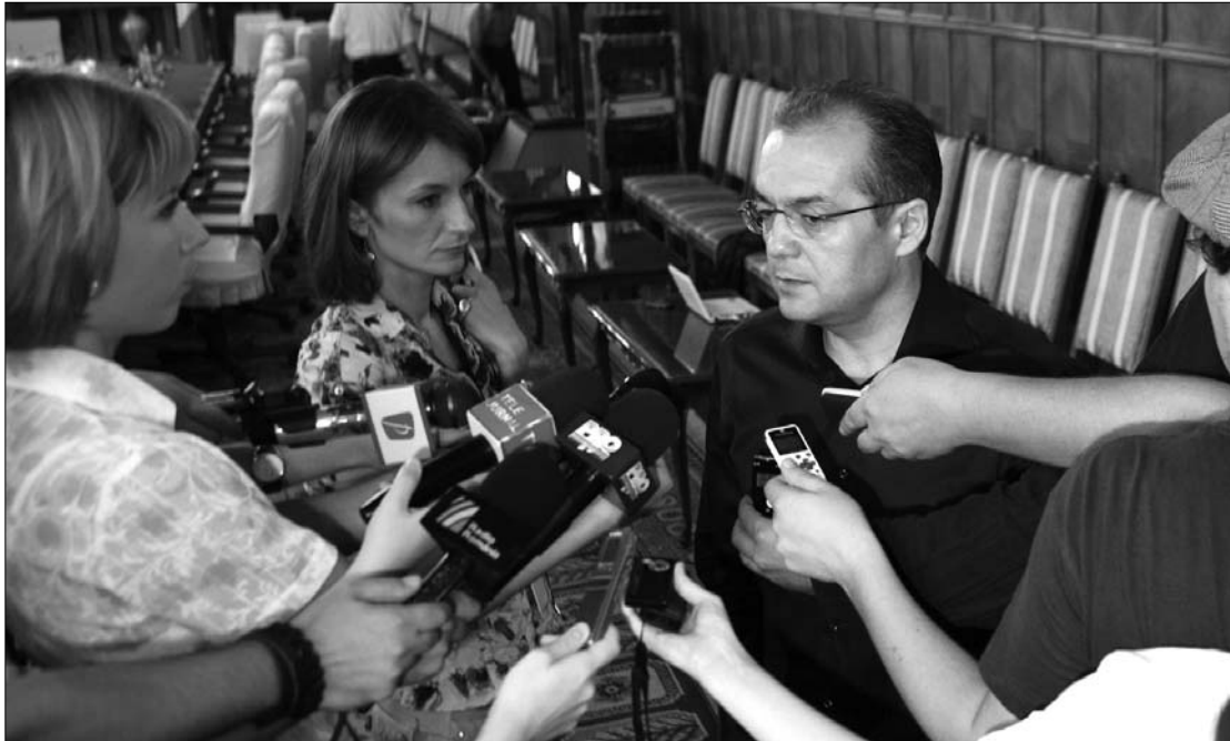
Emil Boc kormányfő jövőre gazdasági növekedést vár. Eddig az adatok ellentmondtak a várakozásoknak.

A román bruttó hazai termék (GDP) várhatóan 1,7-1,9 százalékkal csökken az idén – jelentette ki a hétvégén Sebastian Vlădescu román pénzügyminiszter. Korábban a Nemzetközi Valutaalap (IMF) és Bukarest arra számított, hogy 2010-ben a román gazdaság stagnálni fog, vagy legrosszabb