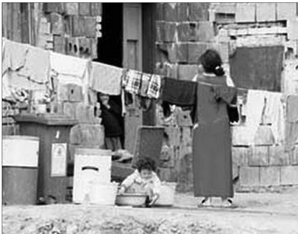
Roma „csendélet” valahol Franciaországban

Hortefeux úgy tervezi, hogy az erről szóló törvényt már szeptember végén betervezheti a nemzetgyűlésnek. Az intézkedésekkel kapcsolatban a megválasztott hangnem az igazán feltűnő. A belügyi és rendőrmiszter a televízióban nyilatkozva többször is elismételte, hogy kormányja az események nyomán „offenzívába” megy át. A pénzügyi vizsgálat pedig – érvelt a politikus – a sok lakókocsin és a „sokhengeres” limuzinokon alapul. A Franciaországban élő négyszáz ezer külföldi roma kétharmada már megtelepedett, sokuk életszínvonalja azonban jócskán a szegénységi küszöb alatt van. A nagyobb településeket azonban különböző törvények arra kényszerítik, hogy az úton lévőknél települést bocsásson rendelkezésre. A negyvenkétezer ilyen helyből azonban mindmáig nagyjából húszezer valósult meg. A szocialista párt