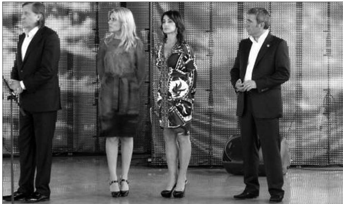
Ilie Năstase, Elena Udrea, Nadia Comăneci és Gheorghe Hagi Románia márkanévének sanghaji bemutatóján