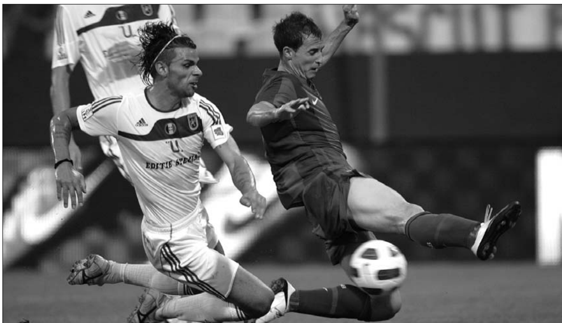
A craioviaiak (világos mez) néhány percre voltak csak a forduló meglepetéséül

vúrhoz miután Roman már a 21. percben betalált. Az utolsó másodpercekben Gladstone mentett pontot a moldovai gárdának, 1-1. Urziceni-ben 0-0-ra mérkőzött az Unirea és a Rapid, utóbbiak sérülés miatt elvesztették Cēsinhát és Constantint is. Tegnap további három mérkőzésre került sor, de lapzártáig csak a Szászmedgyesi Gaz Metan – Temesvári FC összecsapás fejeződött be (2-2). A Brassói FC a Kolozsvári U-val mérkőzött, a Dinamo pedig az újonc Sportul Studentesc-et fogadta. Ma este fél 9-kor a Kolozsvári CFR 1907 – Victoria Brănești találkozó zárja a második forduló műsorát. ◀