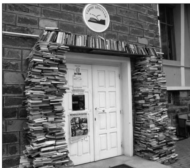
A könyv kapu, átjáró a tudás és a profán világ között