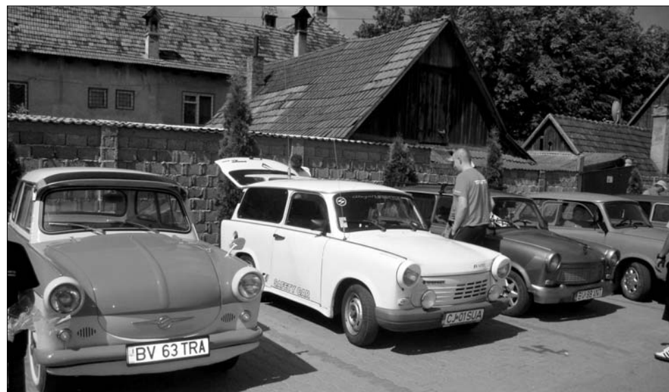
A Trabant nemcsak egy autó, hanem egy életérzés – állítják a tulajdonosok

ról is többen idepöfögnek. A legöregebb autó a hétvégi felhozatalon egy rózsaszínű, 1963-as évjáratú Wartburg volt, de sokan érdeklődtek a Brassóból érkező Szafial Ladislau tulajdonában lévő, 83-as kabrió-Trabant iránt is. A gyorsaság szerelmeseit egy 100 lóerősre tuningolt Trabant ejtette ámulatba. ◀