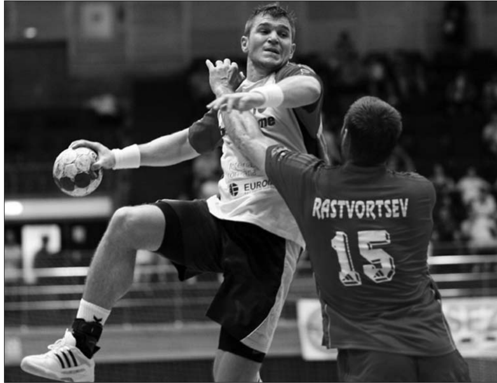
A románok átlőtték magukat az orosz védelmen és kijutottak a svédországi vébére

A többi 12 helyből Európa 9-et, az Amerikák pedig 3-at kapnak. A göteborgi sorsoláson a 24 vb-résztvevőt négy, hatos csoportba osztják, a mérkőzéseknek Malmö, Lund, Kristianstad, Göteborg, Skövde, Jönköping, Linköping és Norrköping ad majd otthont. ◀