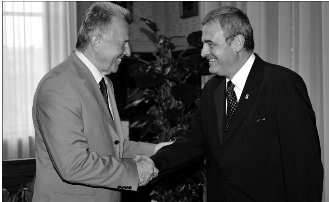
Előttem az utódom. Schmitt Pál magyar házelnök gratulált Tőkés Lászlónak a megválasztásához