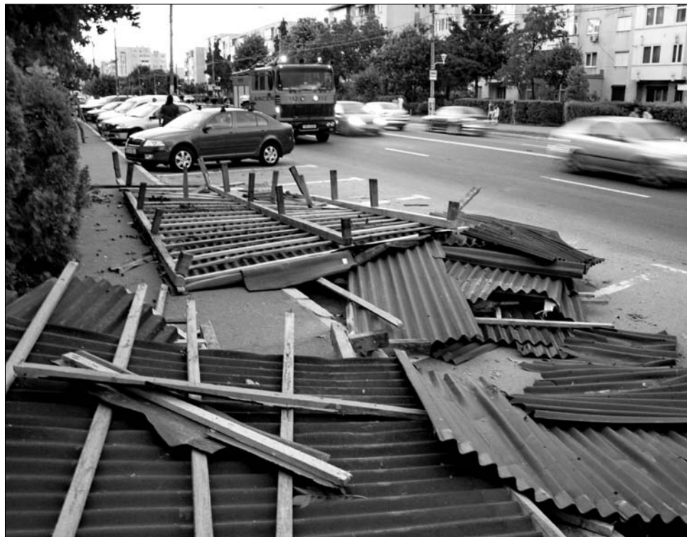
Szászmedgyesen fákat tépott ki, háztetőket sodort le a szokatlan erejű szél a hétvégén

A Fehér megyei katasztrófaelhárításról számolt be, hogy több száz segélykérő telefont kaptak, nagyon sok lakástulajdonos maradt szó szerint fedél nélkül, miután a vihar letépte a házak tetejét. 118 ingatlanról érkezett kárbejelentés, súlyosan megsérült többek között a helyi baptista imaház és a kultúrotthon is. Az utóbbinak porrá zúzta a jég az ablakait. Nem kímélte a jég és a széldöntés az Oláhgorbó határában lévő szőlőst sem, több hektárnyi szőlőtöke veszett oda.