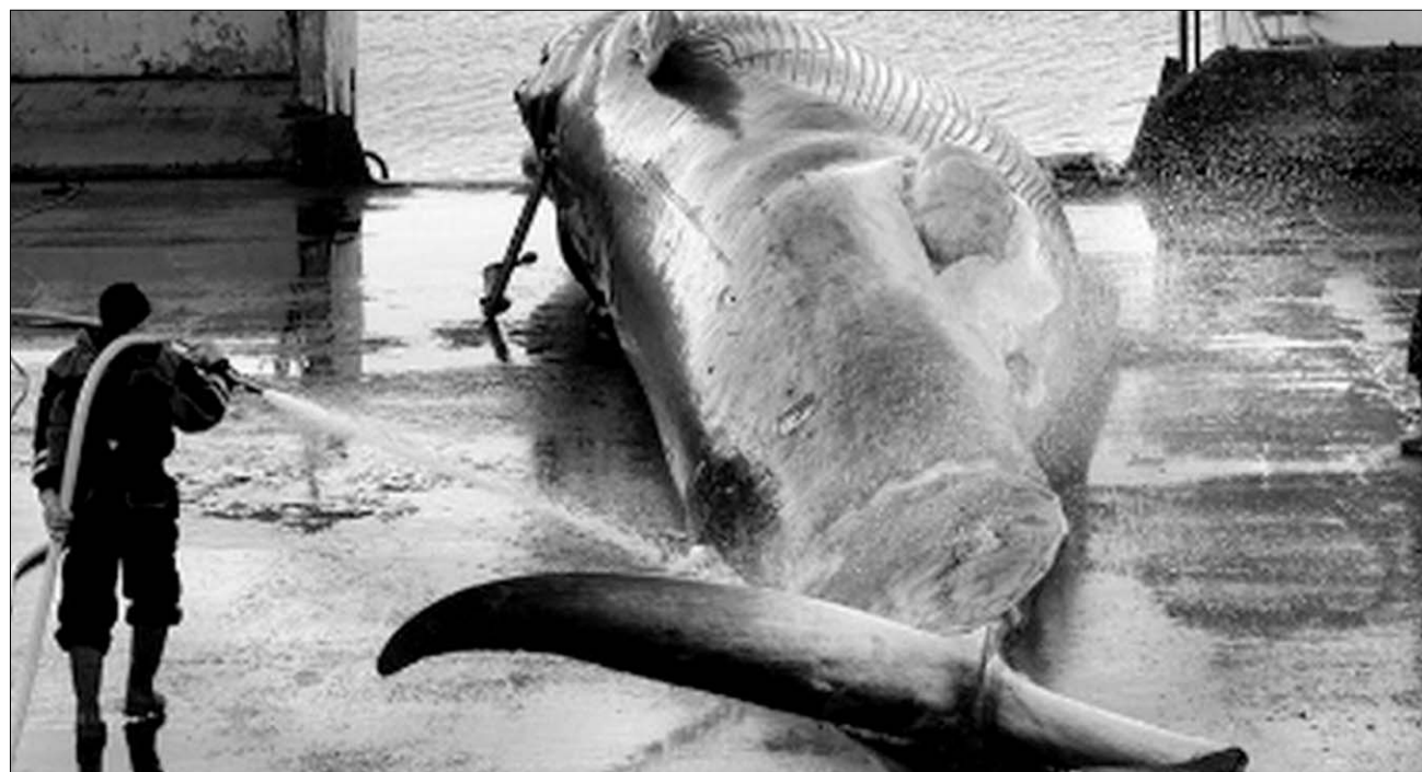
Véres bálnavadászat az északi szigetországban. Izland európai uniós tagságának sarkalatos kérdése lesz?

Ennek a bővítésnek – lásuk be – az Európai Unió számára is megvolna a maga haszna, elsősorban az így rendelkezésre álló, szinte kimondhatatlanul nagy mennyiségű megújuló energia és a stratégiai fontosságú fekvéssel az Atlanti-óceán északi részén. Izland ugyanis „pótolhatja” azt az őr, amit a Dániához tartozó Grönland kiválása okozott (1982-ben népszavazás döntött, és 1985-ben be is következett). Utóbbival ellentétben azonban Izlandot – amely a Föld tizenharmadik és Európa második legnagyobb szigete – földrészünkhöz tartozónak, nem pedig részeként kezeljük; kulturális, gazdasági és nyelvi szempontból is tartozik. Genetikai kutatások kimutatták, hogy a férfilakosság zöme a vikingek utódainak tekintendő (a számúzott Vörös Erik innen hódította meg Grönlandot), a nők viszont skót és ír, azaz kelta származásúak. Az ország 1944-ben vívta ki függetlenségét Dániával szemben. ◀