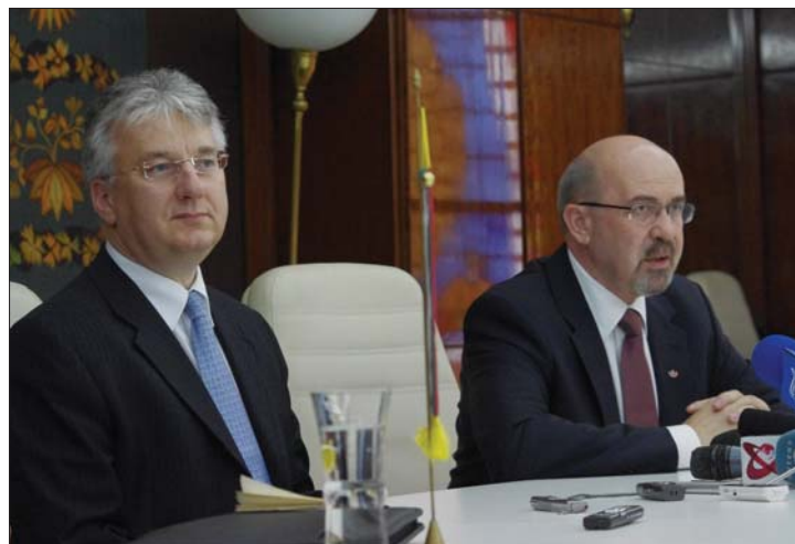
Kormányfőhelyettesek randija: Semjén Zsolt és Markó Béla

▶ Három napig tartó, négy helyszínen zajló romániai látogatása alatt Semjén Zsolt magyar kormányfőhelyettes a román–magyar és magyar–magyar témák mindegyikét „átvette” vendéglátóival. Semjén már Bukarestben kiütötte az adut a magyar állampolgárság megadását ellenzők kezéből. 3. oldal ▶