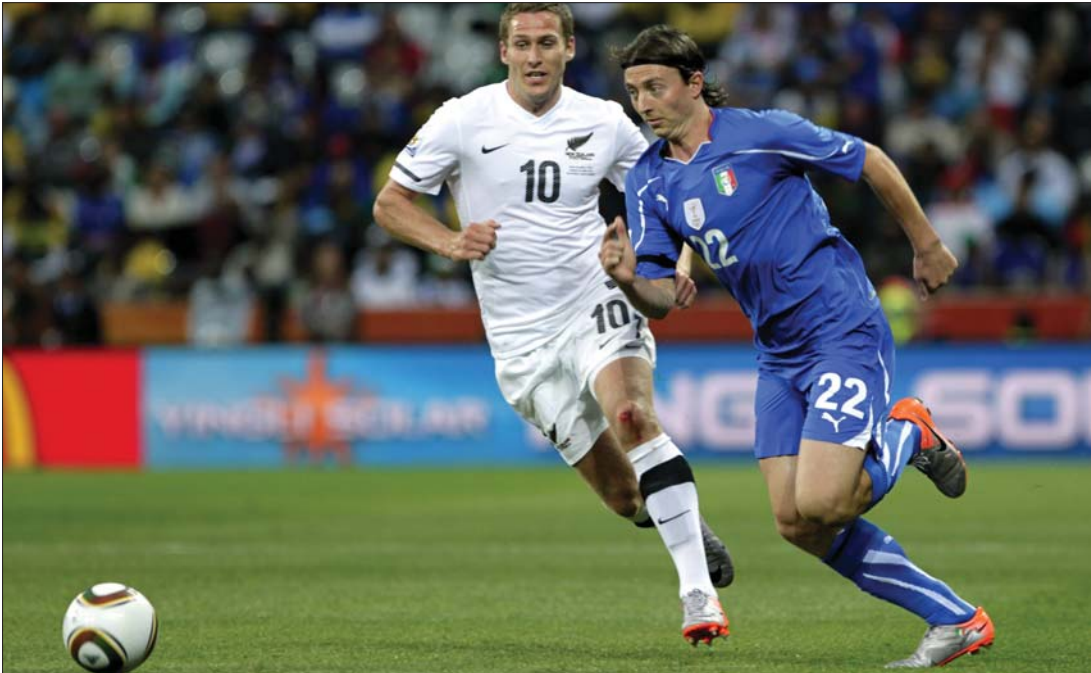
Az olaszok (kék mezben) a paraguayiak után az új-zélandi gárdát is képtelenek voltak legyőzni

elején, amelyeknek nehéz hazai bajnokságaik vannak: Spanyolország, Olaszország, Anglia. Ami Franciaországot illeti, Jenei szerint mindehhez hozzájárulnak a belső feszültségek is, amelyek a csapatot feszítik. „Az a nagycsapat tud majd kilábalni ebből a gödörből, amelynek az edzője regenerálni képes játékosait a csoportbeli mérkőzések után. Csak hogy odáig előbb el kell jutni” – somlázott a szakember.