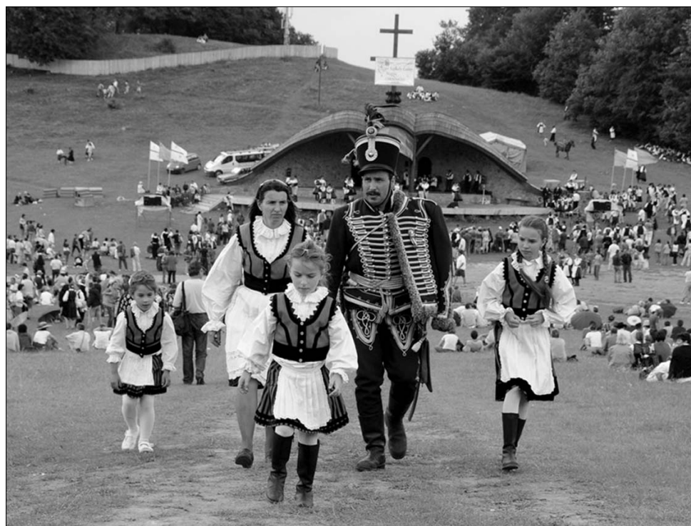
Idén néprajzkutatók vizsgálják a népviseletek eredetiségét is a csíksomlyói rendezvényen