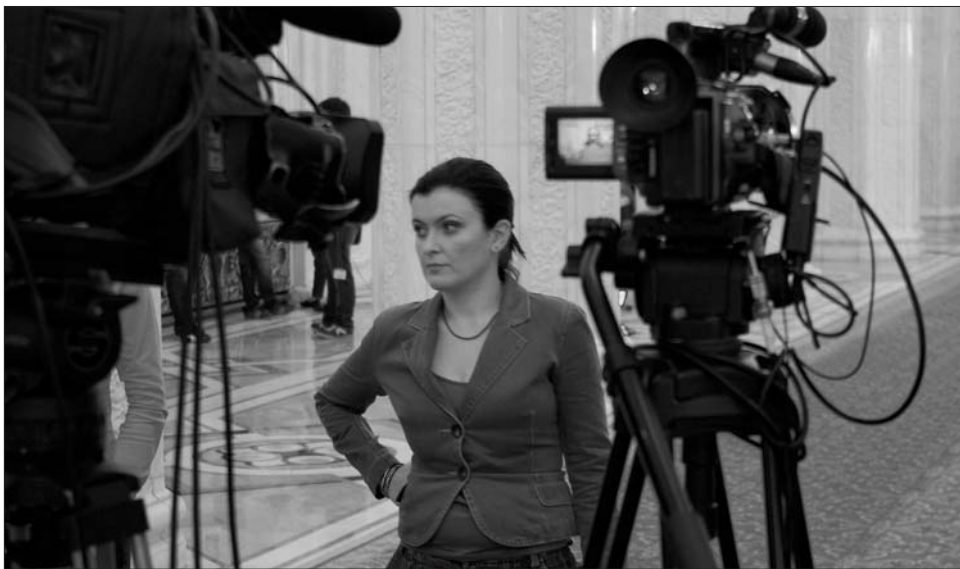
A színészeknek és az újságíróknak is érvágást jelent a júliustól hatályba lépő új Adótörvénykönyv

A szerzői jogdíjból élők megszorogatására további terveket főzött ki a kormány, a hamarosan hatályba lépő