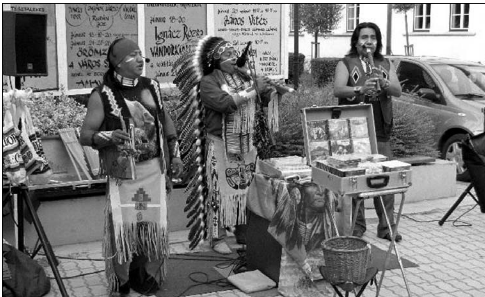
Az equadori AMAWÁS együttes indián népzenevel szórakoztatta a hétvégén érkezőket

A fesztivál első napján Madách Imre művét, Az ember tragédiáját mutatta be az Újvidéki Színház Kokan Mladenovic rendezésében. A szerb