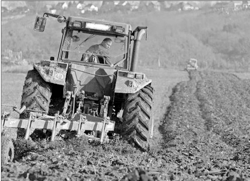
Az országban sokan visszaadták gázolajutalványokat, mert nem érdemes földet művelni

Felhasználatlan gázolajjegyek Fehér megyében is maradtak – tudtuk meg. Talvány mintegy hatszáz tonna üzemanyagra volt igény, holott sokkal több állt rendelkezésükre. A térségben az elmúlt évben 26 ezer hektár termőföldet egyáltal-