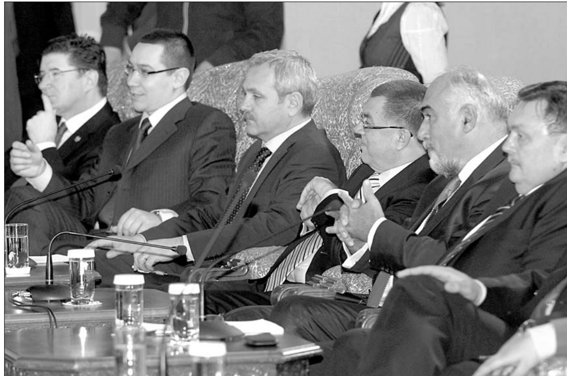
A szociáldemokraták és liberálisok ismét egy oldalra helyezkedtek Traian Băsescu államfő ellenében