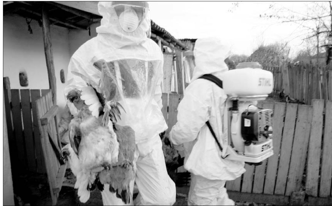
Öt évvel ezelőtt, a kór első felbukkanásakor a szárnyasok fele kipusztult a Duna-deltában