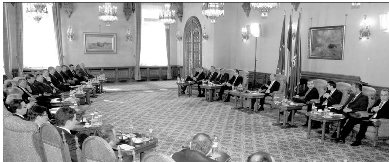
Elnöki konzultáció Cotroceni-ben. Traian Băsescu – legalábbis formálisan – a parlamenti pártok véleményére is kíváncsi

regionális tanácsosok lennének. Kiterjesztené az államfő hatásköreit, a legfőbb állami méltóság betöltője válhatna az ország általános problémáival és nemzetközi kérdésekkel foglalkozó testület, rendszeresen elnökölné a kormányüléseken. Preda az alkotmánybíróság összetételén is változtatna: a taláros testület tagjai között jelentős közéleti tapasztalat-