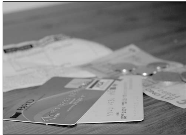
Az ügyfelek nyernek – a bank veszíthet a rendelettel