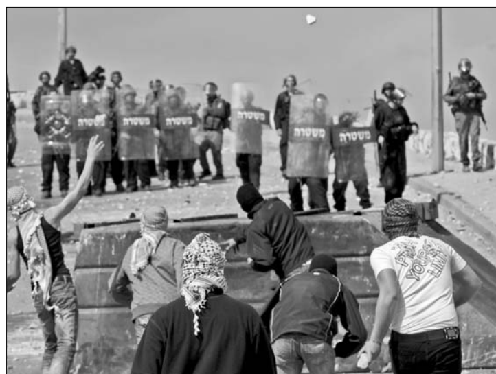
A palesztinok köveket dobáltak a rendőrökre Jeruzsálemben

► Több száz palesztin csapott izraeli össze rendőrökkel tegnap Kelet-Jeruzsálem különböző negyedeiben – közölték szemtanúk. Ezt megelőzően jelentette be Miki Rózenfeld rendőrségi szóvivő, hogy jelentősen megerősítették tegnapra virradóan Jeruzsálem keleti részén az izraeli rendőrség készségét, mert a városrészben tömeges palesztin megmozdulás van kialakulóban. Mint mondta akkor, a palesztinok köveket dobálnak, gumiabroncsokat és szemeteskukákat gyűjtanak fel. A rendőrök könnyfakasztó gránátok bevetésével és gumilövedékekkel válaszoltak – közölték szemtanúk. Orvosok közlése szerint mintegy negyven palesztint szállítottak kelet-jeruzsálemi kórhá-