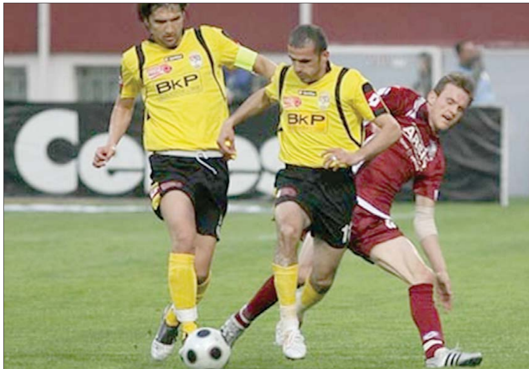
Továbbra sincs döntés a Rapid–Temesvár-mérkőzés ügyében. A LPF átpasszolta az esetet a FRF-nek