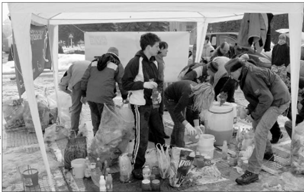
Megdöbbentette a környezetvédőket a marosvásárhelyi önkormányzat indokolatlan szigora

Egyesület menjen Csíkszeredába használt olajat gyűjteni” – adott hangot felháborodásának a miniszter. Az ÚMSZ-nek ért utasította el korábban a civil szervezet folyamódványát, az alpolgármester rövid tájékoztatást adott: az önkormányzat vezetője szerint ez az akció rontja a városképet. Borbély László környezetvédelmi miniszter – maga is marosvásárhelyi lakos – azonban úgy véli, a különös konfliktus mögött sokkal súlyosabb okok állnak. „Egyértelműen magyarellenés Marosvásárhely polgármestere, amikor azt tanácsolja, hogy a Zöld Székelyföld