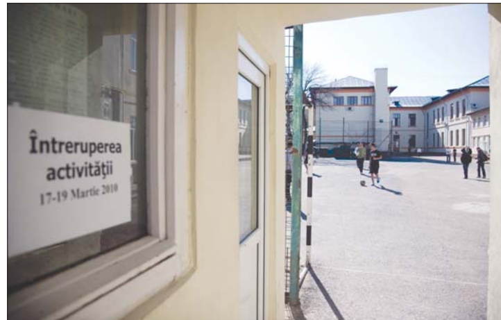
A buzăui iskolákban tegnapról péntekig szünetel az oktatás.

lére beharangozott tiltakozó akcióikat. A pedagógusok azonban eltökéltek: márciusig 25-ig naponta sztrájkorséget tartanak egy-egy megyében. 7. oldal ▶