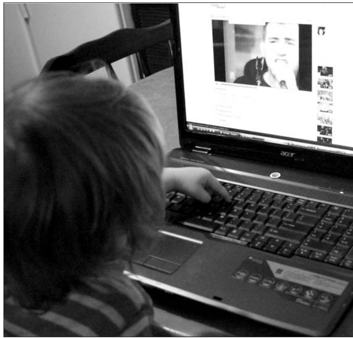
Szakemberek és szülők is aggódnak az internetező gyerekekért

„A gyerek védelmét még csecsemőkorban el kell kezdeni azáltal, hogy átgondoljuk a saját viszonyunkat az internethez, szülőként saját magunk számára állítunk korlátokat, nem adunk a gyerekeknek követendő modellt ebben a tekintetben” – figyelmeztet a szakember.