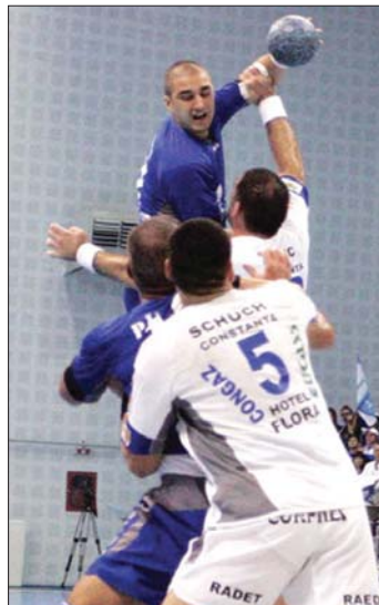
Rangadóra készül a Konstanca

A nők sem pihenhetnek a héten. Miközben Románia felnőtt válogatottja holnap Mulhouseban játszik barátságos mérkőzést a franciákkal, addig a hazai pontvadászatban a Râmnicu Vâlcea-i Olthchim ma 16 órától pótolja be a 16. fordulóból elmaradt HC Roman elleni összecsapását (a DigiSport közvetíti), míg holnap 11 órakor Bákóban lép pályára a huszadik etapból előre hozott összecsapáson. ◀