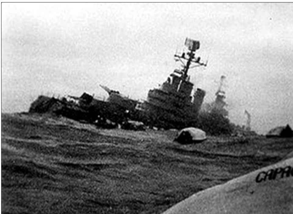
1982. április 30. Süllyed az argentin flotta zászlóshajója, egy brit vadásztengeralttjáró eltalálta

A háború 255 brit és 649 argentin katona életébe ke-