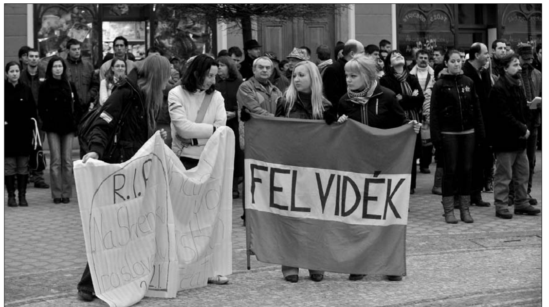
A tüntetők a magyar nyelv melletti kiálláson túl toleranciára és együttműködésre szólítottak fel

tüntetés, nincs köze a pártpolitikához. Egyrészt nem szeretnék, ha a pártpolitika rátelepedne a rendezvényre, másrészt azt is el akarják kerülni, hogy bármiféle támadás érje az egyetemet a tüntetés miatt. „A révkomáromi egyetemisták tüntetést szerveznek a szabad anyanyelvhasználatért, hogy kifejezzék nemtetszésüket a jelenleg zajló folyamatok ellen, melyek látható célja a magyar nyelv elnyomása. Ezt nem szabad hagyni!” – olvasható a tüntetésre szóló felhívásban. ◀