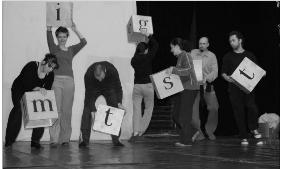
Két hete tart a Figura legújabb előadásának próbafolyamata, melynek műfaja is határeset

A darab kiindulópontja Danyi Zoltán vajdasági író Csak egy mondat című novellája. Az elbeszélés egy moszkvai színház gazdasági igazgatójának, Grigorij Danyilovicsnak egy életmozzanatát mutatja be, aki egyszer csak rádöbben, hogy neki írnia kell, egy regényben kell megtalálnia saját megvalósulását, tökéletességét. Elvonulva a világtól, csendes magányában