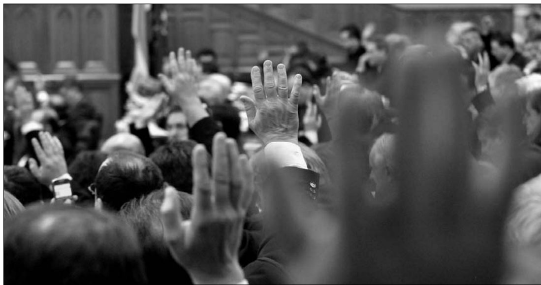
Az Országgyűlés 197 igen, egy nem szavazattal és 142 tartózkodás mellett fogadta el az MSZP- indítványt