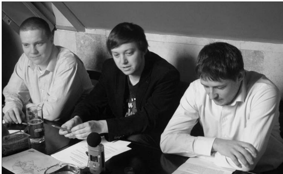
A verseny megváltozott szabályzatát ismertették tegnap a humorfesztivál szervezői