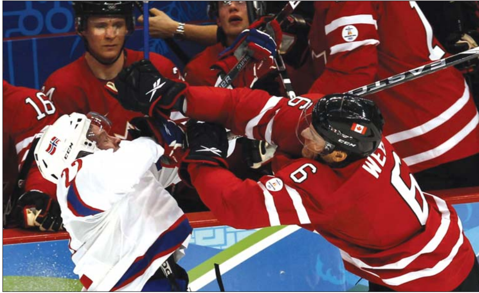
Összecsaptak a norvégok és a kanadaiak, de a juharlevelesek lenyomták a skandinávokat

A németek másik aranyérmét is egy hölgy sportoló gyűjtötte be, mégpedig Tatjana Höfner, a szánkósok mezőnyében. Mögötte az