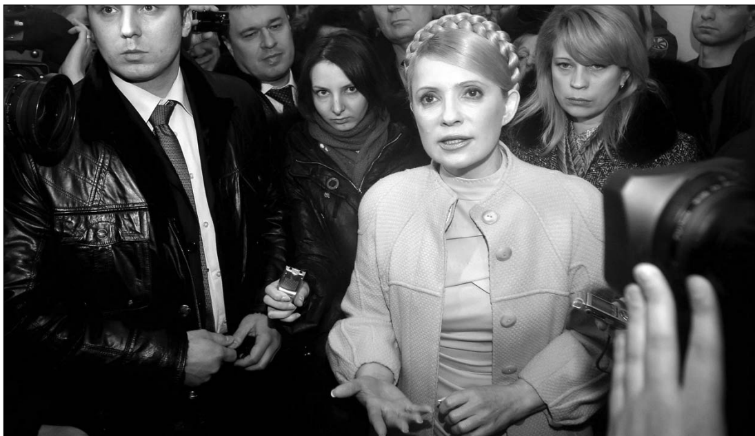
Julija Timosenko kormányfő nem hagyja magát, és egyelőre nyugalomra inti híveit

A külföldi megfigyelők szabadnak és szabályosnak minősítették a legutóbbi elnökválasztást, ami megkérdőjelezi Timosenko törekvésének esélyét, hogy a bírósággal semmisítse meg az eredményeket. ◀