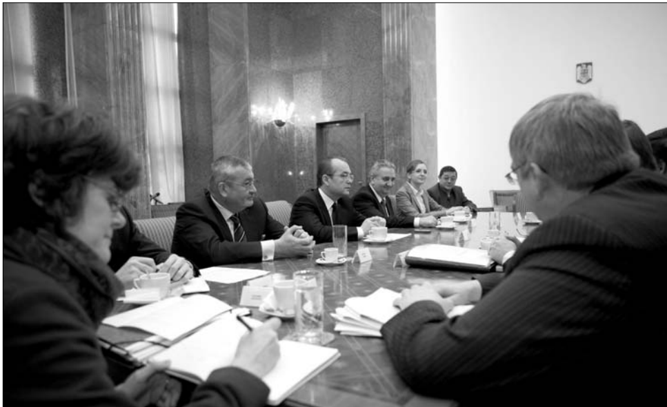
Tárgyalóasztalnál a kormány és a Valutaalap képviselői. Átázás vagy cinkosság?

Mindez eltörpül azonban az állam állammal szembeni adósságai mellett. A Gándul című bukaresti napilap gazdasági szakértőinek számításai szerint, csupán a Valutaalap által ellenőrzött tíz nagy állami társaság 1,3 milliárd eurós tartozást halmozott fel – ez az összeg tehát természetesen szintén nem került be a költségvetésbe.