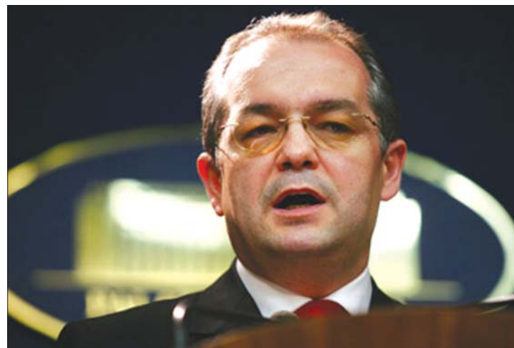
Emil Boc kormányfő büszkén hirdette a program folytatását

meg nem kezdett házakra, 75 ezer pedig a társas formában épített új ingatlanokra – erről döntött a kormány tegnapi ülésén. 6. oldal ▶