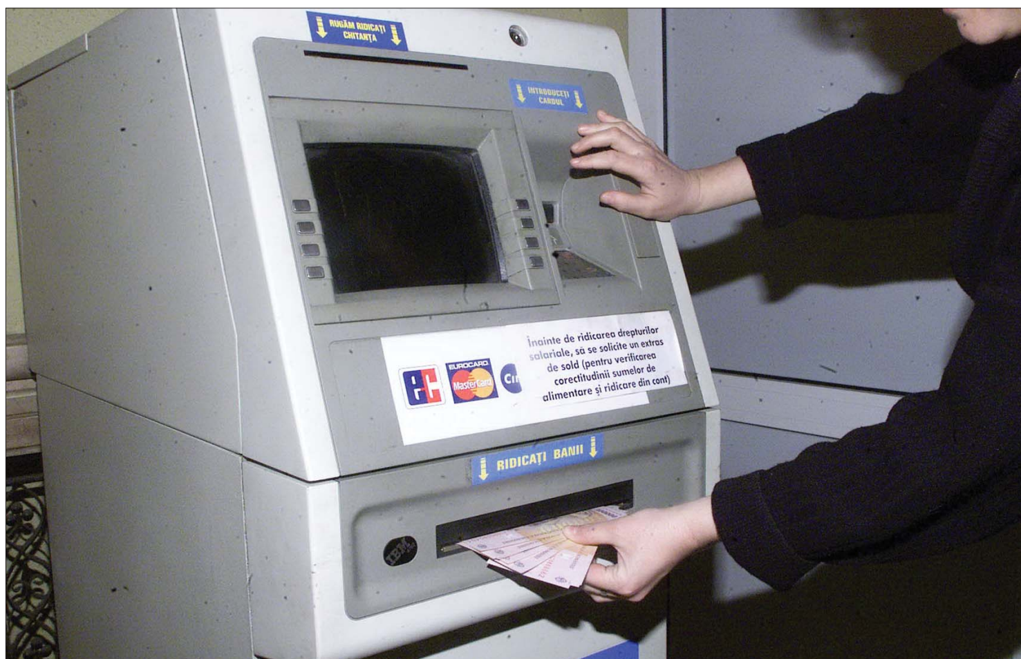
A közalkalmazottak arra panaszkodnak, ebben a hónapban kevesebb pénzt vehettek ki a bankautomatákból, mint a múlt hónapban

Hivatalnoki hibával indokolja a kormány a közalkalmazotti fizetések csökkenését