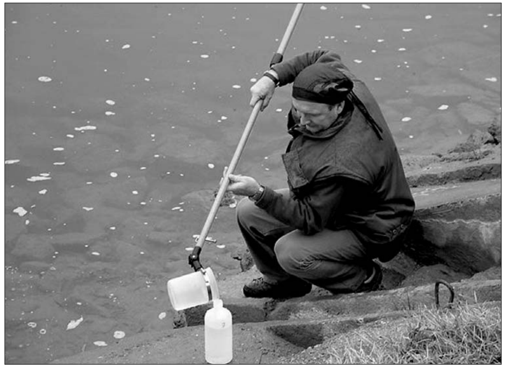
Mintát vesznek a Tisza vizéből. Az Aurul okozta szennyezés hatása még mindig érződik