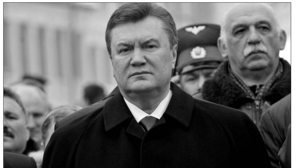
Viktor Janukovics. Elnökválasztási győzelme lehűtötte Európa reményeit

Az EU soros elnökeként 2011-ben Magyarország és Lengyelország várhatóan ismét előtérbe állítja Ukrajna hosszú távú EU-csatlakozási ambícióját. Politikai elemzők mindazonáltal kevés sikerre számítanak a további bővítéssel szembeni francia és a német ellenállás miatt. „Az az érzésem, hogy az