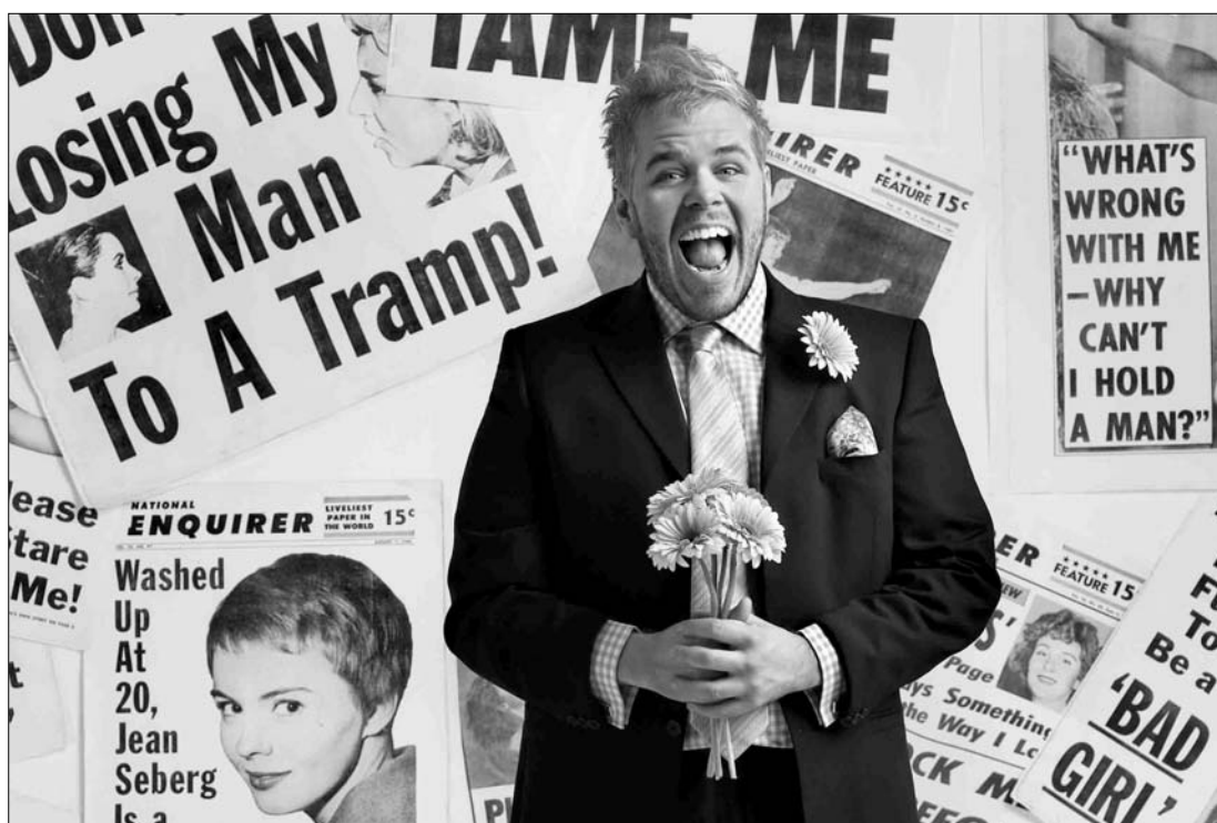
Perez, a Hollywood leggyűlöltebb oldalát működtető pletykablogger harmadik alkalommal a net legnépszerűbb figurája

A hírességekről tabuk nélkül beszélő Hilton a Twitter en is rendkívül népszerű, a közösségi oldalon hozzávetőleg 1,77 millió követőt számlál. Tavaly többek közt a melegházasságok ügyének felkarolásával hívta fel magára a figyelmet: a Miss USA szépségkirálynő-választás zsűrijébe is meghívták, ahol emlékezetes pillanatok keretében fag-