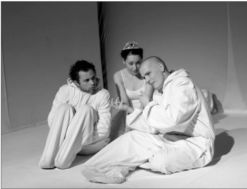
A színészek eszköztelenül, a teatralitást mellőzve találták meg a közvetlen kapcsolatot a nézőkkel

Jevgenyij Griskovec Tél című színdarabja két katonai utolsó éjszakáját mutatja be a szibériai hómezőkön. A katonákról csak annyit tudunk, hogy egy pontosan meg nem határozott paran-