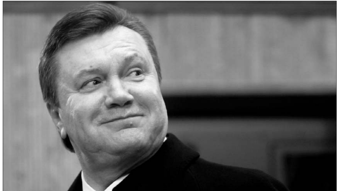
Viktor Janukovics máris lemondásra szólította ellenjelöltjét, Julija Timosenko miniszterelnököt

A Kárpátaljai Magyar Kulturális Szövetség (KMKSZ) szerint a