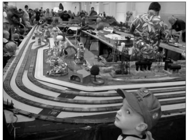
Nőtt az érdeklődés 2009-ben a villanyvasutak iránt

A Hasbro, a második legnagyobb amerikai játégyártó, jelentősen növelte adózott eredményét a decemberrel zárult negyedik negyedévben. Az akciósokról mintázott figurák növekvő eladásával, illetve a nagyobb reklám- és licenbevételekkel magyarázta a kedvező eredményt a cég – közölte az MTI.