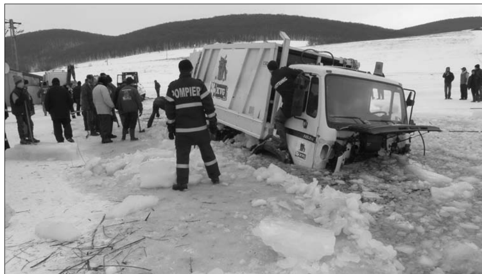
A hulladékszállító alatt betörött a hó jége, a jármű süllyedni kezdett