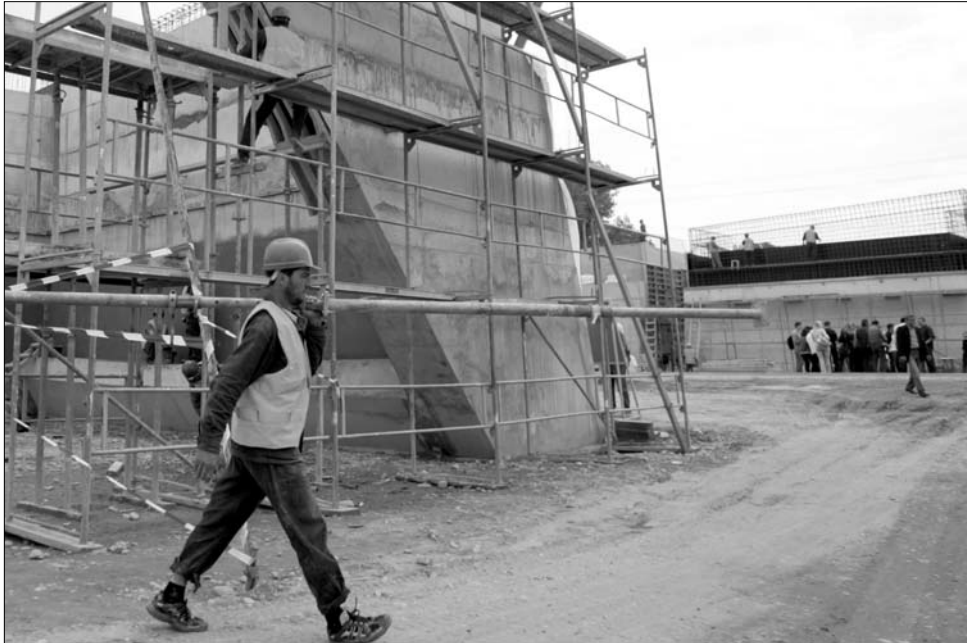
Újra felveszi a munka fonalát a Bechtel, de ha az állam nem fizet, le is állna az építéssel

A bejelentésre azt követően került sor, hogy a kivitelező és a szakszervezetek képviselői találkoztak Florin Stamatian kolozsvári prefektussal tegnap. „Egyelőre még folytatódnak a tárgyalások, reméljük, hogy jó híre-