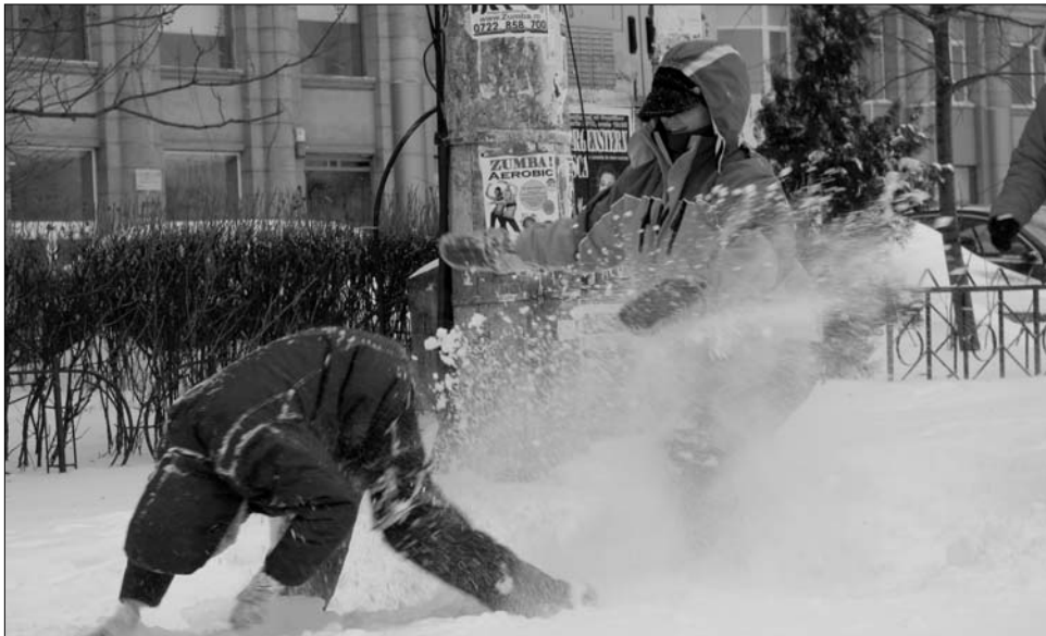
A rendkívüli havazás miatt ma sincs tanítás az ország több óvodájában és iskolájában

Azoknak, akik mégis útra indulnak, a szakemberek azt javasolják haladjanak a sebességhatárnál sokkal kisebb sebességgel, a követési távolságot tartsák be körültekintően,