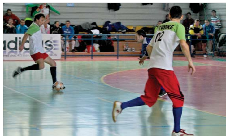
Bethlen csapata nyerte a „FairPlay 2010 per cent át” díjat.