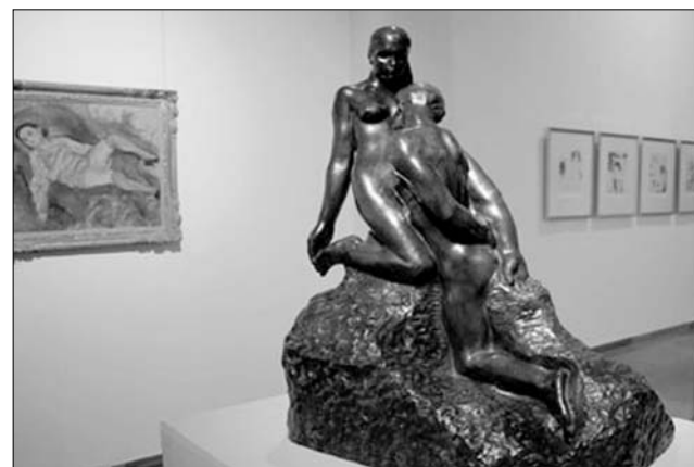
A Rodin-alkotás a Kasser-gyűjtemény „alapkőve”

Az első egység az Aranykor címet viseli, Rodin Az örök tavasz című kompozíciójával a középpontban, míg az ezzel szorosan egybeolvadó második, a Természet című rész, a természet inspiráló erejéről, a természetben rejtőző aranykori tökéletesség örök eszméjéről vall, egyebek mellett Renoir, André Derain és Alfred Sisley művein keresztül. Itt kapott helyet Monet Sziklatömb című festménye is, mely most szerepel először magyarországi tár-