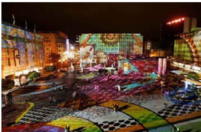
Vetített fény-installáció a Kennedy-Platzon