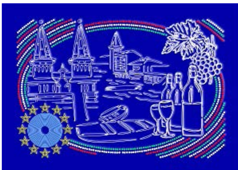
Balaton képek a hévízi fürdővel és a badacsonyi borral