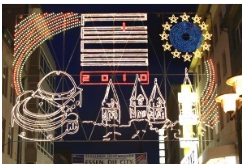
Pécs jellegzetes műemlék épületei