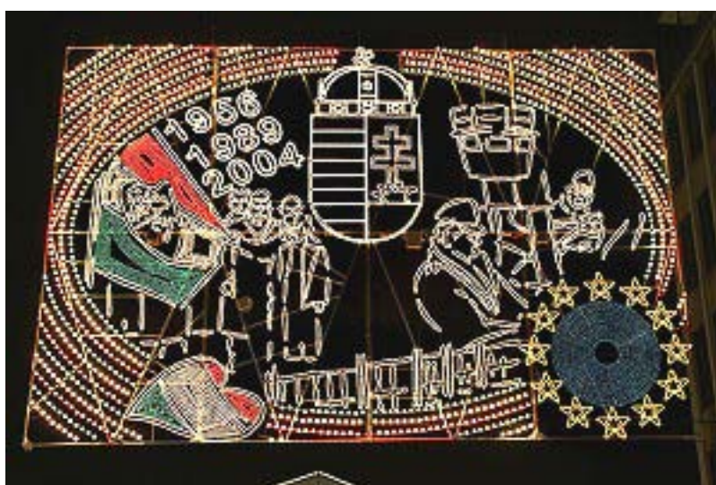
A magyar történelem táblója három nevezetes dátummal: 1956 a forradalom éve, 1989 a nyugati határ megnyitása az NDK-s menekültek előtt, és 2004, Magyarország uniós csatlakozása