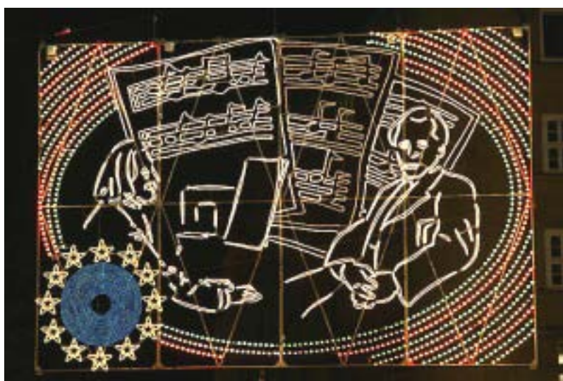
A magyar zenét Liszt Ferenc és Bartók Béla képviseli