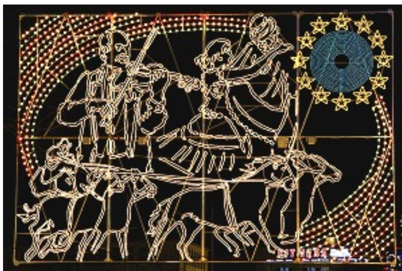
Amit a németek sokszor azonosítanak Magyarországgal: csárdás és a pusztai ötösfogat