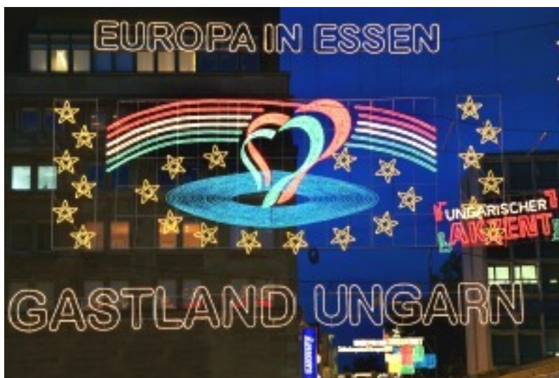
A rendezvény nyitóképe