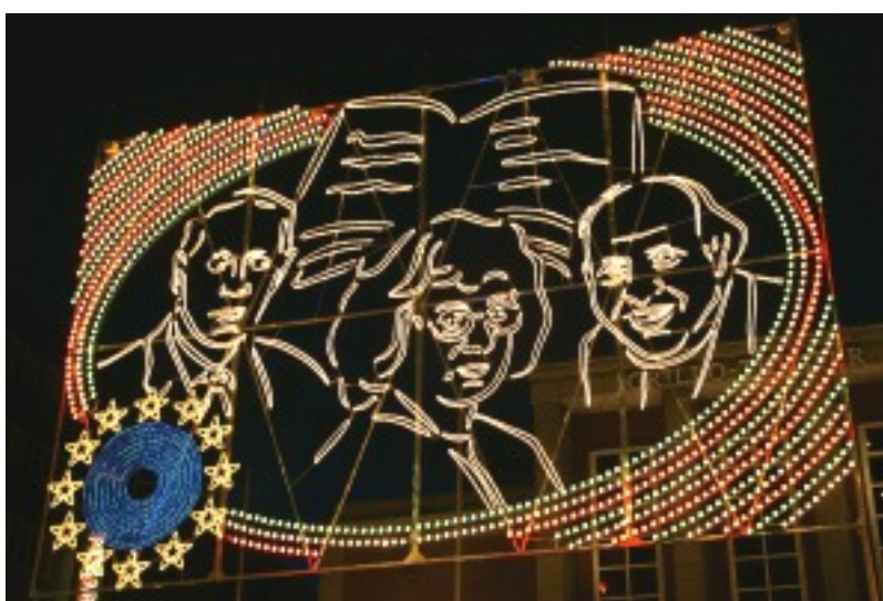
A magyar irodalom képviselői: Márai Sándor, Kertész Imre és Eszterházy Péter