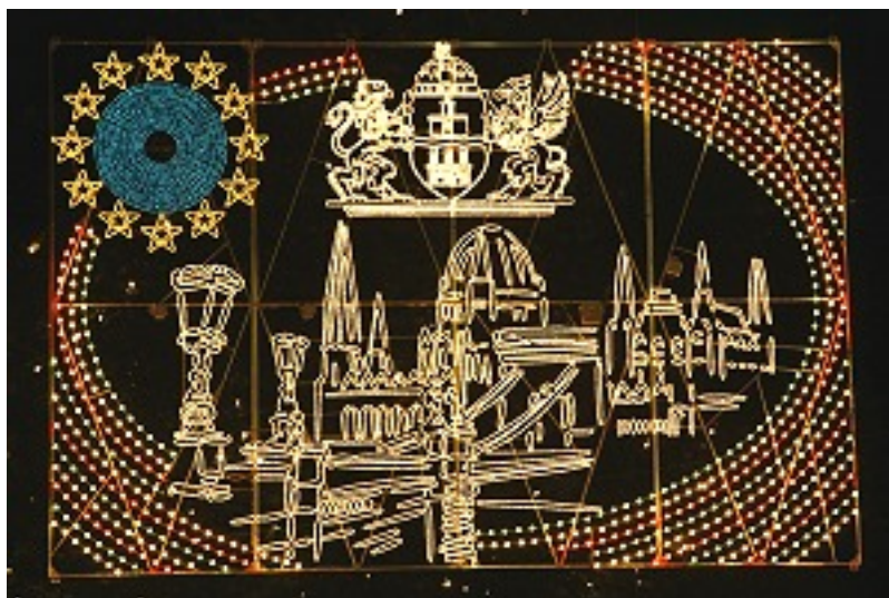
A főváros címere a Lánchíddal és a Parlamenttel