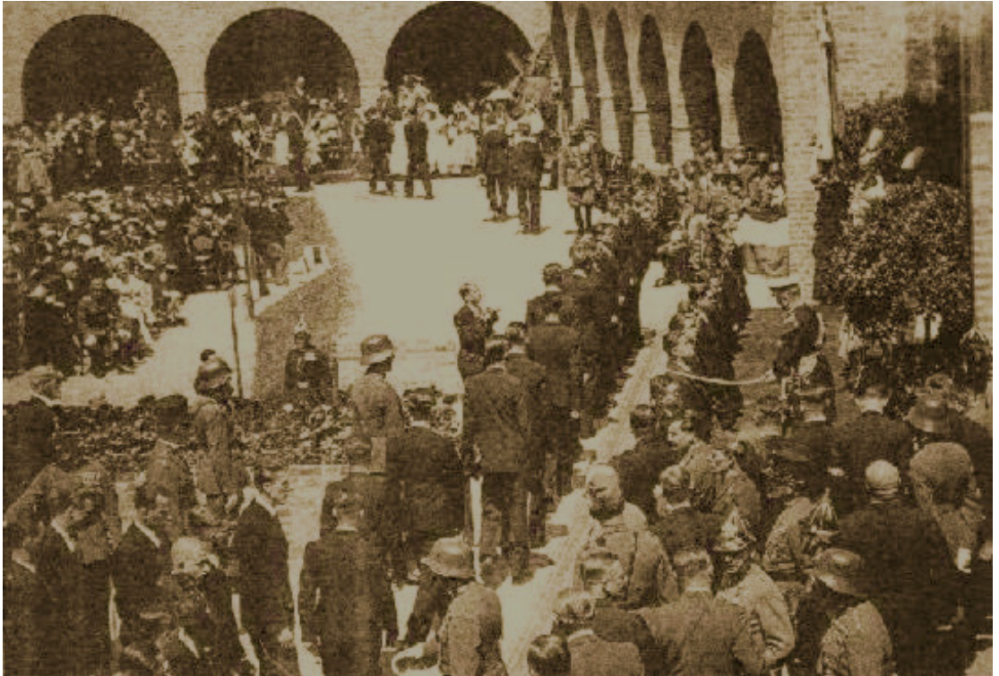
Az 1938. évi vitézavatás a székesfehérvári romkertben, 1938. május 22.