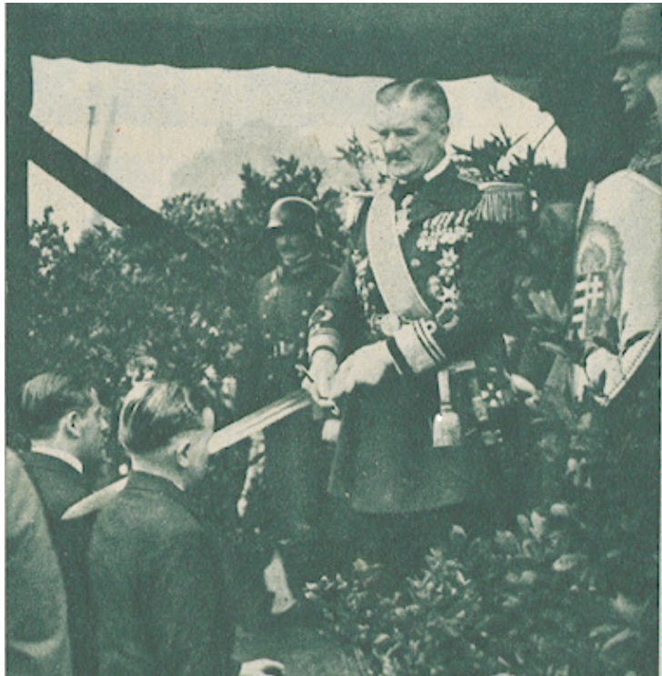
Vitézavatás a MAC pályáján, 1924. június 3.