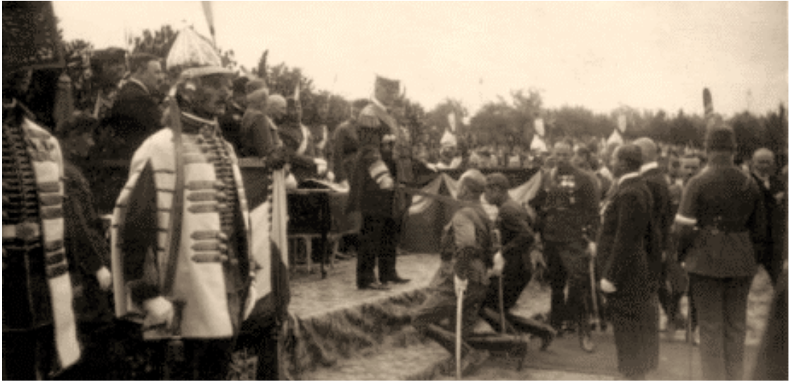
Vitézavatás az 1920-as években