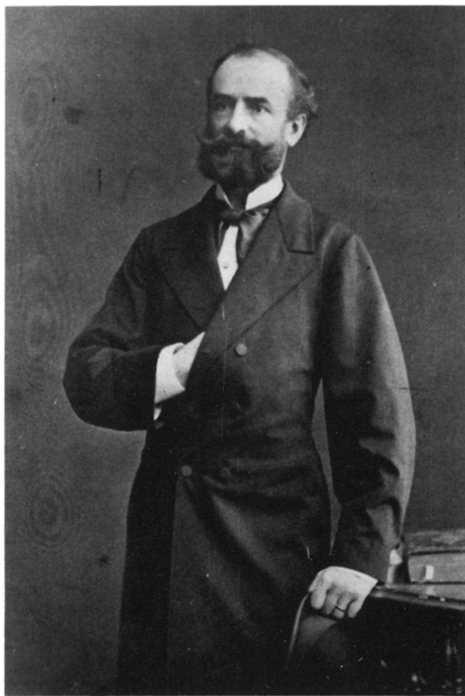
1. ábra. TELEGGI ROTH Lajos (1841–1928) arcképe

sulat elnöke, 1912-től tiszteletbeli tagja. A Földtani Közlöny 1925. évi LV. kötetét tiszteletére "TELEGGI ROTH Lajos jubileumi kötetként" adták ki.