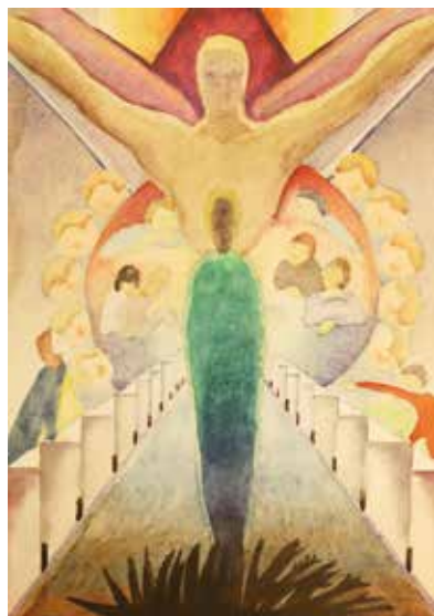
6. Áronson Gábor: Kozmikus jelenet , 1960 körül papír, akvarell, 35 × 24,5 cm MTA Pszichiátriai Művészeti Gyűjtemény, Itsz. 93.14, fotó © Hámosi Péter