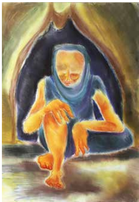
13. B. B.: Fáradtság , 1988 papír, pasztell, 43 × 30,5 cm MTA Pszichiátriai Művészeti Gyűjtemény, ltsz. 96.26