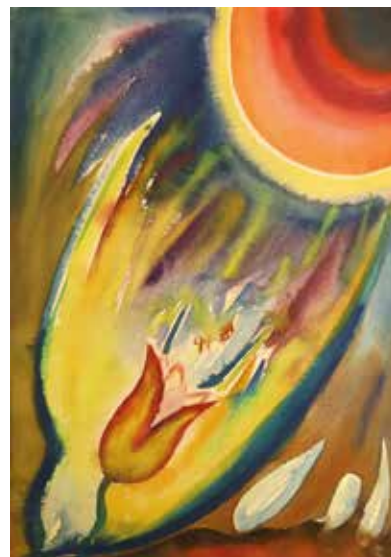
8. Áronson Gábor: Tulipán Napkoronggal I. , 1959. papír, akvarell, 35,5 × 25,5 cm MTA Pszichiátriai Művészeti Gyűjtemény, Itsz. 93.5

American Journal of Art Therapy , 18 az Amerikai Művészetterápiás Társaság (American Association of Art Therapy) lapja, részletes és gazdagon illusztrált körtörténeteket, valamint a művészetterápia elméletéről szóló cikkeket közöl. Gyakorlati tanácsot ad a különféle egészségügyi környezetben dolgozó művészetterapeutáknak. A Japán Kifejezés-pszichopatológiai Társaság jelentős kiadványát, a Japanese Bulletin of Art Therapy című folyóiratot, Yoshihito Tokuda alapította. Új kutatási eredményeket és úttörő módszereket közöl, egyebek mellett a tájkép-montázs technikáról. Az International Journal of Art Therapy a párizsi Centre d'Etudes d'Art Psychopathologique kiadványa, Anne Marie Dubois szerkesztésében. A Raw Vision folyóirat az autodidakta művészek, a „látomásos” (vizionáló) művészek, a modern népművészek és az art brut alkotóinak műveit a művészek életrajzával együtt ismerteti. Ezenkívül felsorolja az ilyen műveket kiállító és árusító galériákat is. Jelentős forrásnak számít a művészek, a műkritikusok, a műgyűjtők és a nagyközönség részére egyaránt. Ez a folyóirat legitimizálja az „outsider art”-ot a nagyközönség szemében. A SIPE Newsletter (Guy Roux szerkesztésében) aktuális eseményekről számol be, és állandó kapcsolatot tart a tag-