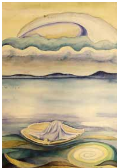
7. Áronson Gábor: Fantasztikus táj , 1957 papír, akvarell, 37 × 26 cm MTA Pszichiátriai Művészeti Gyűjtemény, Itsz. 93.4