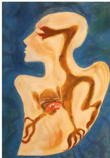
12. B. B.: Betegség , 1988 papír, pasztell, 43 × 30,5 cm MTA Pszichiátriai Művészeti Gyűjtemény, ltsz. 95.21, fotó © Hámosi Péter