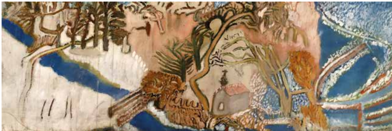
5. Moyezán Anna: Folyó partján , 1960 körül Vászon, tempera, 28 × 52,5 cm. MTA Pszichiátriai Művészeti Gyűjtemény, ltsz. 89.52