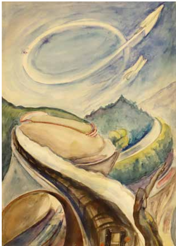
9. Áronson Gábor: Száguldás , 1960 körül papír, akvarell, 37 × 26 cm MTA Pszichiátriai Művészeti Gyűjtemény, ltsz. 93.8

kategóriájába sem, mivel nem részesültek a generációkon át zajló tradicionális inaskodásban. A népművészet stílusa és tartalma úgyszólván rituálisan előírt. Az American Visionary Art Museum több pszichiátriai beteg művész alkotásait is beiktatja a gyűjteményébe, a művész betegségének hangsúlyozása nélkül. Ezek a képek a jelenkori alkotásokkal együtt szerepelnek. A nagy méretű szobrok részére is megfelelő tér áll rendelkezésre. Az egyik ilyen 13 méter magas szobor, egy szélmalomszerű szabadtéri mű, a „Whirliwig” nevet viseli (lefordíthatatlan neologizma: „forgó valami”). Egy újabb kiállítás ZBDD ARMSTRONG műveit mutatja be, aki az idő végéről való látomásának hatása alatt bonyolult komputeres eszközöket és naptárakat készített, hogy az utolsó ítélet idejét pontosan ki tudja számítani. Eric Cunningham Dax (1908–2008) egy életen át tartó odaadó munkájának eredménye a pszichiátriai bete-