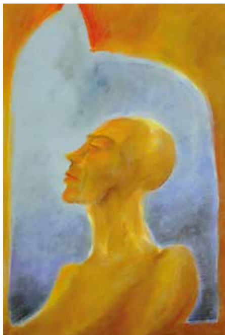
11. B. B.: Bizakodás , 1988 körül papír, pasztell, 43 × 30,5 cm MTA Pszichiátriai Művészeti Gyűjtemény, ltsz. 96.27, fotó © Hámosi Péter