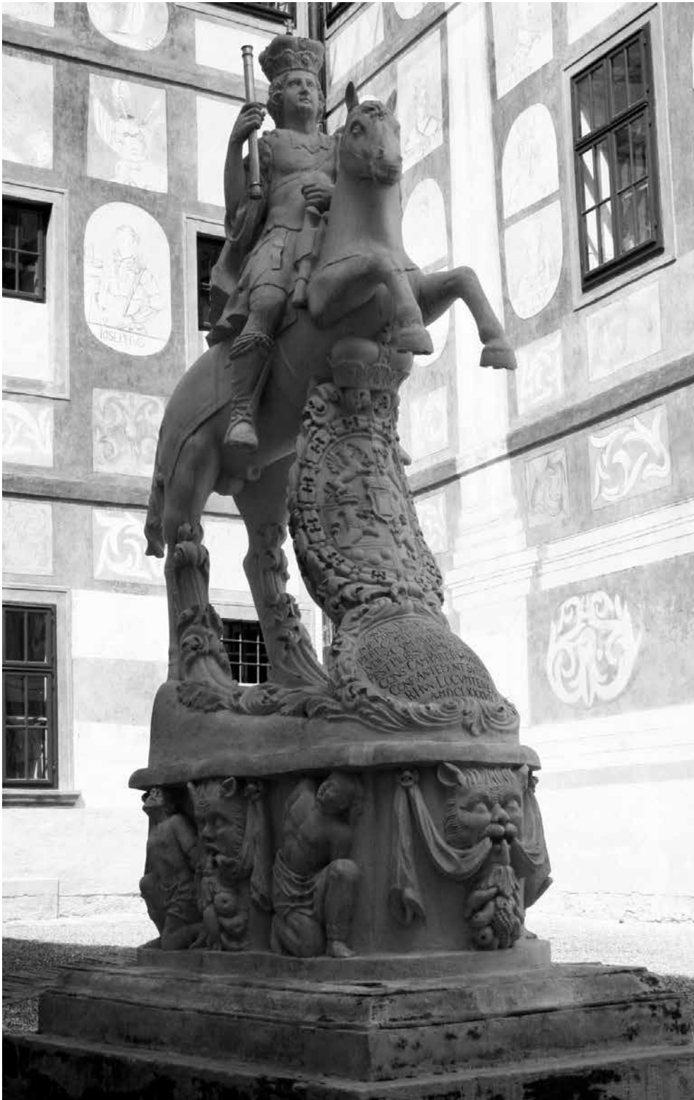
5. kép. Esterházy Pál lovas szobra. Michael Felser, 1690 körül. Fraknó, vár