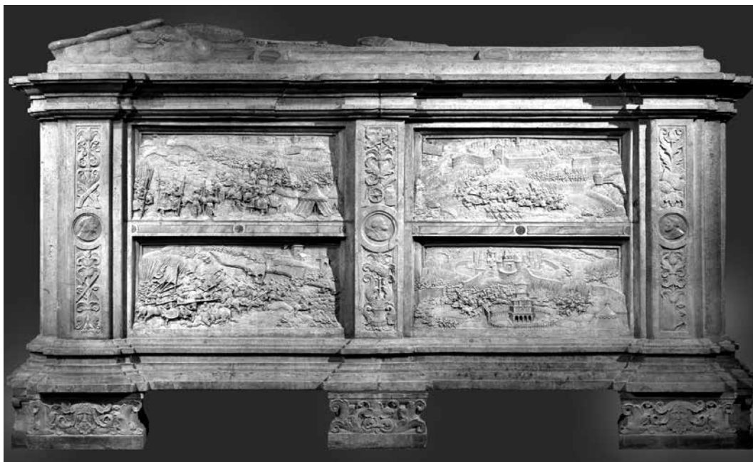
4. kép. Niklas Salm (†1530) tumbája. Loy Hering, 1530–1533. Bécs, Votivkirche.

A 17. századi Magyar Királyságban készült Nádasdy-tumba „atipikus” emlék ugyan, archaizálónak azonban semmiképp sem mondható. A Nádasdy Ferenc országbíró által kialakított tágas – a templom teljes hossza alatt húzódó – kripta miatt, és az országbíró koncepciója szerint szóba sem jöhetett más típusú síremlék, mint a szabadon álló, monumentális tumba. Nádasdy Ferenc és felesége síremléke szándékosan „tartózkodik” azonban attól, hogy a vele szemben felállított Nádasdy Tamás és Kanizsay Orsolya kettős tumbájának 31 jegyeit magán viselje. (Úgy tűnik, gondosan ügyeltek erre később is a család lékai kriptába temetkező tagjai.)