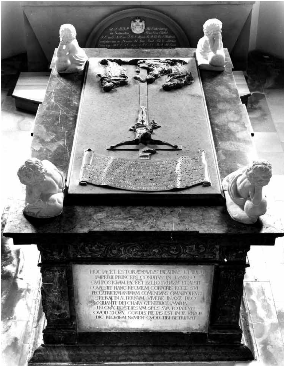
1. kép. Esterházy Pál (†1713) és Esterházy József (†1721) tumbája, 1702 után. Kismarton, ferences templom, Esterházy-kripta.

közepén helyezték el. 5 A tumba mellett az Esterházy II. Pál Antal herceget (1711–1762) és feleségét, Maria Anna Lunati-Viscontit (1713–1782) térdelve ábrázoló két szobor az, amely a kólostort 1768-ban sújtó tűzvész előtt is a mauzóleumban állt, s ma is ott látható. 6