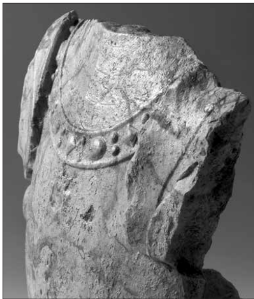
2. kép. A sírkőtöredék oldalnézete. Szolnok, Vársziget.

A tardosi, tömött vörös mészkő 6 töredék egy föltételezhetően egész alakos lovagi síremlék figurájának mellkasi része. Magassága ~43 cm, szélessége ~40 cm, vastagsága ~9 cm. Hátsó oldalán a kőanyag szerkezetében kialakult réteg mentén hasadási felület van, s ez rajzolja ki körben a töredék szabálytalan peremét is. A töredék faragott felületén egy lemezes mellvértnek a csak kitapintható derékszegélytől fölfelé a nyaknyílásig terjedő része, fölötté a nyaknyílást kitöltő lemezes nyaki vértész, alatta a vállvért kétoldali belső harmada, valamint a kettő között egy függővel ellátott nyakék majdnem teljes épségben látható. A leírtakon túl a mellvértet viselő alak oldalnézetéből és háttérének felületéből sajnos semmi nyom nem csatlakozik. Magán a faragott kőfelületen igen kemény vízkő- vagy mészrétegnek tűnő, foszlányos lepedék is megfigyelhető.