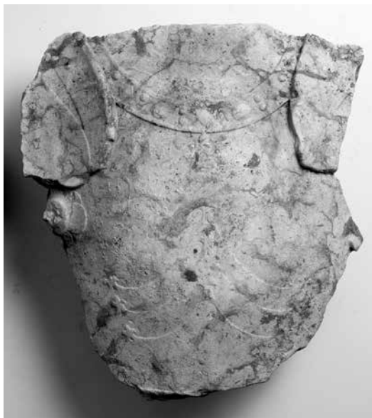
1. kép. A sírkőtöredék szembenézete. Szolnok, Vársziget.