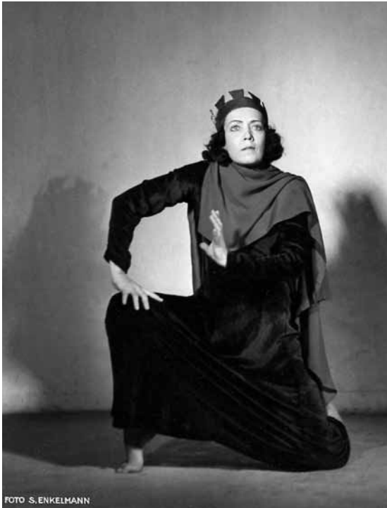
6. kép. Mary Wigman, 1930-as évek vége