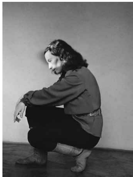
20. kép. Lengyel Lajos: Nagy Etel, 1938, Lengyel János tulajdona