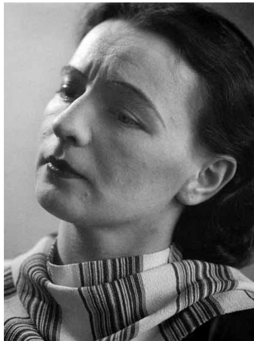
19. kép. Lengyel Lajos: Nagy Etel, 1936 körül, Lengyel János tulajdona

Lengyel ebben a munkájában is pontos, tárgyilagos közléseket adott témájáról. Ez a fogalmazásmód azonban nem jelent egyben távolságtartó magatartást is. A fotók hangvétele személyes, mondhatni lírai – tartózkodva a szentimentális vagy hatásvadász elemektől. Lengyel Lajos sorozata: egy művésznő produkcióinak dokumentálása és egy szubjektív élmény átadása – művészi megfogalmazásban.