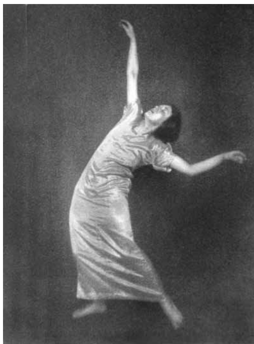
4. kép. Egy Laban-tanítvány fotója. Megjelent Fritz WINTHER Körperbildung als Kunst und Pflicht című könyvében (Delphin Verlag, München, 1915. 64, 65).

beliek tagja is volt, tehát később is tartották egymással a kapcsolatot. 19