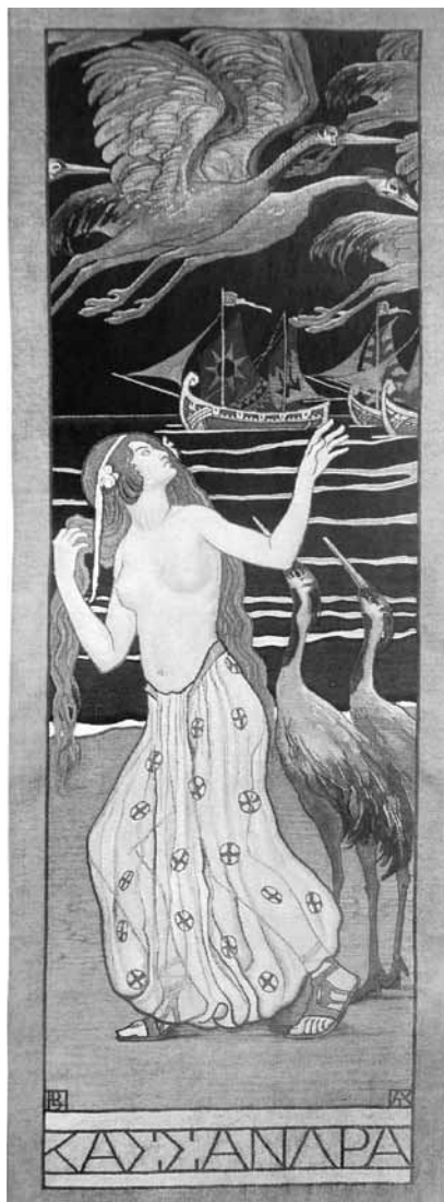
1. kép. Körösfői-Kriesch Aladár–Belmonte Leó: Kassandra , 1908–1909, gobelin, gyapjú, 200×71 cm, j. j. l.: monogram, j. b. l.: monogram, j. b. f.: két csiga, Budapest, Iparművészeti Múzeum

Oszkárnak készítette. A könyvjegyhez a Mester, hol lakol? című festményének egy részletét használta fel szecessziós keretdíszebe fogva. 6