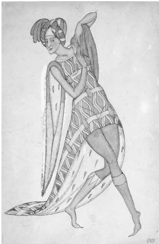
10. kép. Undi Mariska: Táncoló nő IV. , akvarell, diófapác, papír, 275×185 mm, j. b. l. UNDI, SZM–MNG, Grafikai osztály, ltsz.: F. 93.83.

A szecesszió mestereihez hasonlóan Dienes Valéria is hirdette az ember és a környezet közötti harmónia megteremtésének szükségességét, de úgy látta, nem elég, ha a nők a művészi formált enteriőrben a tér díszítőformáival összhangot alkotó ruhát viselnek. Ahhoz, hogy az ember maga is „műtárgy” legyen, önformálás is szükséges. „A művészetet kedvelő ember, aki iparművészeti szépségekkel szereti körülvenni magát, talán levetkőzi vele [a táncművészettel – G. K.] csúnyaságának göggjét, mellyel a szépséget csak vásárolta és saját mivoltának esztétikájáról megfeledkezett és egy lépéssel közelebb jut ahhoz, hogy a művészi környezetben az ember maga is értékes műtárgy legyen” – írta. 28