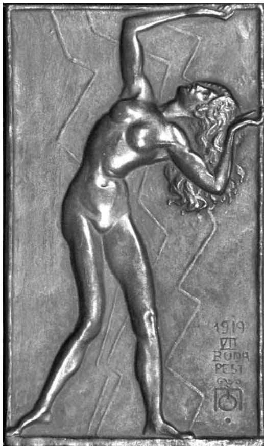
3. kép. Moiret Ödön: Táncoló , 1919, bronzplakett, 19,3x11,3 cm, j. j. l.: 1919, VII. Budapest, monogram. Gödöllői Városi Múzeum, ltsz.: 86.263.