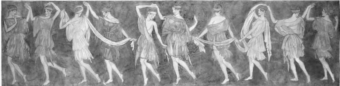
7. kép. Undi Mariska: Táncoló római lányok , mozaikterv, 1918, tempera, papír, 62x2340 mm, j. n., SZM–MNG, ltsz.: F. 94.33.