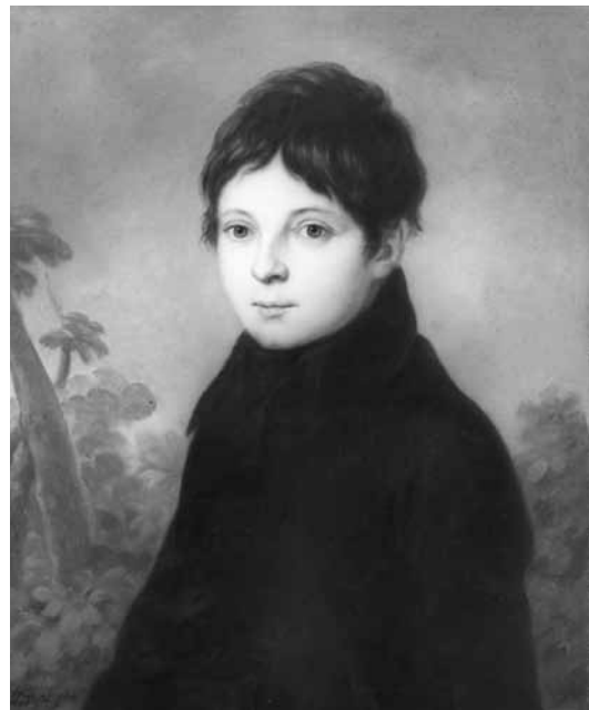
4. kép. Donát János: Kovásznai Kováts Miklós, 1814, olaj, vászon, 59x50 cm, magántulajdon

Úgy tűnik azonban, hogy Kováts Mojzes nem kizárólag Kazinczy ama többször is megfogalmazott véleményét követte saját és felesége portréjának megrendelések, mely szerint valakinek váratlan halála kevésbé eredményez pótolhatatlan űrt, ha családja és barátai bírnak az illető arcmásával, 9 hanem más oka is volt Donát megkeresésére. A két arcmás készülésének szempont-