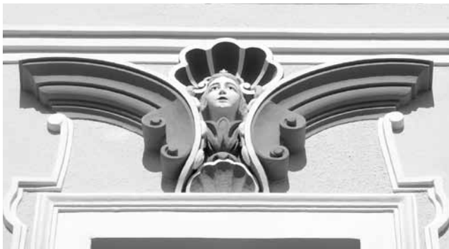
3. kép. A keleti szárny déli homlokzatának szélső szemöldökdíszé.

A kastély tervezőjeként stíluskritikai alapon egyesek Johann Lucas von Hildebrandtot (1668–1745) jelölték meg. 16 Ezzel szemben mások az egri püspökség építészére, Giovanni Battista Carlonéra