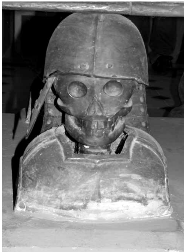
6. kép. Gr. Károlyi Sándor szarkofágjának egyik lába. Kaplony (Căpleni, Románia), Károlyi-kripta. A szerző felvétele

Az edelényi kastély építetője felhasználta a különféle francia, itáliai és közép-európai mintákat. Meg kívánt felelni a legkorszerűbb reprezentációs elvárásoknak és a helyi hagyományoknak. Az épület tehát heterogén, mintegy „eklektikus”. Arról tanúskodik, hogy tulajdonosa mekkora energiával próbált gyökeret ereszteni választott hazájában, és milyen módon próbálta meg kifejezni a nemesi nemzetben elfoglalt státusát. De az éles szemű látogató számára ott a figyelmeztetés, akár a legyőzött ellenségre, akár a földi dolgok hiábavalóságára való utalás látható a díszterem pilaszterein: mindez csupán „ vanitas vanitatum, et omnia vanitas. ”