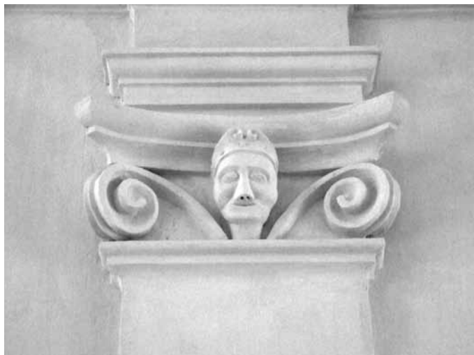
5. kép. A díszterem egyik pilaszterének díszítése.

Ezt a katonai, triumfális ikonográfiát egészíti ki a díszterem pilasztereinek maszkokkal való díszítése (5. kép). A kaplonyi (ma Căpleni, Románia) ferences templom kriptájában, a Károlyi család temetkezési helyén gr. Károlyi Sándor (1669–1743) kuruc, majd császári-királyi tábornagnak, és fiának, gr. Károlyi Ferenc (1705–1758) lovassági tábornoknak, Forgách Ferenc katonatársának a koporsóin hasonló, csak sisakkal kiegészített maszkok láthatók (6. kép). 42 A kaplonyi maszkok