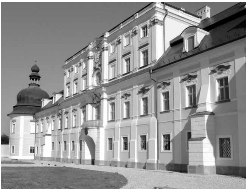
1. kép. A kastély északi homlokzata.

Az egyemeletes, manzárdtetős törzsepület északi homlokzatának két szélén kekek, hagymakupolás, lanternás tornyok állnak (1. kép). Közepén egy nagyon alacsony lejtésű sätortetővel, majd hogyanem síkfödémrel fedett, óriáspilaszterekkel tagolt háromemeletes rizalit emelkedik. A középső tengelyben kváderezett, fél-