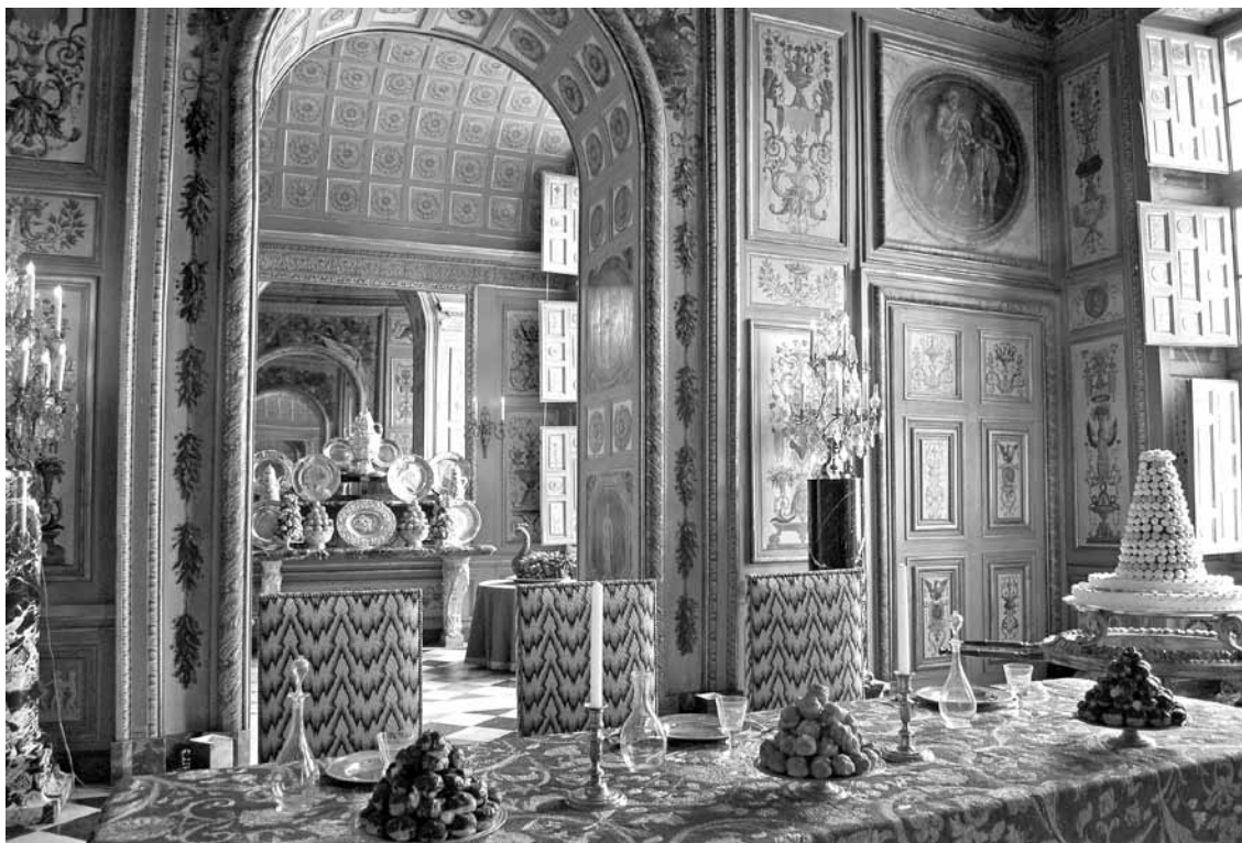
6. kép. A vaux-le-vicomte-i kastély ebédlője

A vendégeskedést 1659. július 25-én Fouquet pártfogója, Mazarin bíboros kezdte, aki útban a pireneusi béke megkötésére egy éjszakára megállt a kastélyban. Még ugyanezen év július 14-én XIV. Lajos, az anyakirálynő és Monsieur, a király öccse látogattak el népes kísérettel Vauxba, hogy megtekintsék a birtokot. 1660. július 10-én Fouquet-nak ismét lehetősége nyílt fényes keretek között vendégül látnia uralkodóját, mikor az ifjú feleségével, Mária Terézia spanyol in-