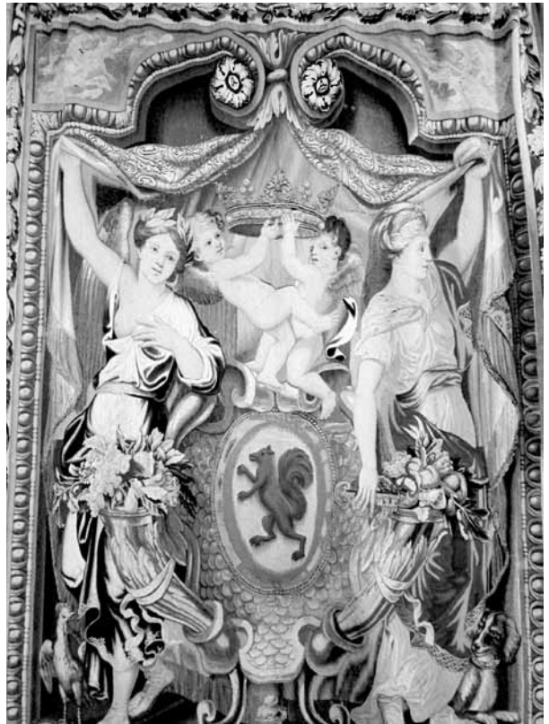
1. kép. A Dicsőség allegóriája Fouquet címerállatával, kárpit, 17. század közepe