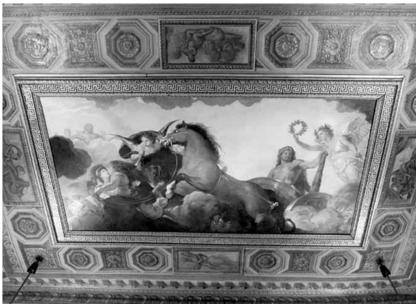
5. kép. Charles Le Brun: Hercules diadala, 1660 körül

megfelelően a nagyszaloné (5. kép) lett volna, amely azonban sajnos csak félig készült el. Az univerzum leképezésévé válni hivatott terem mennyezetét a Nap palotájának ábrázolása ékesítette volna, ahol éppen egy új csillag jelenik meg: a Mókus. Mókus időközben történt letartóztatása miatt a mű azonban sajnos nem készülhetett el, de Le Brun vázlatait ismerjük, s így az elkészült, a felső szintet díszítő, évszakokat és hónapokat ábrázoló faragványok láttán el tudjuk képzelni, milyen hatás elérésére törekedett a mester és a megbízó. Le Brunnek a maga korán túlmutató, divatot