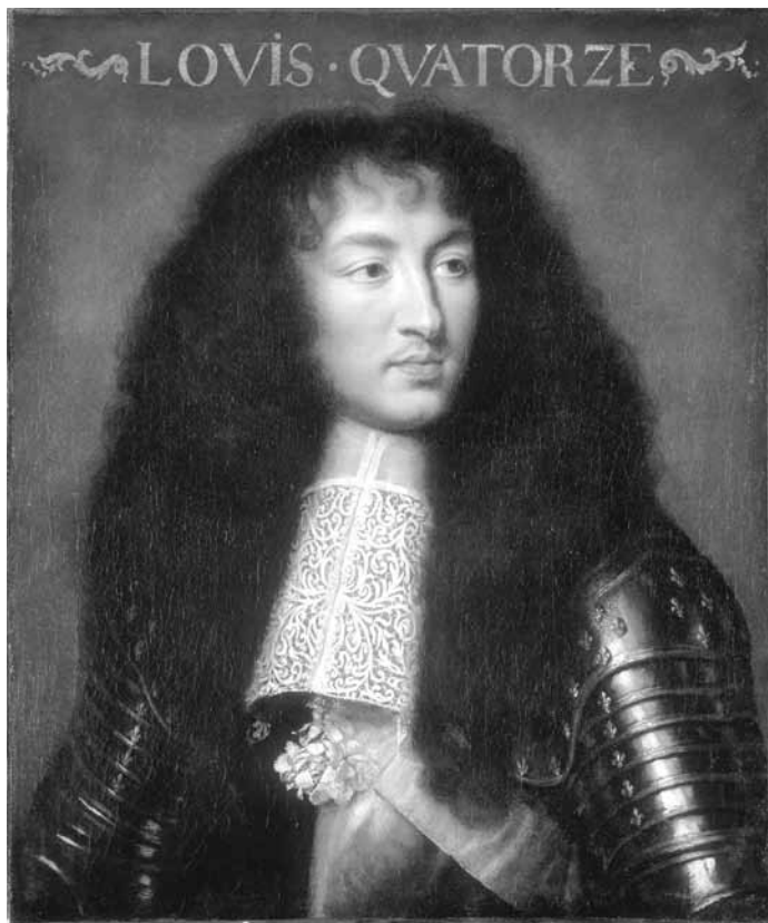
2. kép. Charles Le Brun: XIV. Lajos portréja, 1661

Hogy uralkodója kedvében járjon és kinevezését biztosítsa, Vaux-ban, épp elkészült kastélyában korábban soha nem látott, nagyszerű ünnepséget rendezett XIV. Lajos (2. kép) tiszteletére, ami azonban rosszul sült el. Annak ellenére, hogy Fouquet egy nagyvonalú gesztussal a királyra