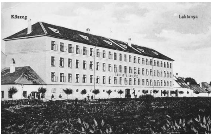
1. kép. A gőzmalom kaszárnya a 19. század végén. BOROVSZKY (1898) nyomán

Eleinte tartós letelepedésre gondolhattak, erre utal a nem csekély, 15 ezer koronás vételár, amit valószínűleg Katica anyai (Lenhossék Georgina †1894. augusztus 30.) örökségéből fizettek ki. Az emeletes házhoz „melléklak”, gazdasági épület, továbbá több mint 800 négyszögöl nagyságú, zárt belső kert, illetve udvar tartozott. 2 A Gyöngyös partján, a pataknak háttal épült ház akkoriban a Kaszárnya utca 12. számot viselte. Nevét az utca onnan kapta, hogy a városi tel-