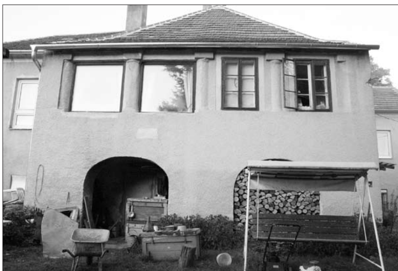
3. kép. A lakóház kerti homlokzatának középső részlete

A napjainkban Malomárok utca 9. 8 számot viselő épület a várostól keletre végighúzó Gyöngyös patak belső partján található, annak a hosszú, szigetszerű földnyúlványnak az északi felső végén, amelyet maga a Gyöngyös és annak keskeny ága, az úgynevezett malomárok zár be. Jelenleg csupán egy udvari kapun át, a part felől közelíthető meg, mégis egyértelmű, hogy főhomlokzata a tágas kert felé néz. A szabadon álló, szabálytalan alaprajzú, egyemeletes ház szép és harmonikus külső megjelenésének lepusztítása a 20. század második fele óta láthatólag egészen napjainkig folyamatosan zajlik ugyan, mégis első pillantásra azonnal érthető, miért nevezhet-