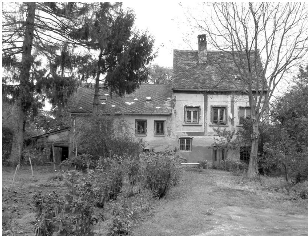
11. kép. Az egykori part menti fogadó átépített maradványa