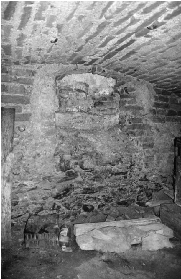
2. kép. A pincében megfigyelhető terméskő falak