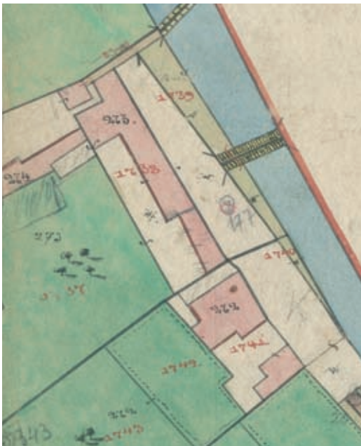
9. kép. Az 1857. évi kataszteri térkép részlete (Vas Megyei Levéltár)