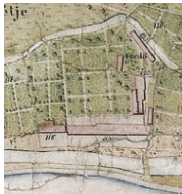
7. kép. Az 1838–1839. évi telekkönyvi térkép részlete az épületegyüttessel (Városi Múzeum, Kőszeg)

Pénzét azonban mindenekelőtt ingatlanokba fektette, s ezeket azután legtöbbször bérebe adta. Közben persze folyamatosan kölcsönkért és kötelezvényeket írt alá. Adósságait