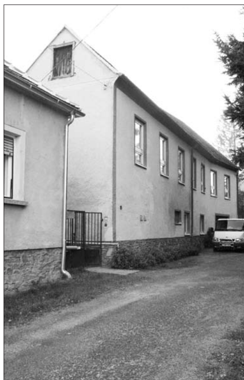
4. kép. A Gyöngyös patak felőli homlokzat délről

ték száz évvel ezelőtt „kastélynak” vagy „villának” (3, 5–6. kép). A kerti homlokzat rizalitszerűen kiugró középrészén, alul a két széles, kosáriréses záródású nyílás fölött kerek oszlopokkal tagolt, egykor nyitott tornác húzódott. A kezdetben szabadon álló oszlopokat ma már nem létező árkádívek kötötték össze, a homlokzatot pedig