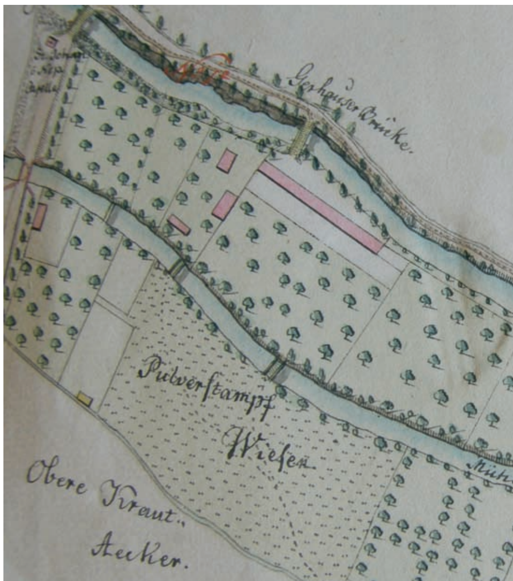
8. kép. A Gyöngyös patak partját ábrázoló térkép részlete, Karl Schubert, 1826 (Vas Megyei Levéltár Kőszegi Fióklevéltára)

Ami a szabadon álló, modern „villát”, a fürdőt és a közöttük elhelyezkedő, nagy telket illeti, több térképpel is rendelkezünk a 19. század első feléből, illetve közepéről. Feltűnő, hogy a lakóépületet még sem az 1819. évi úgynevezett postakocsitérkép, sem az 1826-ból fennmaradt, Karl Schubert városi rajztanár által a Gyöngyös patak partjáról készített, színezett térkép (8. kép) nem ábrázolja. Annak ellenére, hogy, mint láttuk, éppen 1819-ből már biztos forrással rendelkezünk Gerhauser saját házáról, amely először csak a házszámozást rögzítő 1838–39. évi telekkönyvi, később az 1857. évi kataszteri (9. kép), majd az ezen alapuló 1882. évi térképen (10. kép) jelenik meg, tegyük hozzá, egymástól némiképp eltérő alaprajzzal. Mindenesetre a 19. század elején, az emelettel párhuzamosan már felépül a tulajdonos saját használatú istállója és vele együtt a kocsiszín a ház