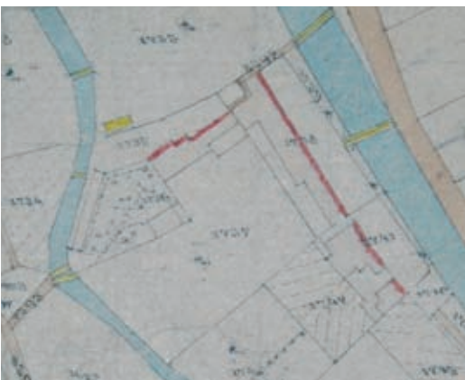
10. kép. Az épületegyüttes az 1882. évi térképen, részlet

északi oldalán. A telek alsó, déli végén mindhárom alkalommal feltüntetik az egyelőre ismeretlen funkciójú, eredeti formájában ma már nem létező, földszintes „melléklakot”. 17