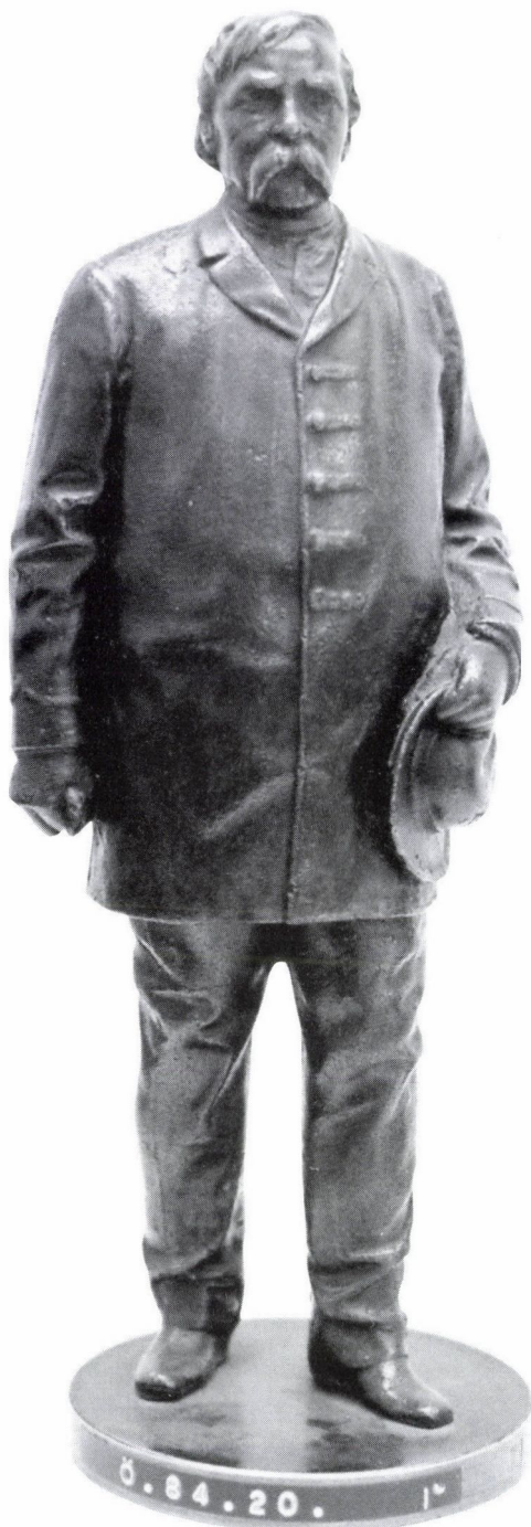
2. Ismeretlen művész: Deák Ferenc, Országos Öntödei Múzeum

A Deák Ferenc életének hétköznapi jelenetét rögzítő, zsánerszobornak is tekinthető kisplasztika és a közéleti, politikusi szerepet hangsúlyozó végleges köztéri megformálás a szobrászi gondolat fejlődésének, érlelődésének feltételezhető ívét jelentheti. A kilépő lábak közel azonos helyzete a szobrászi gondolat, a mozgás, a mozdulat eleve elhatározott, mindvégig megtartott ötletére utalhat. Miközben a magabiztos, tökéletes kontraszt-