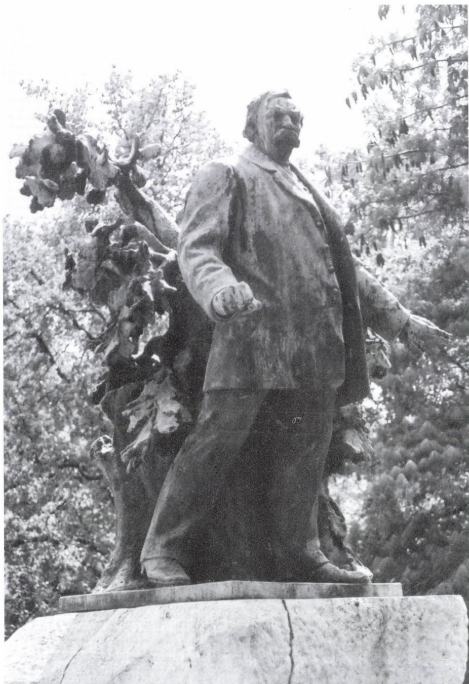
1. Zala György: Deák Ferenc szobra Szegeden