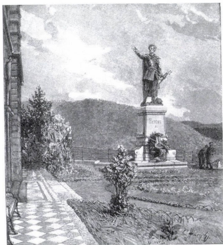
6. A segesvári Petőfi-szobor. Bálint Benedek fametszete. (Megjelent Az Osztrák–Magyar Monarchia írásban és képen c. sorozat 20. kötetében, Budapest, 1901.)