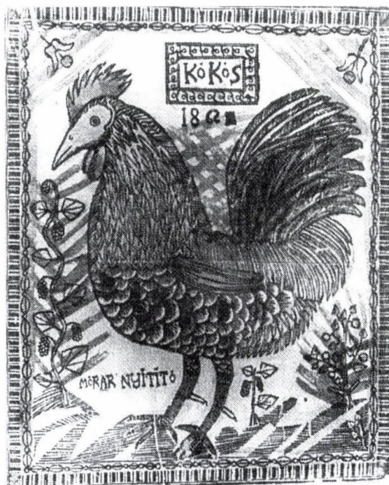
2. Erdélyi népi fametszet, 1892.