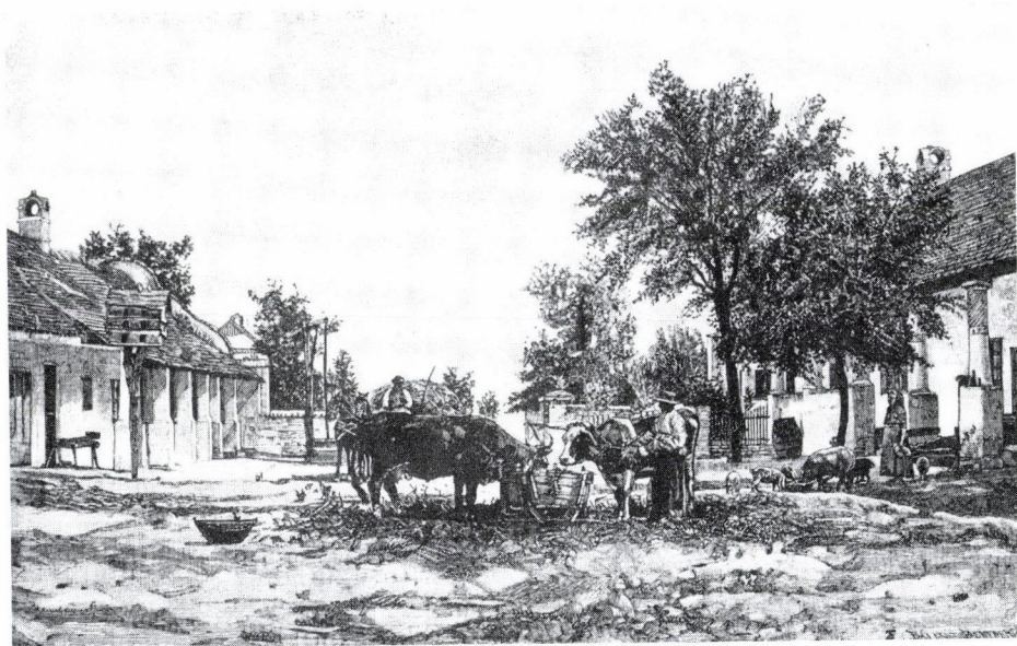
8. Bánsági sváb parasztudvar. Bálint Benedek fametszete. (Megjelent Az Osztrák–Magyar Monarchia írásban és képen c. sorozat 7. kötetében, Budapest, 1891.)