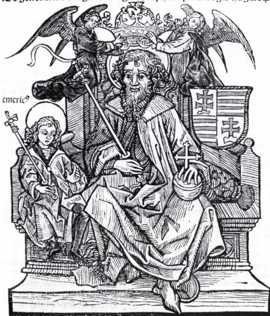
4. Szent István király és Szent Imre herceg Johannes Thuróczy Chronica Hungarorum (Augsburg, 1488) című művéből. Színezett fametszet