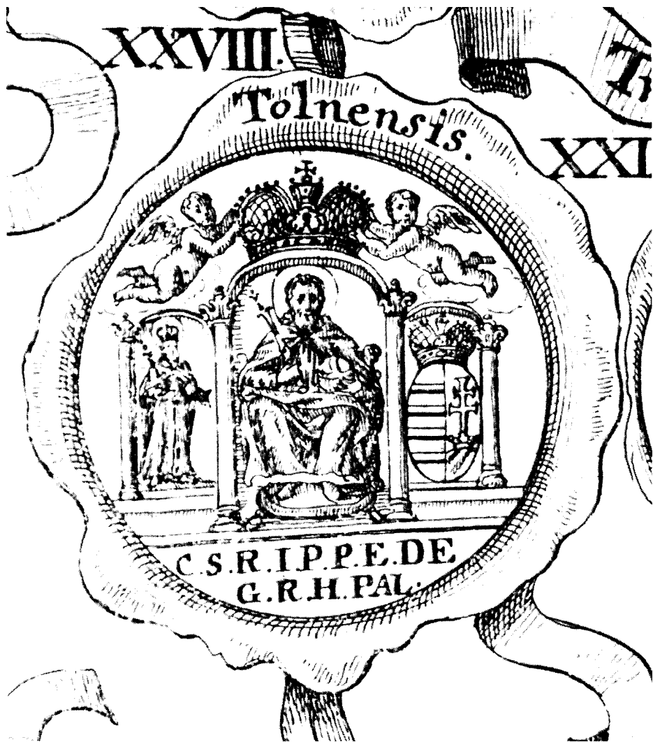
10. Tolna vármegye pecsétje Koller Josephus Cerographia Hungariae (Tyrvnae, 1734) című művéből. Rézmetszet. Könyvillusztráció a 126–127. lapok közötti III. táblán

mint másfél évszázadon át valamennyi koronaábrázolás prototípusául szolgált. 49