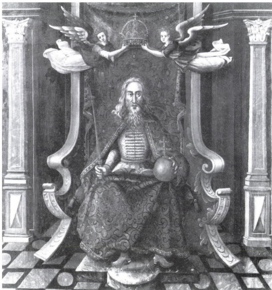
9. Ismeretlen festő: Szent István király. Olaj, hársfa. 1615 után. Budapest, Magyar Nemzeti Galéria Régi Magyar Gyűjteménye, ltsz.: 55.967.3

Augsburgban napvilágot látott De sacra coronae regni Hungariae ortu virtute, victoria, fortuna című, teológiai-teokratikus szemléletű kötete jelenti. 48 A Szent István-kép ikonográfiája ugyanis – bár egészében véve Thuróczy János krónikájának augsburgi kiadásában látható fametszetét követte – az anyagi koronázás motívumánál már a szerzőnek a Szentkorona-tan további közjogi alakulására igen nagy hatást gyakorló államelméleti művére támaszkodott. Pontosabban az annak az elején látható, Wolfgang Kilián nevével fémjelzett, immár nem idealizált, hanem a korábbi ábrázolásoknál sokkal precízebb és valóságosabb rézmetszetét adaptálta, amely azután több-