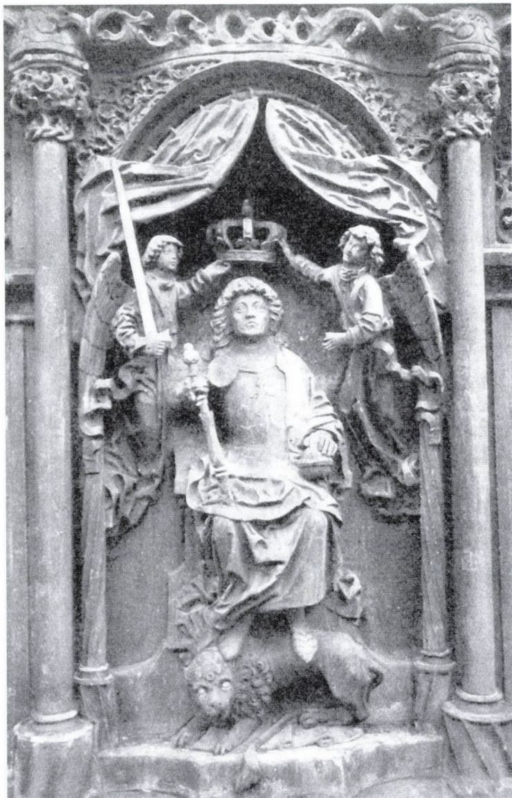
3. Mátyás király angyali koronázása. Bautzen, Ortenburg kaputorony homlokzata. Színezett homokkő, 1486