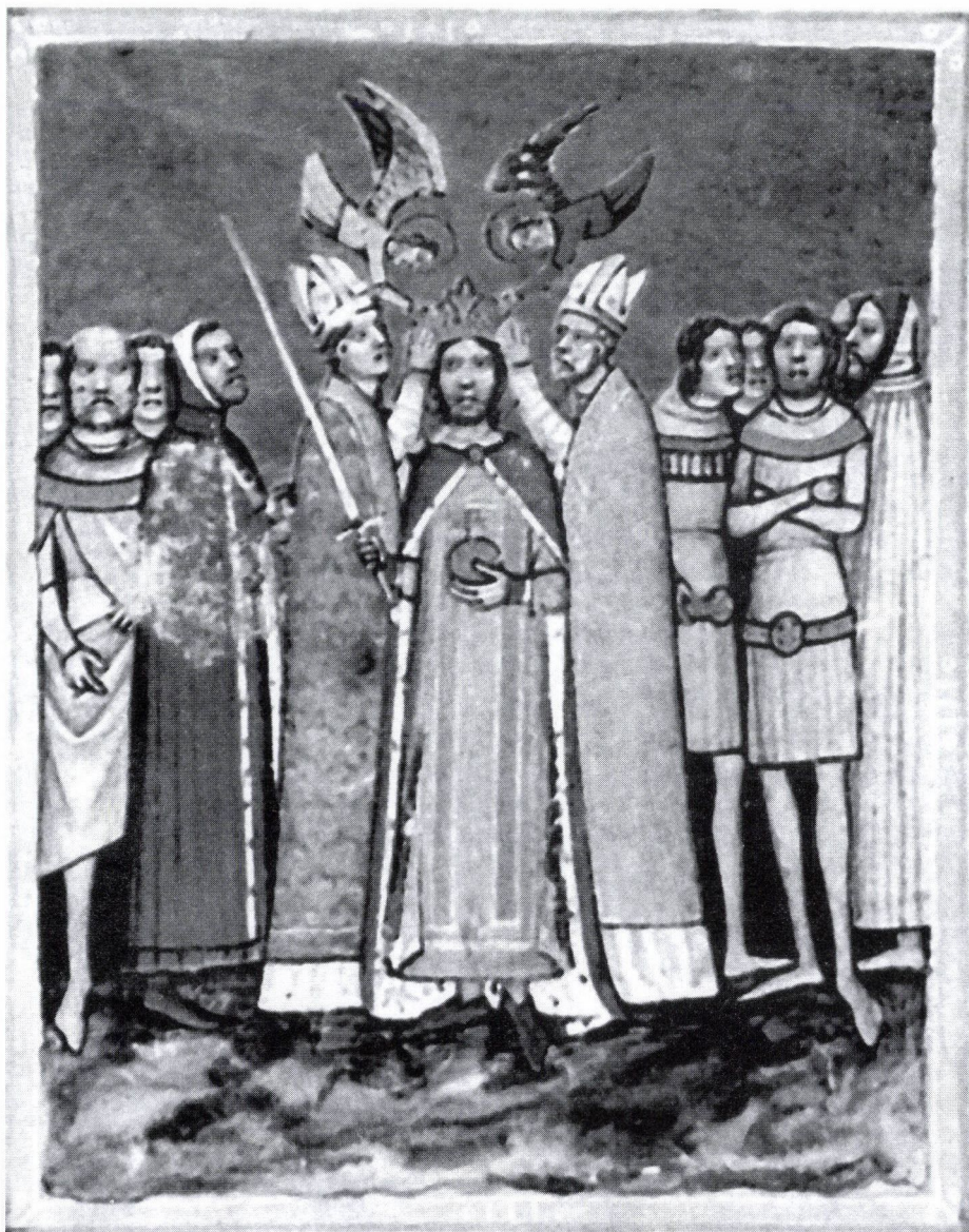
1. Szent László megkoronázása. Miniatúra a Képes Krónikából . Pergamen, tempera, 1360 körül. Budapest, Országos Széchényi Könyvtár Kézirattára, Cod. Lat. 404. 46. verso