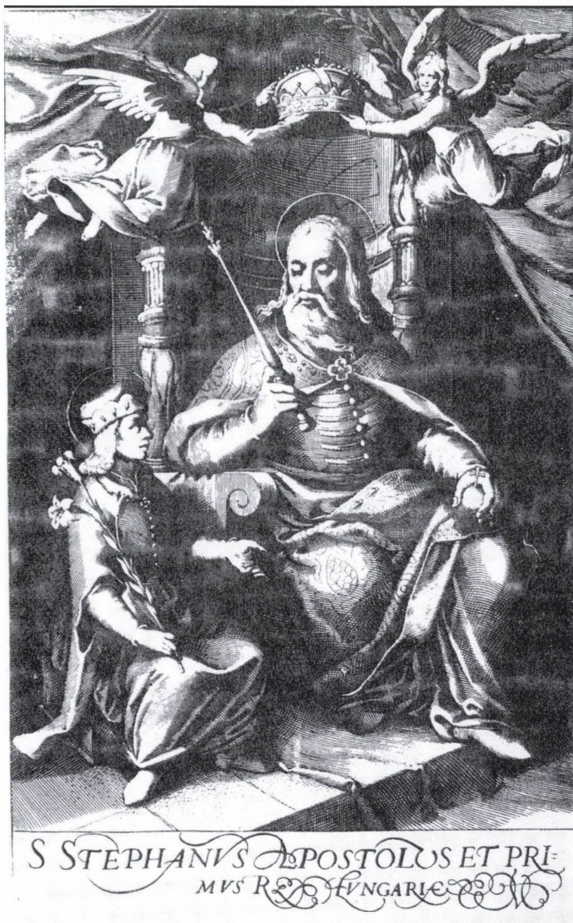
8. Szent István király és Szent Imre herceg. Egidius Sadeler rézmetszete. 1615 körül. Megjelent a Mausoleum [...] (Norimbergae, 1664) című históriában könyvillusztrációként