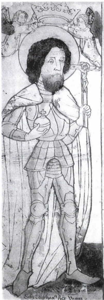
2. Szent István király. Egylapos nyomtatvány részlete. Színezett fametszet. 1460–1470 körül München, Staatliche Graphische Sammlung, Inv. 118257

A metszet megjelenése pillanatától kezdve átütő sikert aratott. Technikája, mondanivalója révén is, de főleg majd azért, mert a rendi alkotmány szempontjából rendkívül lényeges közjogi vonatkozásokkal bírt, különösen a Hunyadi Mátyás halálát követő trónutódlási harcokban. Miután a legpregnánssabban fejezett ki egy adott aktuális politikai gondolatot, s a későbbiekben is