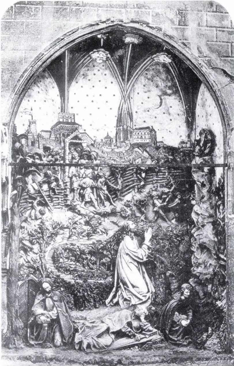
3. Olajfák hegye szoborcsoport a besztercebányai (Banská Bystrica) plébániatemplom délnyugati sarkában. 1868 körül (222. sz.)