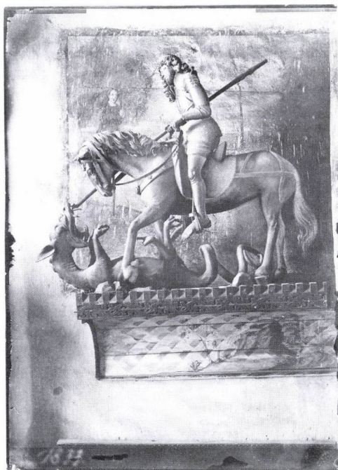
6. Szent György szobra a lócsei (Levoča) plébániatemplomban.