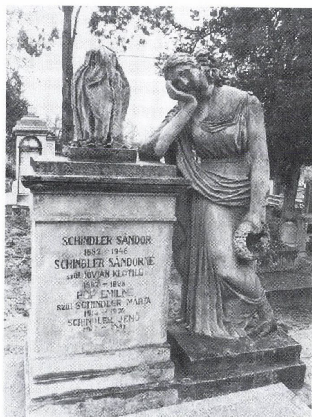
18. Klösz József: A Schindler család síremléke. Kolozsvár, Házsongárdi temető.