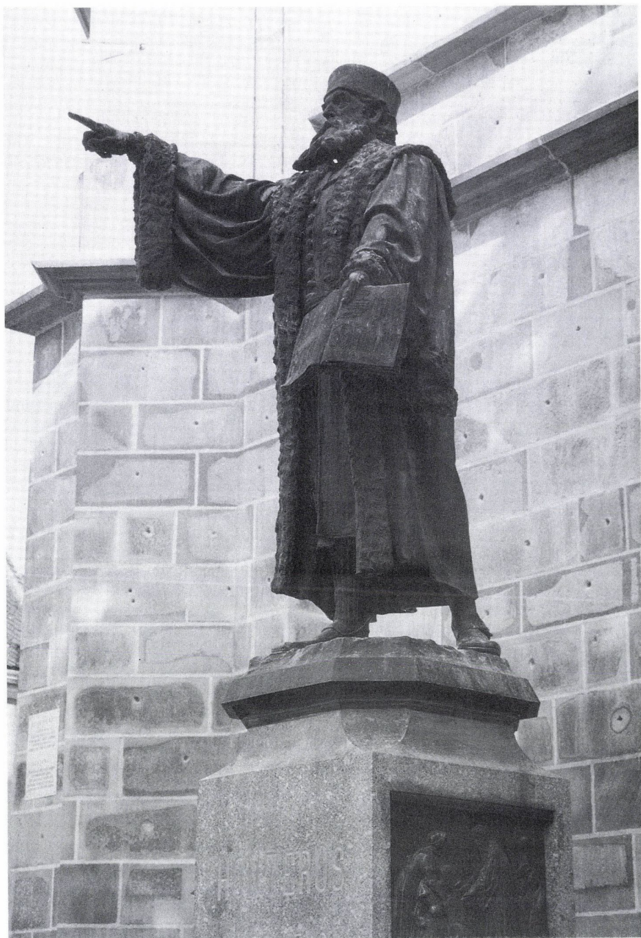
25. Harro Magnussen: Honterus emlékmű, 1898. Brassó.