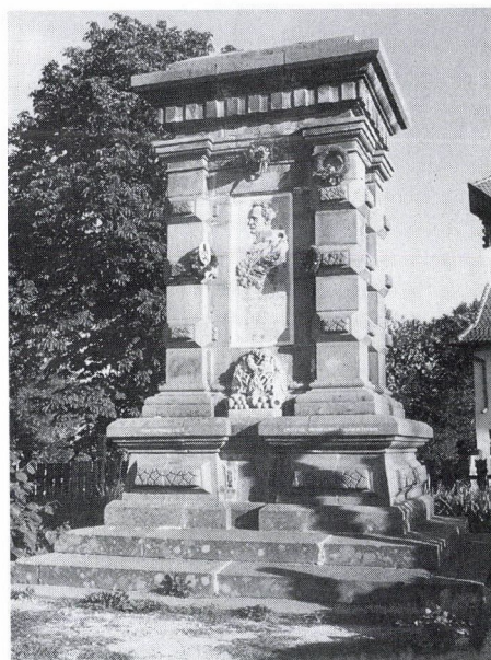
15. Gerenday Antal: Gábor Áron síremléke, 1892. Eresztevény.