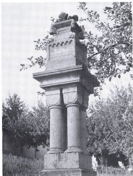
12. Hargitai Nándor: Erzsébet királyné emlékoszlopa, 1909. Homorodkarácsonyfalva.