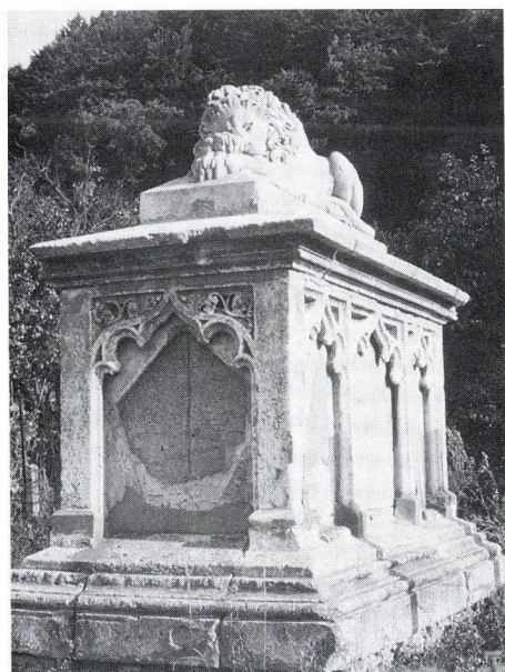
14. Szkarjatyin cári vezérőrnagy emlékműve, 1854. Segesvár.