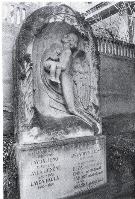
8-11. Szeszák Ferenc négy síremléke a kolozsvári Házsongárdi temetőben.