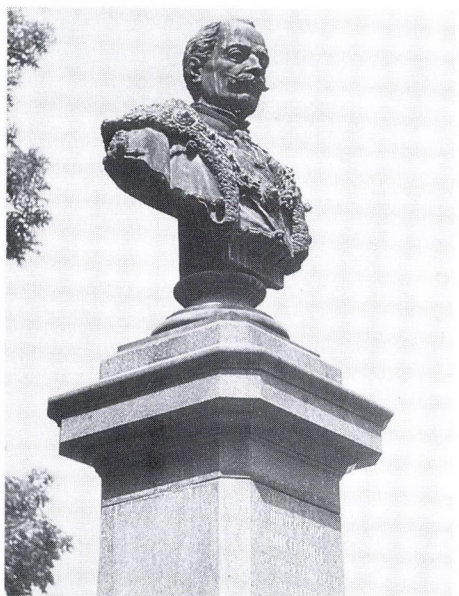
16. ifj. Vay Miklós: Mikó Imre emlékszobra, 1889. Kolozsvár.