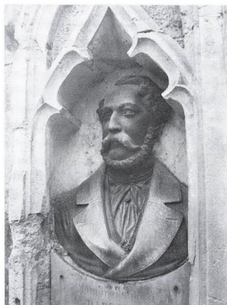
23. Carlo Nicolo: Sámí László síremléke, 1884. Kolozsvár, Házsongárdi temető.