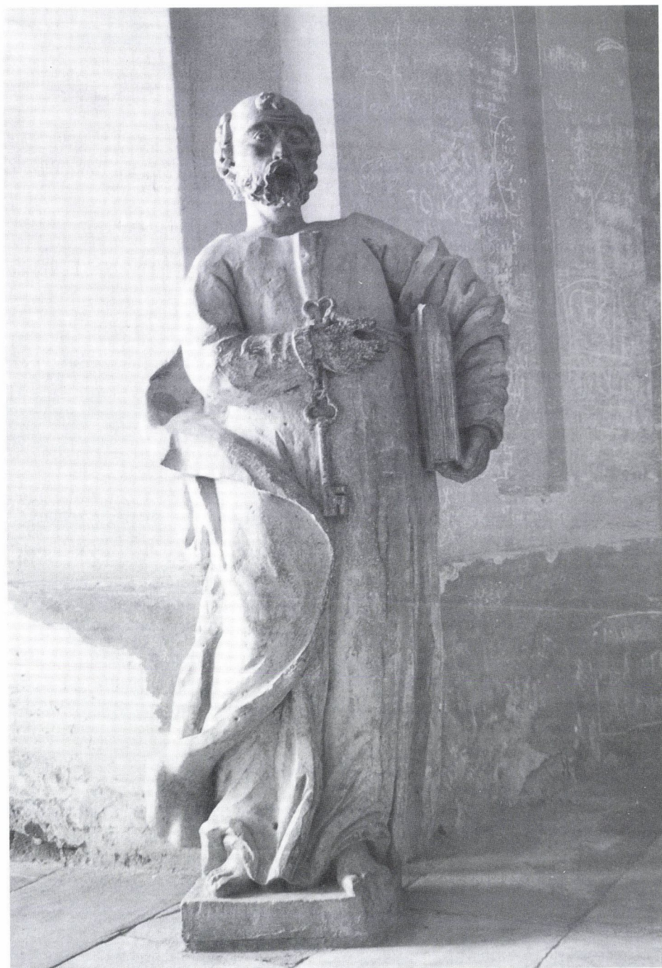
1. Csűrös Antal: Szent Péter, 1802–1803. Szamosújvár, örmény nagytemplom.