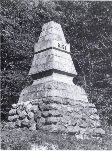
4. Erzsébet királyné emlékoszlopa, 1899. Bereck.