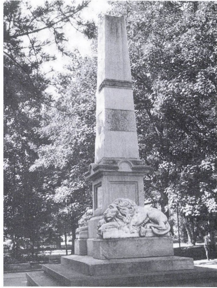
5. Gerenday Antal: Honvédemlék, 1874. Sepsiszentgyörgy.