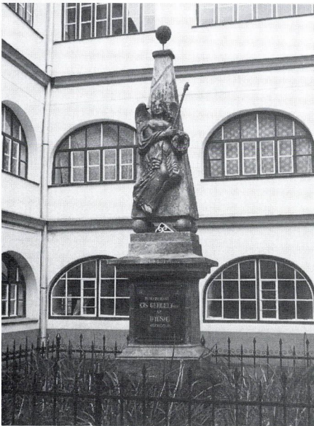
6. Kis Gergely emlékoszlopa, 1843. Székelyudvarhely.