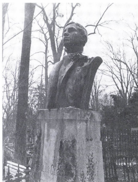
17. Kozma Erzsébet: ifj. Téglás Gábor síremléke, 1900. Kolozsvár, Házsongárdi temető.