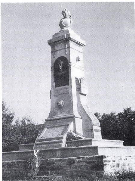
13. Köllő Miklós: Zeyk Domokos emlékműve, 1901. Héjjasfalva.