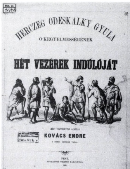
2. Kovács Endre: Hét vezérek indulója, 1860. (Kat. 7.) Ismeretlen rajzoló után Országos Széchényi Könyvtár 2174 B

amit a kiállítás hiteles bemutatásához hozzáfűzhetnénk. Az idézett, szakavatott tájékoztatások talán megengedik, hogy megtisztelő megbízásomban is a látogatók egyikének tekintsem magam.