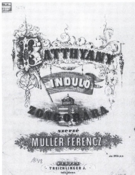
1. Müller Ferenc: Batthyány induló, 1848, 1850. (Kat. 3.) Ismeretlen rajzoló után Országos Széchényi Könyvtár 2724 A