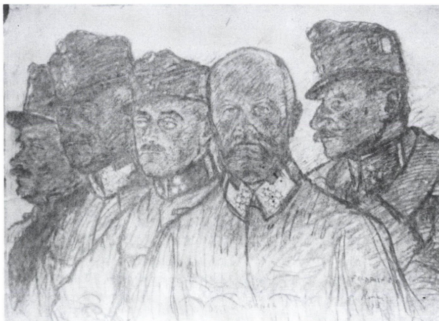
2. Rippl-Rónai József: Katonaarcképek, 1916