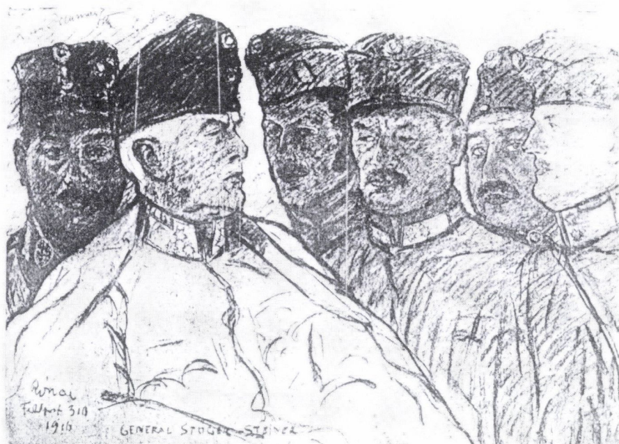
1. Rippl-Rónai József: Katonaarcképek, 1916