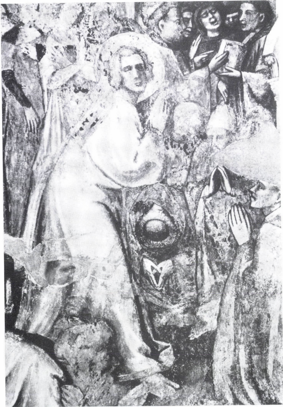
5. Szent László. Részlet a Szent László koronázása falképről.