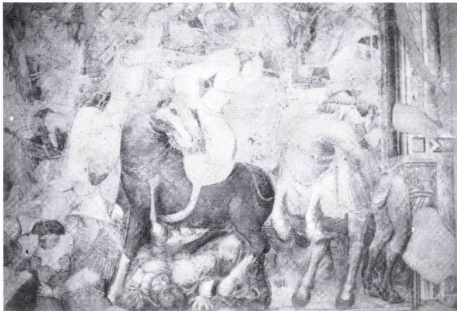
6. Keleti harcok. Részlet a Csatajelenet képből.

tékben köztudottak voltak, hogy még nem alakulhatott ki a regália legalizáló ereje. VII. Gergely pápa tudatosan a „választott királynak” írta leveleit hozzá 1078-ig. 1079-ben azonban már nem duxnak , vagy electusnak címezte, hanem rex Ungarorumnak , ami valószínűsíti, hogy legalis megkoronázása mégis megtörtént. Talán egy olyan koronával, melyet feleségével együtt kapott. A Képes Krónika miniátora mindenesetre jobbnak látta az angyalok által hozott koronával alátámasztania az esemény leírását. 21