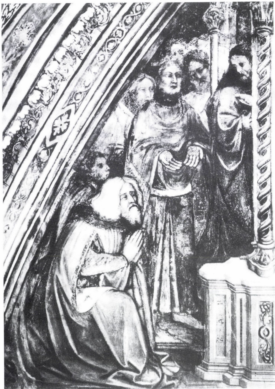
9. Szent László alakja, részlet a Szent László és Salamon király kibékülését ábrázoló freskóból. Nápoly, Incoronata templom.