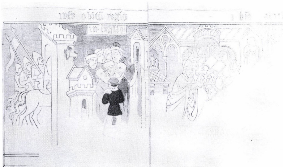
7. László király megkoronázása a bántornyai falképen. Storno Ferenc rajza. Közölve: Rómer Flóris: Régi falképek Magyarországon. Bp.1874.