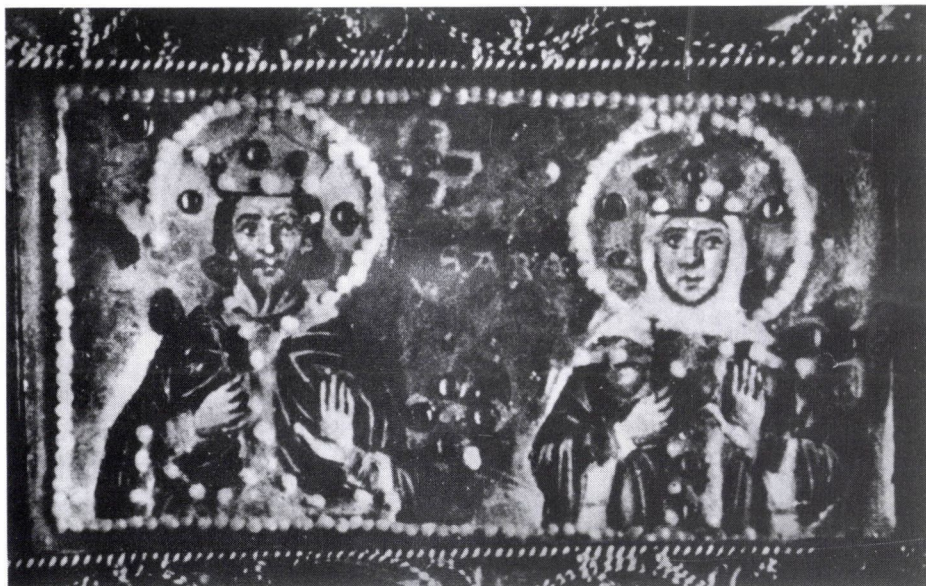
1. III. András király házioltára, Szent László és Szent Erzsébet pergamenre festett mellképével. 1253-1290. Bern, Historisches Museum, Itsz.301.

ennek a folyamatnak éppen Magyarországon nem tudjuk még nyomát követni. De éppen ez a freskó bizonyíték arra, hogy voltak, lehettek már ilyen emlékek, ha máshol nem, az udvarban, hiszen a magyar ikonográfiában nem éppen jártas itáliai mester(ek) csakis hazai legendaszövegetek, mintakönyveket, lapokat használhattak föl Magyarországi Mária útmutatásával, esetleg a királyné tulajdonában lévő, otthonról hozott alkotásokat tanulmányozva. 5 Mária öccse mellesleg IV. László volt, tehát az ő védőszentje révén szűkebb családjában is igen erős lehetett a kötődés Szent László tiszteletéhez. 6 A Santa Maria Donnaregina magyar királyszenteket ábrázoló freskójának tehát éppen az az óriási jelentősége, hogy az első olyan mű, ahol valamennyi magyar királyszent egyéni vonásokkal, jelvényekkel van fölruházva, s ez az ikonográfiai kompozíció azután a mindenkori divatot, fegyverzetet leszámítva, változatlan maradt az évszázadok folyamán.