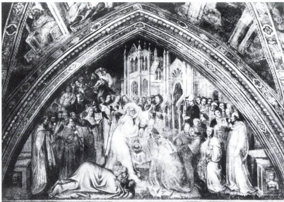
4. Szent László koronázása. 1414. Leválasztott falkép az Incoronata templomban.

László mindig is magát tekintette Magyarország jog szerinti királyának, s már 1391 óta fiktív adományokat tett és különböző méltóságokat osztott ki. Törekvéseiben támaszkodott a bárók délvidéli pártjára, az ún. Ligára, amelyet már 1395-ben számontartott egy mantovai diplomata. Nápolyi királyságának konszolidációjával IX. Bonifác pápa teljes támogatását élvezve, 1403-ban partra szállt Zarában. Magyar hívei azt tanácsolták, hogy fegyverrel nyisson utat magának az országba és Fehérvárott a Szent Koronával koronáztassa meg magát. László azonban ehelyett a pápai legátussal szenteltetett föl egy diadémot és ezzel koronázta meg 1403 augusztus 5-én a szintén összeesküvővé vált Kanizsai János esztergomi érsek. Az egyház és a magyarság ideológiájának összeütközését láthatjuk ebben a tényben. László itáliai tanácsadói is tudták ugyanis, hogy a koronázást az esztergomi érseknek kell végeznie (mert ez az egyetemes egyházi rendszerhez tartozó vonás volt), de a Szent István-i korona elengedhetetlen volta (ami magyar jellegzetesség volt) érthetetlen lehetett számukra. Kanizsai érsek nyilván tisztában volt vele, de Zsigmond hívei is joggal állíthatták, hogy a trónkövetelőt „valamiféle korona formájú pogány koszorúval”, tehát „hamis koronával” koronázták meg, s így az aktus érvénytelen. 12