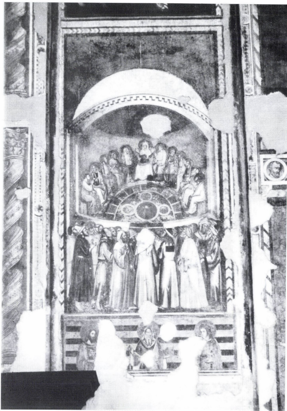
2. Pietro Cavallini (és műhelye): Freskó magyar királyszentekkel. Nápoly, Santa Maria di Donnaregina templom apácakórusának északi fala. 1308-1320.