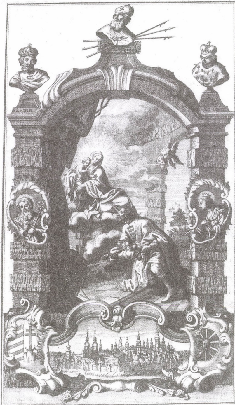
103. Sebastian Langer: Szent István koronafölajánlása, 1790 körül. Rézmetszet (a szerző gyűjteményében)