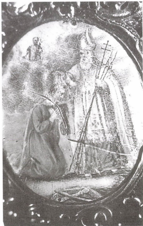
108. Ismeretlen ötvös: Vajk megkeresztelése, 1702. Zománckép. (Székesfehérvár, a Bazilika-Székesegyház sekrestyéje)