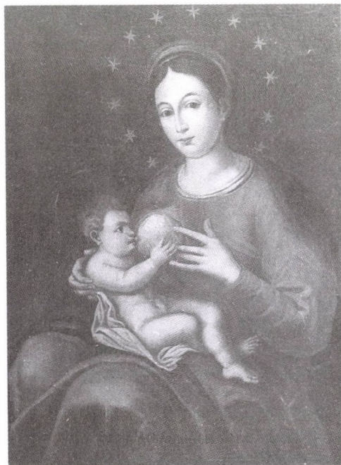
106. Ismeretlen festő: A tulli Szoptató Szűzanya-kegykép másolata, 1733. Olaj, vászon. (Székesfehérvár, a Bazilika-Székesegyház kanonoki sekrestyéje)