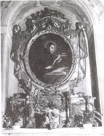
98. Werle Antal (?): Gonzaga Szent Alajos. A Szent Alajos kápolna oltárképe a székesfehérvári jezsuita (majd ciszterci) templomban, 1750 körül. Olaj, vászon.