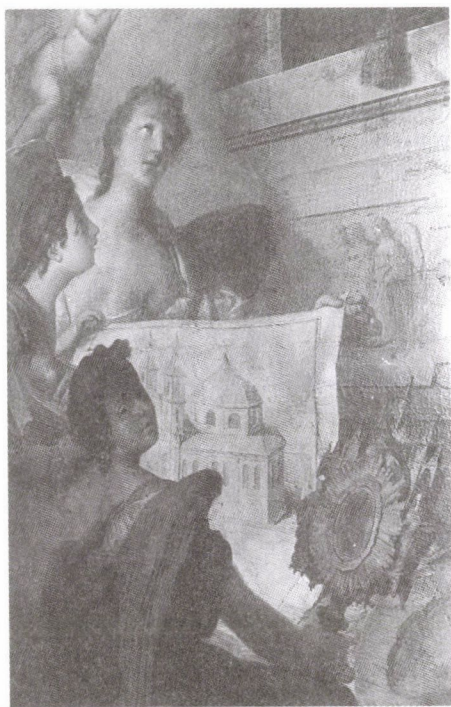
95–97. Vinzenz Fischer: Szent István koronafölajánlása. A székesfehérvári bazilika-székesegyház főoltárképe, 1775. Olaj, vászon. Részletek