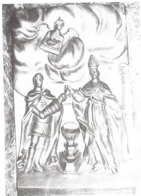
107. Ismeretlen szobrász: Vajk megkeresztelése. Fadombormű a leleszi premontrei templom főoltárán, 1750 körül.