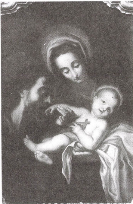
99. Szent Család. Fügőkép a székesfehérvári egykor jezsuita (majd ciszterci) templomban, 1750 körül. Olaj, vászon.