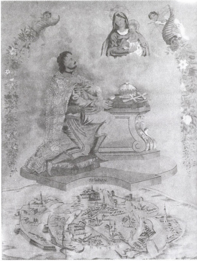
104. Ismeretlen festő: Szent István koronaföljálása Székesfehérvár látképével, 1800 körül. Papír, akvarell. (Székes- fehérvár, a Ba- zilika-Székesegy- ház sekrestyéje)