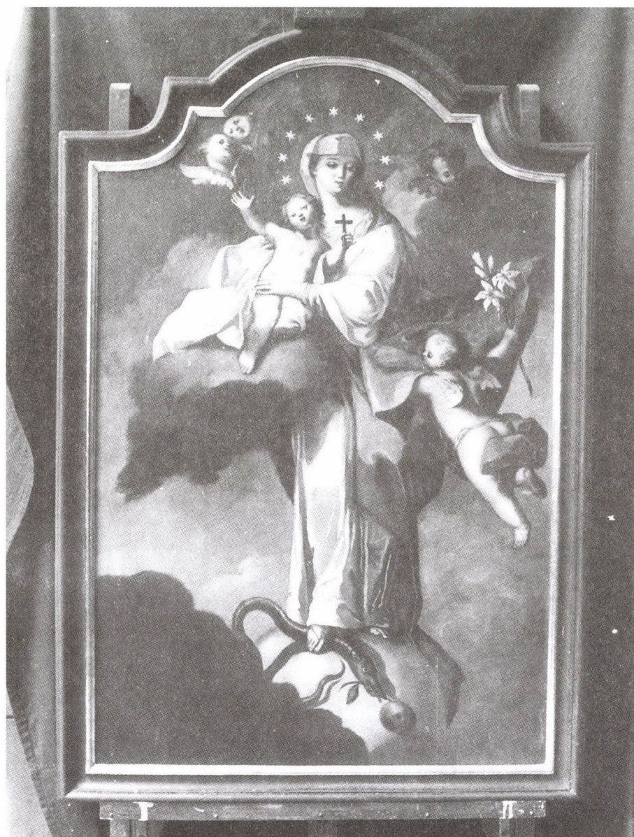
100. Franz Caspar Sambach (?): Győztes Immaculata, 1750 körül. Olaj, vászon. (Székesfehérvár, Egyházmegyei Múzeum)