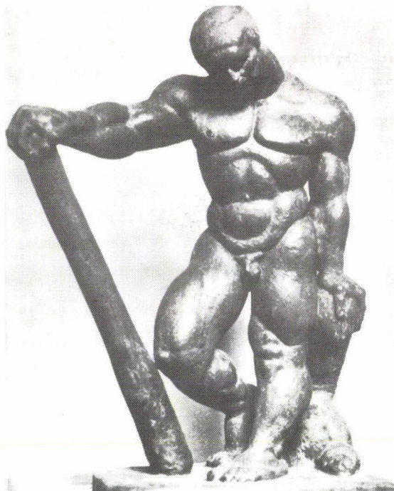
86. Schönbauer Henrik: Rabszolga (bronz), 1922. Ismeretlen helyen