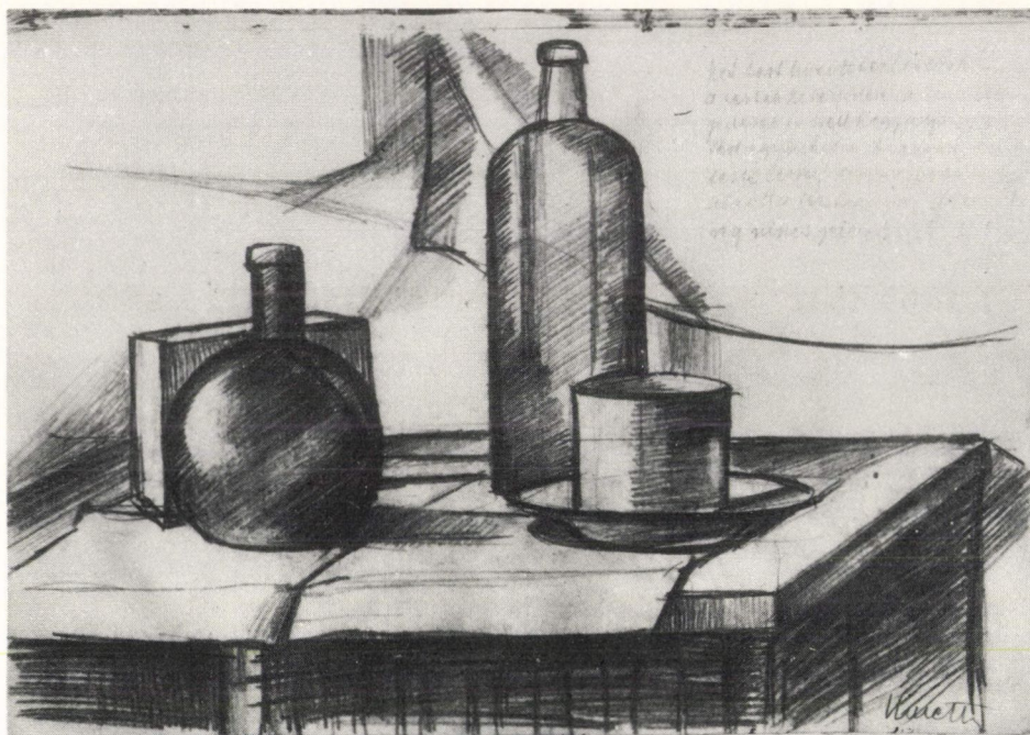
1. Kmetty János: A 10. lap a jegyzetfüzetből. 1920-as évek.

tal és céllal kapcsolatos elmélkedés fellelhető a jegyzetfüzetben is (6) : "Két egyszerű fogalom: az ut és cél. Soha ne téveszd össze. ..A célt soha ne feledd, mert ez szabályozza az utat. Vannak napok, mikor a cél tudata gyengül, az ut a-zonnal zavaros lesz. ..Céltalanság érzete és lelki depresszió áll elő. Feszültebb energia, agymunka és a kilengés megszűnik, a cél nyilvánvalóbb és hatalmasabb lesz. ..A céllal tisztában levők inkább konokul nyugodtan haladnak utjukon és ha vannak kételyei és kétségbeesett állapotjai, azok legtöbbször oly intímek, hogy idegeneknek egyáltalán meg nem láthatók. Szentség az, amely hitének féltve őrzött titka."