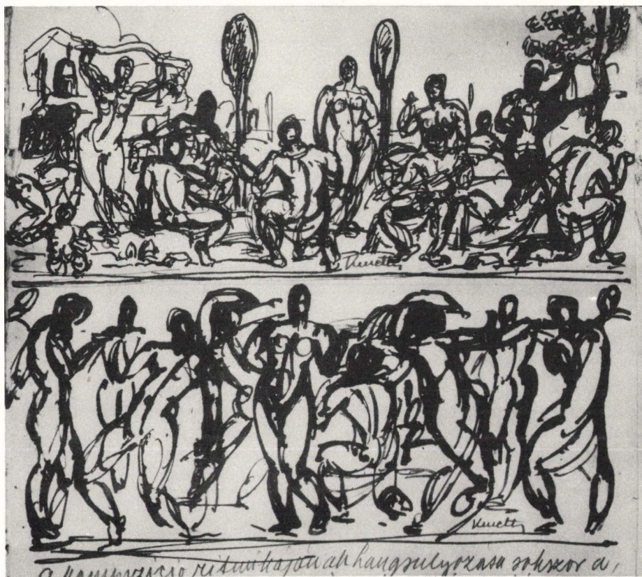
2. Kmetty János: A 11. lap két kompozíciója a jegyzetfüzetből. 1920-as évek.

Hevesy e cikkeiben a modern művészet irányzatait, egészen az aktivizmusig és dadaizmusig agónia jelenségeknek tartja, s a huszas évek elején új közösségi műfajok létrejöttével látja csupán meggátolhatónak a művészet halálát. Kmetty, aki akárcsak Hevesy Iván, néhány éve még igen közel állt az aktivizmushoz, Hevesy Iván véleményével szembefordulva újságcikkében leszögezi: "Helytelennek tartom Hevesynek azt a véleményét, hogy a modern művészet agonizál és merésznek a halálhírt. ..A kor művészete kétségtelenül rendkívül gazdag változatokban, ughogy anarchisztikusnak nevezhetjük, de ez még nem előjele halálának, hanem csupán tulajdonsága. A kor tulajdonsága: az anarchisztikus gazdasági élet, a társadalmi rend hullámzása, izgalmas és új megösmérések,