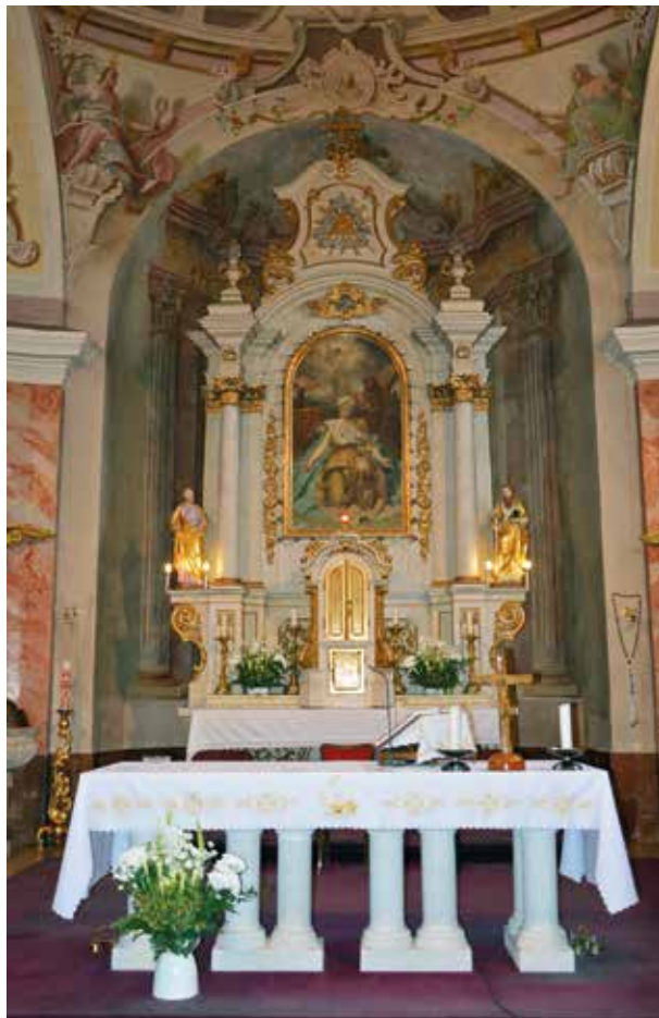
5. Bag, római katolikus templom. Főoltár, 1918 (Kovács Gergely felvétele, 2019)

Hasonlóan lelkes fogadtatásban részesült az örkényi római katolikus templom főoltára (4. kép), amelyet Sántha Ferenc rendelt meg 1913 szeptemberében, háromezer korona értékben. A Historia Domus ba bejegyeztek néhány történetet, amelyek pontos képet festenek az örkényi közösségnek az oltár megrendelése iránt tanúsított hálájáról: „Adjon az Isten minden templomnak