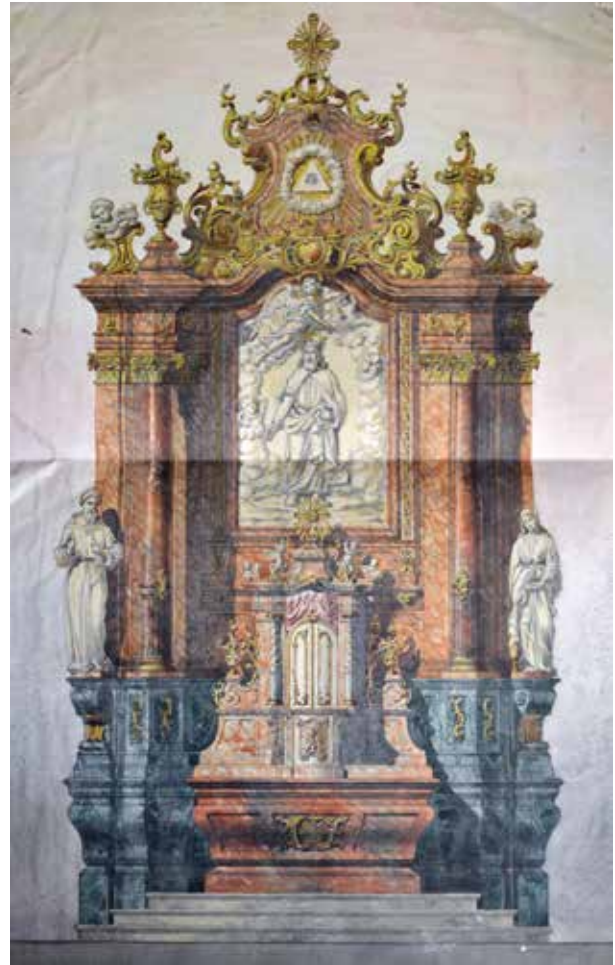
6. Sztrizs István: Ismeretlen oltár tervrajza

Sztrizs István életműve a kései historizmus magyarországi recepciótörténetéhez is fontos adalékul szolgál. Amint azt a legplastikusabban Tímár Árpád kutatásai körvonalazták, a historizmus iránt hosszú időn keresztül táplált ellenszenv – amit az utóbbi év-