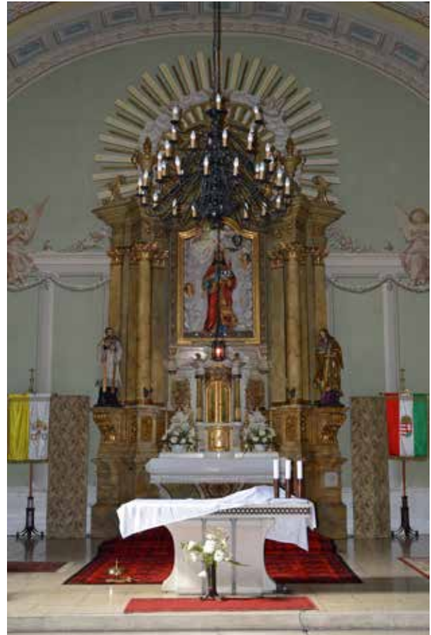
4. Örkény, római katolikus templom. Főoltár, 1914

A Historia Domus feljegyzése szerint „A díszes főoltár, mely luczfenyőből készült, 650 cm magas, 350 cm széles, 8 szoborral és 2 relyvvel [relieffel], finoman színezve, művészi faragványokkal, gazdagon aranyozva valódi Katalin-arannyal, a tabernákulum amerikai zárral, belül fehér selyemdamaszkkal [...]”. 27 A menzára helyezett szentségtartó mögött horizontálisan három részből álló, lépcsőzetes felépítésű, architektonikus retábulum kapott helyet. Középső, félköríves, háromszögű oromzat által koronázott szoborfülkéje magasabb, mint a két oldalsó. Mindhárom oromzat tetejére törpeoszlopok által keretelt, kis méretű szoborfülkék kerültek. A központi fülkében a templom, valamint a község védőszentjének, id. Szent Jakab apostolnak