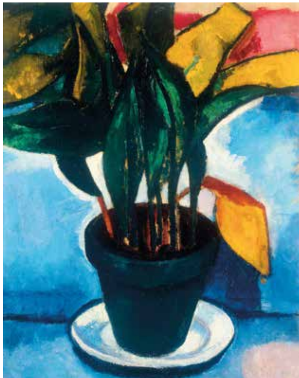
3. Czóbel Béla: Csendélet , 1908 Olaj, vászon, 73,5 × 59 cm, j. j. I.: Czobel Magántulajdon

dikálisabb újítókat tömörítő szűkebb társaságán belül is érzékelhető egy törésvonal, az új irány vezető egyéniségét pedig már nem Rippl-Rónaiban, hanem Kerns-