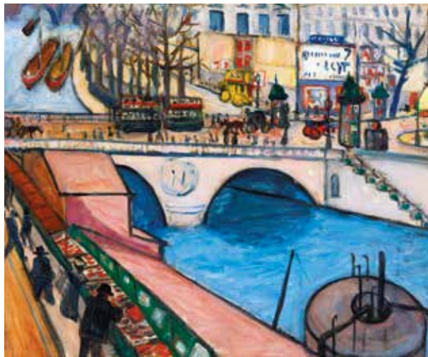
7. Tihanyi Lajos: Pont St. Michel (Paris) , 1908 Olaj, vászon, 53,5 × 65 cm, jelzés nyomokban lent középen: Tihanyi L. Magántulajdon

mellékletében szerepel –, hanem a végződés 1200 helyett K200-nak olvasandó, azaz kétszáz koronás árról tudósít. Ez egyértelműen arra utal, hogy a képet Tihanyi áruba bocsátotta – méghozzá kiállításon. Hogy a vakkereten szereplő ár magasabb, mint a Tihanyi által a levelében megszabott érték, az valószínűleg annak tudható be, hogy a festő árszabására Bölöni is rátette a saját költségeit és haszonkulcsát. Ezek szerint sokkal valószínűbbnek tűnik, hogy Tihanyi a nemrégiben előkerült első verziót küldte a vándorkiállításra, és nem az előzőleg megismert változatot, ahogy korábban hittük.