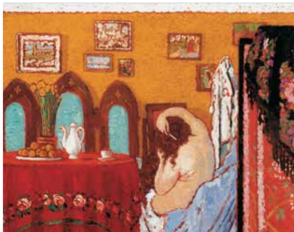
1. Rippl-Rónai József: Fésülködő nő (Intérieur női akttal) , 1909 Olaj, lemezpapír, 83 × 104 cm. j. j. l.: Rónai 09. Magántulajdon

a vidéki kiállításturnéhoz tartozó fejezet egyik láb-jegyzetében ez olvasható: „A Bölöni-hagyatékban egy beárazott katalógusra bukkantam. Rippl-Rónai képei 500–1000 korona között mozogtak.” 13