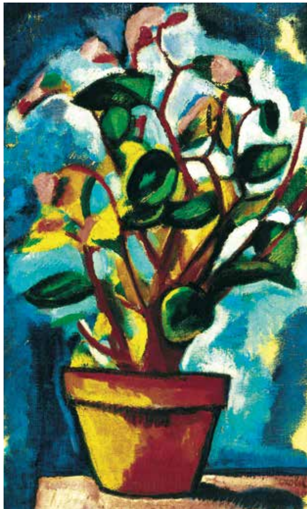
4. Czöbel Béla: Csendélet (Virágszendélet) , 1908 Olaj, vászon kartonon, 81 × 50 cm, j. j. I.: Czöbel 908. Magántulajdon

Berény esetében a kritikák mellett egyéb források is segítséget nyújtanak az azonosításhoz. Néhány éve a műkereskedelemben újra felbukkant egy korai, a festő Párizsba érkezésének első időszakából származó külvárosi vedutája, háztetőn sétáló macskával. 35 A festmény hátoldalán, a vakráma felső léccén magyar nyelvű felirat és koronában megadott ár is olvasható: „BERÉNY R. ES-