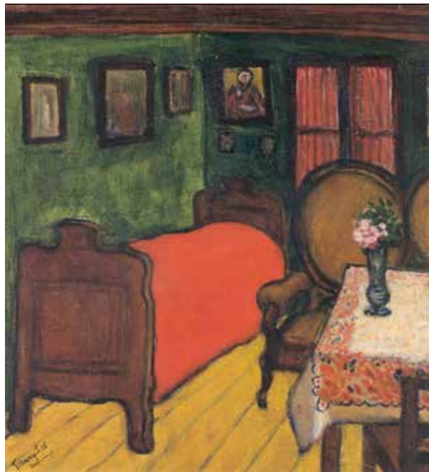
6. Tihanyi Lajos: Intérieur , 1908 Olaj, vászon, 59 × 55 cm, j. b. I.: Tihanyi L. o8 Nagybánya. Budapest, Petőfi Irodalmi Múzeum, ltsz. 65.24.1.

Tihanyi Böloninek küldött lajstromában azonosítható még a Fürdőzők című olajképe is, de erről nem esik említés a korabeli kritikákban. 45 A Nagybányai tájkép este és Tájkép mosónőkkel című festményeit reprodukcióról sem ismerjük, s velük kapcsolatban sem találunk konkrét utalást a tárlattudósításokban. A Pont St. Michel sem említik a korabeli sajtóban, de ezzel a címmel több festményéről is tudomásunk van. A két évvel Tihanyi halála előtt Párizsban megjelent monográfiában reprodukált verzió a mű 1910-es datálása miatt kizárható. 46 A 2000-es évek elején vidéki magángyűjteményben felbukkant egy 1908-as, korábban reprodukcióról sem ismert változat, s a legutóbbi évekig a téma kutatói egyöntetűen elfogadták, hogy az azonos a fent idézett Tihanyi-levélben is megemlített párizsi képpel. 47 Néhány éve azonban a teljes ismeretlenségből felbukkant egy harmadik verzió, a már említett 1908-as mű