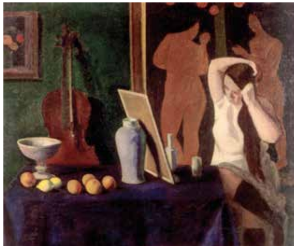
8. Czigány Dezső: Fésülködő nő , 1909 Olaj, vászon, 95 × 110 cm, j. b. f.: Czigány. Megsemmisült

Az akkoriban Budapesten időző Mikola András, társaihoz hasonlóan, minden bizonnyal a legfrissebb képei közül is igyekezett küldeni Bölöninek, köztük Gellért-