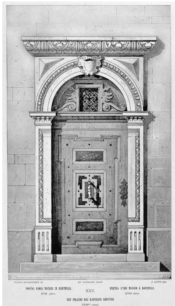
6. Myskovszky Viktor: Egy polgári ház kapuzata Bártfán, 17. század Myskovszky Viktor: Magyarország középkori és renaissance-stílus emlékei. Kunstdenkmale des Mittelalters und der Renaissance in Ungarn. 1–5. f. Bécs, é. n. [1885] A. Lehmann 3. f. XXV.

vájtatdász, az utóbbi évek ásatásai, illetve falkutatásai során kerültek elő – egyelőre még datálatlan – töredékek Regéc és Borsi várából. 37