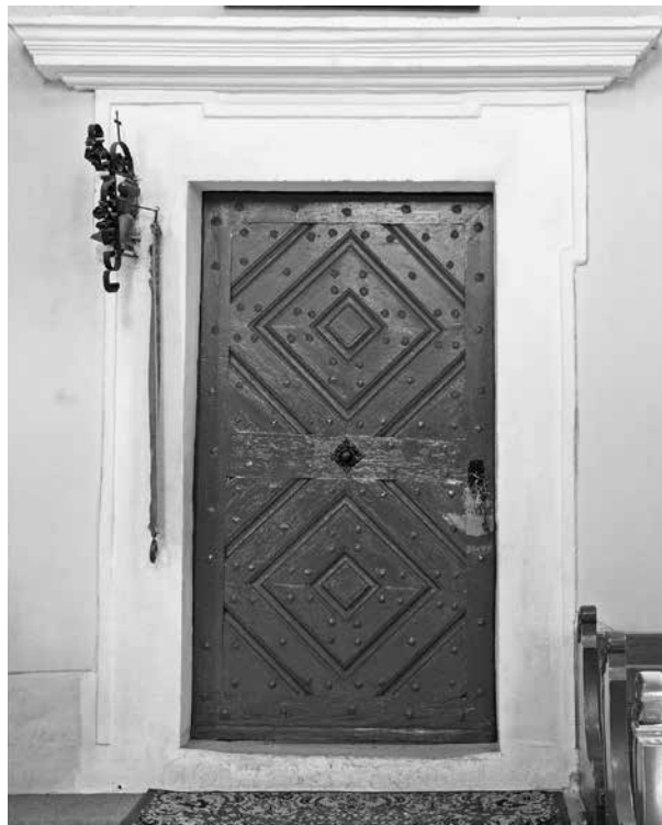
5. Tállya, sekrestyeajtó

A tállyai kapu pilasztereinek jellegzetes kannelúra-motívuma – azaz, hogy a vájatokba a pilaszter alsó felén pálcáttagokat helyeztek – több mint egy évszázadig nagyon kedvelt díszítőelem volt szárköveken, pilasztereken, lábzatokon. A fény-árnyék hatásokat hangsúlyozó motívum egyik legfinomabb, Magyarországon fennmaradt emléke a Bakócz- kápolnában látható. Erdélyben hosszú ideig kedvelt eleme volt (elsősorban kolozsvári) polgárházak, illetve a várak ajtó- és ablakereteléseinek. Egyik korai példa a szamosújvári Martinnuzzi-palota kapuja 1542-ből, 32 a kolozsvári polgárházak sorából kiragadva említhetjük a Híd utcai ház kapuját és ajtóit (1584–1590 között), 33 a Filstich–Kemény-ház 1597-es kapuját, a Rosás-ház 1636-os ajtókeretét, 34 míg a