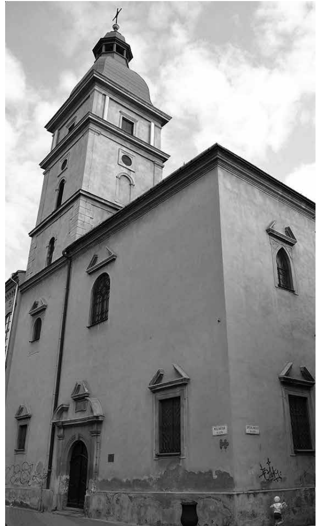
4. Kassa, egykori református templom

az 1680-as adóösszeírásokban is csak kőművesmestereket írtak össze. 23 A számos ponton kifogásolható módon helyreállított Rákóczi-kúria homlokzatain a másodlagosan felhasznált nyílászkeret-töredékekből rekonstruált, szíma-kíma-lemez elemekből álló késő