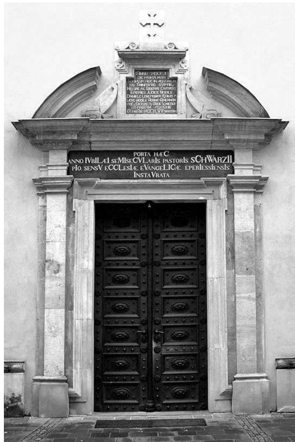
7. Az eperjesi magyar evangélikus templom déli kapuja

felvidéki, 17. századi, kora barokk építészetre jellemző, a zágrábi és nagyszombati jezsuita templomok (Jászi György, 1620–1632, illetve Antonio Carlone, Pietro Spazzi, 1629–1637) kapuinak mintájára terjedt el. A kassai református templom kapujánál korábbi és azonos felépítésű, a talán annak előképeként szolgáló, 1642–1647 között épült eperjesi Szentháromság evangélikus templom profílozott, füles keretelésű, kettős pilaszteres, oromzatos kapuja, ahol az építésre vonatkozó latin felirat a záradék nélküli oromzat újabb táblájában, míg a 19. századi renoválás felirata a képszeken olvasható. A táblán olvasható szöveg jó példa az évszázadok során történt szövegromlásra (7. kép). 38 A közeli sátoraljaújhelyi