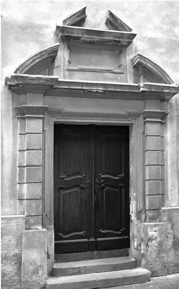
3. Kassa, egykori református templom déli kapuja