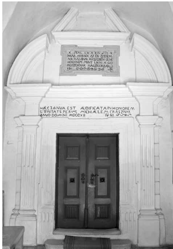
2. A tállyai római katolikus templom déli kapuja