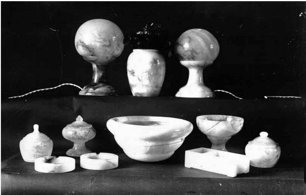
1. Lámpák, vázák, tálak, hamutartók, bonbonnierek a zalatnai iskola műhelyéből, 1908–1914

ben a zalatnai iskola beiratkozási lehetőségét az iparfejlesztés nemzeti programjában értelmezte, az írás szerzője nem más, mint a zalatnai iskola első igazgatója, Csánki József: