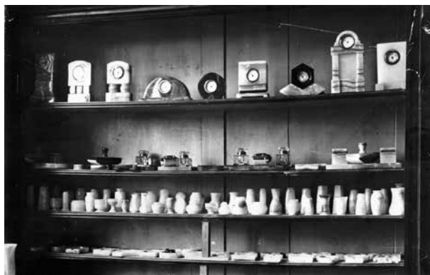
7. A kőcsiszoló műhely áruminta tára, 1908–1914 Corneliu Medrea Szakiskola Irattára, leltározatlan felvétél