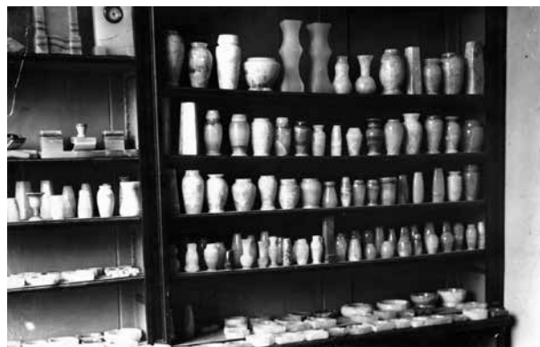
8. A kőcsiszoló műhely áruminta tára, 1908–1914 Corneliu Medrea Szakiskola Irattára, leltározatlan felvétél

zalatnai iskolában gondosan át is ültették a gyakorlatba: „A magyar nyelvi tanítás keretében gondot kell fordítani arra is, hogy a tanulók a földrajz és történelem köréből is elsajátítsák az általános műveltséghez tartozó legszükségesebb ismereteket.” 21 A magyar nyelvi óra másodlagos célja – az egyetemes ismeretek és a nemzeti kultúra magyar nyelven történő elsajátítása – az 1901-es tantervi reform során tovább erősödött. 22 A kőfaragó és kőcsiszoló iskola a magyar nemzetépítés és iparfejlesztés jegyében született, a magyar nyelven folyó, hiánypótló, sőt a kőcsiszolás tekintetében országosan egyedülálló jellege még a távolabbi magyarországi megyékben élők számára is népszerűbbé tette. Az iskolát egyedi képzési profilja már az alapítása körüli években is ismertté tette a Monarchia határain túl is, a belgrádi kormány már az alapítás hírére szerb állami ösztöndíjas növendékek oktatásáról kezdeményezett tárgyalásokat a budapesti Kereskedelemügyi Minisztériummal. 23