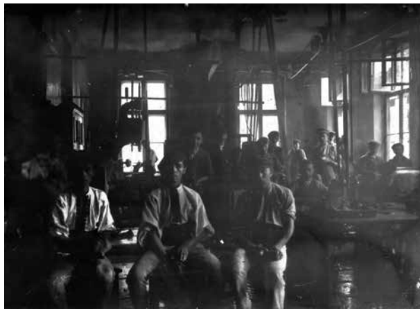
10. A kőcsiszoló műhely enteriőrje az azóta elbontott épületben, a kőcsiszoló-növendékek és tanáraik, valamint a műhely dolgozói, 1912–1914 körül Corneliu Medrea Szakiskola Irattára, leltározatlan felvétel