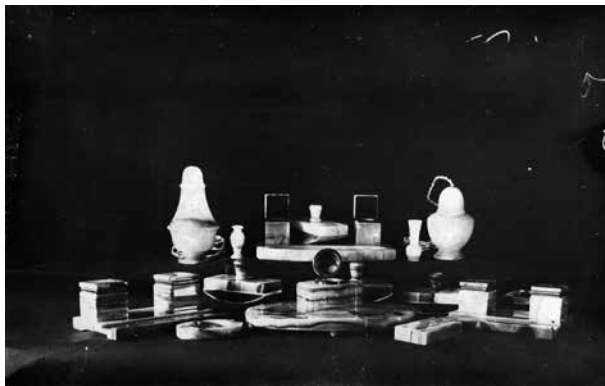
5. Lámpák, tintaitatók, tintatartók, hamutartók, levélnehezék, vázák a zalatnai iskola műhelyéből, 1908–1914 Corneliu Medrea Szakiskola Irattára, leltározatlan felvétel