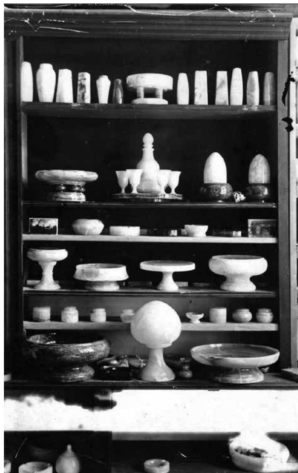
6. A kőcsiszoló műhely áruminta tára, 1908–1914 Corneliu Medrea Szakiskola Irattára, leltározatlan felvétel

A Kereskedelmi Minisztérium alá tartozó négyéves, magyar nyelvű zalatnai oktatás tanrendje megfelelt az 1890-es évek elejére kialakult központosított minisztériumi tantervnek. Elméleti részében kis szerep jutott általános