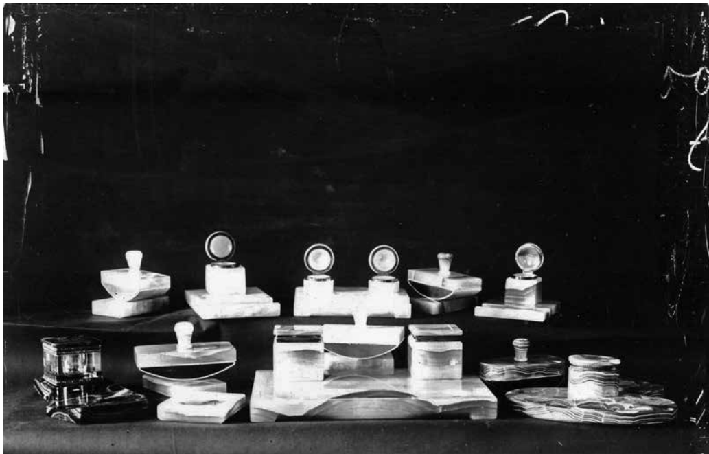
4. Tintaitatók, tintatartók, hamutartók, levélnehezék, vázák a zalatnai iskola műhelyéből, 1908–1914 Corneliu Medrea Szakiskola Irattára, leltározatlan felvétel

hónappal később, 1895. január 15-én, a Wekerle-kormány addigi tagja, a zalatnai iskola alapítását elrendelő Lukács Béla kereskedelmi miniszter a miniszterelnök lemondását követő napon letette a tárcát, két év és szűk két hónapos miniszterséget követően. Ugyanezen a napon az erzsébetvárosi Lukács család egy másik tagját, Lukács Lászlót pénzügyminiszterré nevezték ki, e funkcióját tíz évig töltötte be. Az államigazgatási karrierjét 1887-ben kezdő Lukács László a ranglétrán dinamikus lépkedett fölfelé. Abrudbánya–Verespatak körzet képviselője, a közfunkciói mellett bányatársasági főrészvényes politikai és közigazgatási pályafutása csúcsára ért ezen a napon. A lemondott Lukács Béla előbb a marosvásárhelyi I. kerület képviselője, majd 1896-tól az 1900-as párizsi világkiállítás magyar osztályának kormánybiztosa volt. 11 A zalatnai fejlesztéseken ezt követően is rajta tartotta a szemét: az 1895. január 15. körüli napokban a Ma-