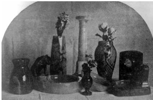
9. A kőcsiszoló műhely termékeit ábrázoló felvétel az iskolai Értesítő 1913-as számából

hely az új gépek mellett három, az iskolában végzet kőcsiszolóval bővült, akik a termelés állandó személyzetét alkották ekkortól. 29