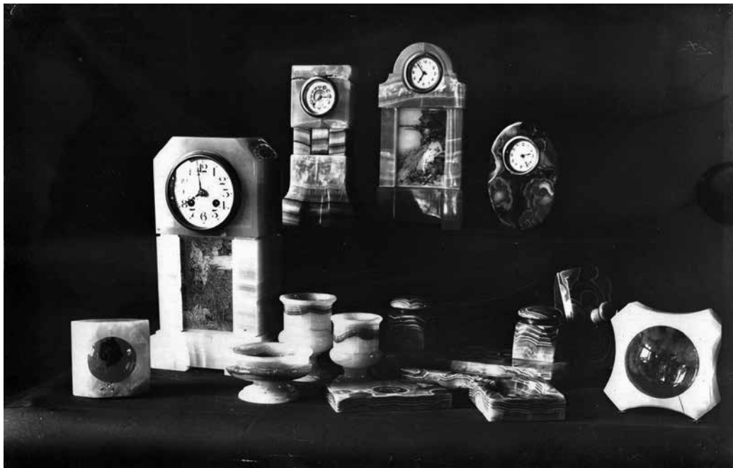
2. Órák, hamutartók, levénehezékek, tintaitató, tintatartó, levénehezék, kupák a zalatnai iskola műhelyéből, 1908–1914. Corneliu Medrea Szakiskola Irattára, leltározatlan felvétel

kristályok, s az arany, tellur és piritnek e kövekkel előforduló színes vegyületei bőven találhatóak a hegységekben s új kerszetforrást nyithatnak meg a vidék számára. 6 A kőcsiszolás hazai meghonosítása nem előzmények nélküli, az 1880-as évektől dokumentáltan fel-felröppenő ötletek azonban nem az industrializáció nemzeti programjába illeszkedtek, hanem, ahogy a fent idézett szöveg is utal rá, a vidéki lakosság keresetkiegészítéseként, helyi háziipari kezdeményezések részeként tekintettek a kőcsiszolásra. 1882-ben Torockón létesítendő kőcsiszoló műhely ötlete merült fel: „Ez a munkában edzett, szorgalmas, jóra való nép azonban megérdemelné, hogy hagyományos foglalkozásának megfelelő házi ipart honosítsunk meg közöttük. E célra a norimbergai árúk, kőcsiszolás, faragászat volna legalkalmasabbak, s a kinek módja és befolyása volna egy ilyen vállalat létesítésére, az nem csak emberbaráti nemes munkát cselekednék, hanem a kis magyar oasis megmentése által szerzett hazafiai elévülhetetlen ér-