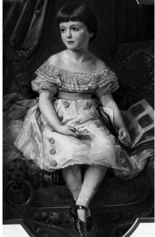
11. Wilhelm Wider: Károlyi Geraldine , 1880 körül Magántulajdon

Az emeleti „étterembe” kerültek az építető Károlyi Alajos és felesége, Erdődy Franciska szintén párt al-