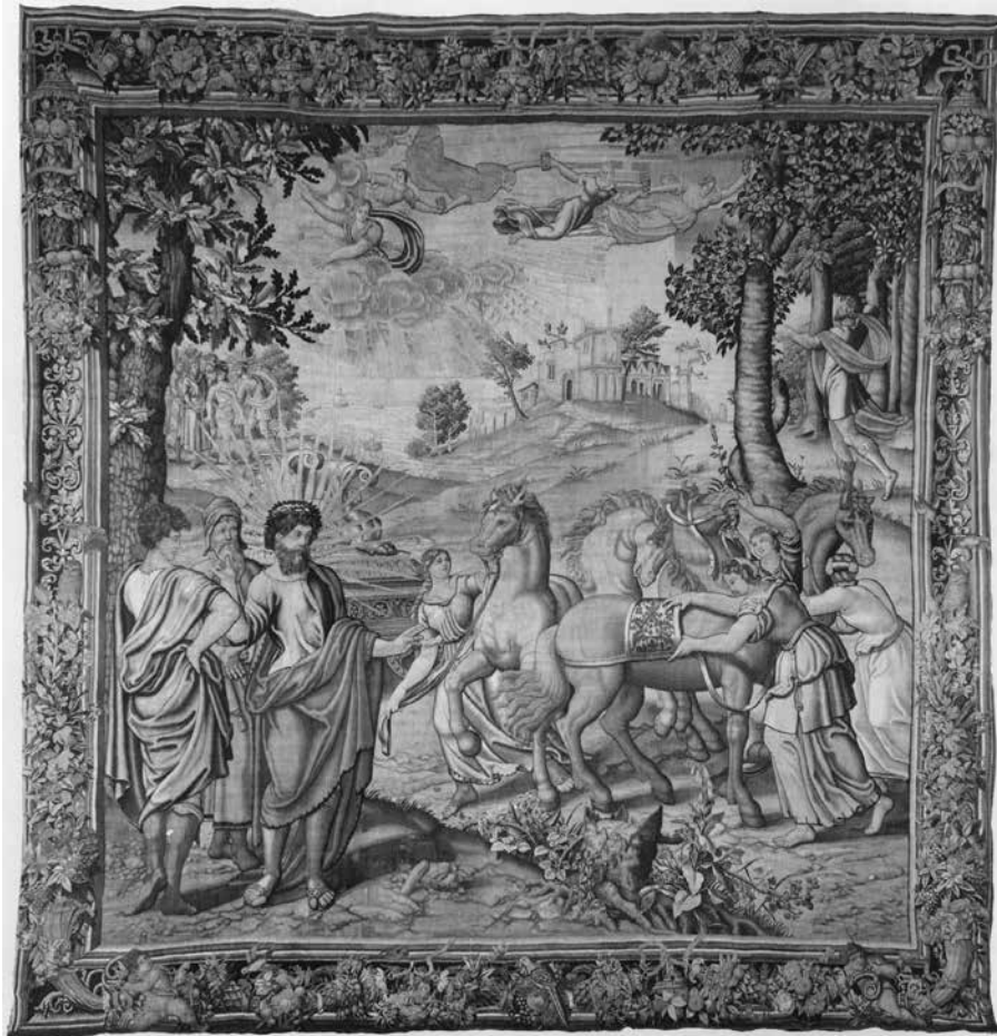
13. A hórák befogják Helios lovait a napszekérbe. Falikárpit, Brüsszel, 1535 körül Écouen, Musée national de la Renaissance

(Musée national de la Renaissance, Château d'Écouen) 1994-ben vétel útján kerültek. 49 A negyedik kárpitot, a sorozat első darabját – amely Heliost ábrázolta, amint megpróbálja lebeszélni Phaetont, hogy vezesse a nap aranyszekerét – nem sikerült azonosítani, de egyik részlete feltűnik az ebédlőteremről készült archív felvételek egyikének szélén. 50 Mellette, a terem keleti, a zöld