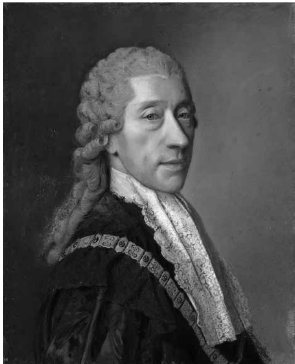
8. Jean-Étienne Liotard: Wenzel Anton, Graf von Kaunitz-Rietberg, 1767 Magántulajdon