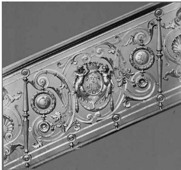
16. A palota lépcsőkorilátjának részlete Wien, Museum für Angewandte Kunst, Vorbildersammlung