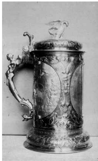
18. Fedeles ezüstkupa özv. Károlyi Alajosné gyűjteményéből