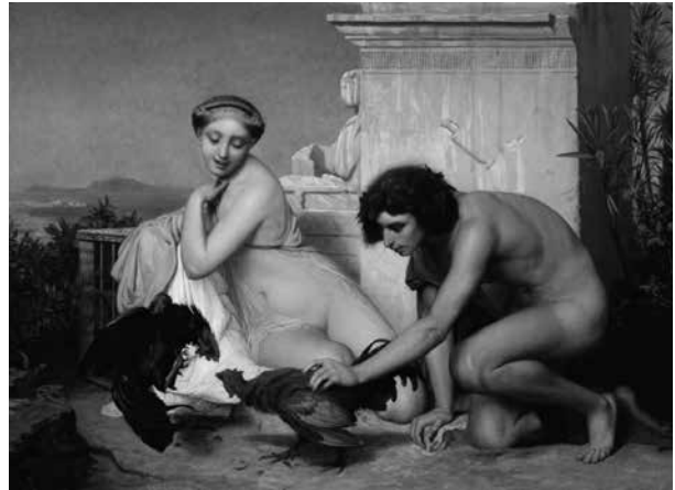
1. Jean-Léon Gérôme (1824–1904): Kakasviadal, 1865 Magántulajdon

A pesti palotában található műtárgyakról egészen a berendezés első, 1890-es számbavételéig kevés adatunk van, és ezek kizárólag azokra a festményekre vonatkoznak (mintegy harminc képre), amelyeket tulajdonosaik 1873–1888 között kiállítások számára kölcsönadtak. Így a Képzőművészeti Társulat 1873. évi tavaszi tárlatán a pesti palotából tizenöt kép szerepelt: Jean-Louis Ernest Meissonier (1815–1891) „ Hollandi zászló ”, Jean-Léon Gérôme (1824–1904) Kakasviadal , Andreas Achenbach (1815–1910) Ruhaszároгатás című festménye, Oswald Achenbach (1827–1905) egy táj- és egy utcaképe ( Nápolyi utca; Nápolyi tájkép ), Ludwig Knaus (1829–1910) egy kislányt ábrázoló portréja, August von Pettenkofen (1822–1889) Szolnoki vásár (Mária oszloppal) és Magyar tanya című képei, Charles Hoguet (1821–1870) Ostendei kikötő és Francia vásár , Louis-Gabriel-Eugène Isabey (1803–1886) Francia