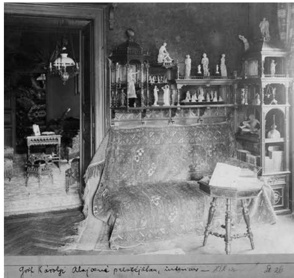
17. Interieur Károlyi Alajosné palotájában, 19. század Budapest, Iparművészeti Múzeum, Adattár–Fotótár

igényes berendezéssel rendelkezett, amelyhez „antik” faragott székek, kínai mintára készült szekrények, faragott talapzatokra helyezett porcelán, zömében kínai vagy chinoiserie díszítésű vázák is tartoztak.