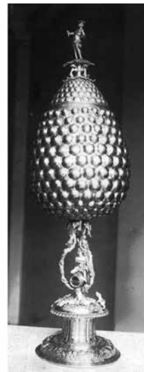
19. Szőlőfürt serleg (ún. Traubenpokal) özv. Károlyi Alajosné gyűjteményéből

A fogadószalon, valamint a táncteremből nyíló pihenőfülke faburkolatába ( lambrie ) foglalt képek egy része legalább szintén eredeti lehetett. A pihenőfülkét egy nagyobb és hat kisebb allegorikus kép díszítette, és ezekkel összhangban készülhettek a táncterem mennyezetét és hosszfalait díszítő, díszes keretbe foglalt „gobelinszerű” olajfestmények is, amelyeknek egy részét Wörsching János gobelinfestő készítette, aki egy korabeli forrás szerint több évig dolgozott a palota számára. 69 A korabeli beszámolók megemlítik, hogy a „magát büszkén magyarnak valló” Wörsching János Münchenben született, majd ugyanott szerzett festészeti szakképesítést, magyarországi letelepedése előtt pedig Londonban egy bizonyos Lord Windsor palotáját díszítette gobelinekkel. 70 Az említett Lord bizonyára azonos azzal a Lord Robert Windsor-Clive-val (1857–1923), akinek Hewell Grange-i kastélya díszítési