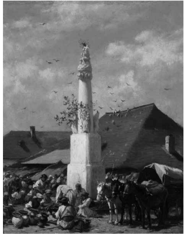
3. August von Pettenkofen: Szolnoki vásár (Mária-oszloppal) Magántulajdon

Pettenkofen két képe szerepelt az 1888-as kiállításán és a Nemzeti Szalon 1909. decemberi tárlatán. 28