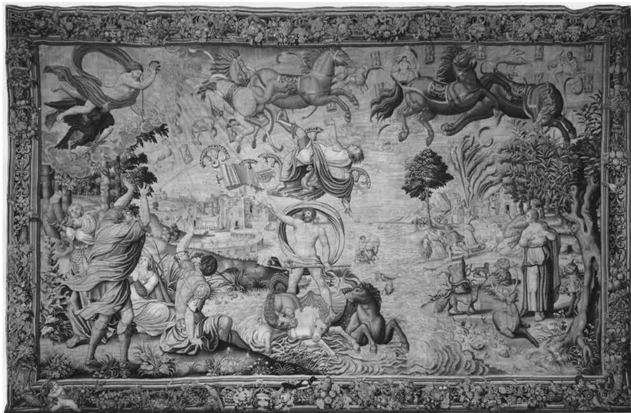
14. Phaeton bukása . Falikárpit, Brüsszel, 1535 körül Écouen, Musée national de la Renaissance

amint villámmal lesodorja az égről Phaetont, aki már elveszítette uralmát a lovai fölött, és túl alacsonyra szállva falvakat, erdőket gyújtott lángra. Az égbolton a megbokrosodott paripák előtt homokórák által elválasztva a zodiákus jegyek láthatók. Középen Phaeton alakja jelenik meg, amint lezuhan a darabokra törött hintójából. Alatta, a folyón, Neptunus látható kagylón állva. A háttérben egy lángoló város tűnik fel, amelynek lakói rémülten menekülnek, kissé előbbre a földet megszemélyesítő női alak látható, aki Jupiter közbeavatkozását kéri. 54