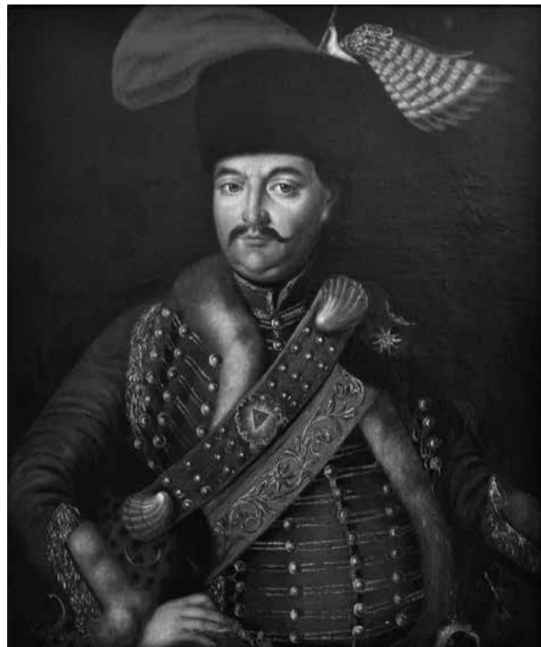
5. Károlyi Ferenc (19. századi másolat 18. századi portré nyomán) Magántulajdon

nában volt, ennek ellenére a palota 1890-es és 1901-es leltárai nem említik. 31 1919-ben mindkét kép szerepelt a köztulajdonba vett műkincsek kiállításán. 32 A művész többször megfestette mindkét témát, ami arra figyelmeztet bennünket, hogy azokban az esetekben, amikor egy adott festmény eredete nem ismert, ahhoz, hogy a provenienciára vonatkozóan feltételezésekbe bocsátkozzunk, az alkotó és a téma mellett valamilyen más egyedi jellegzetességnek, például szignónak, készítési időnek, méretnek is egyeznie kell. 33