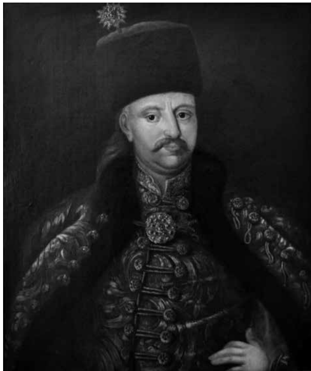
4. Károlyi Sándor (19. századi másolat 18. századi portré nyomán) Magántulajdon