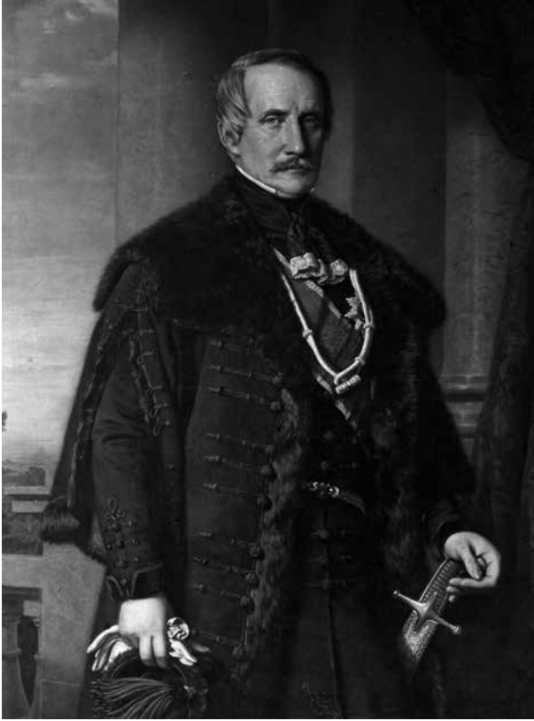
10. Barabás Miklós: Károlyi Lajos , 1859 Magántulajdon

A városi látképek, tengeri tájképek, zsáner- és életképek mellett a csendélet műfaját mindössze egy kép, Frans Snyders virág- és gyümölcscsendélete képviselte. Külön csoportot képeznek a családi portrék. Az ősök közül a nagy előszobában kaptak helyet Károlyi Sándor és Károlyi Antal „műbeccsel nem bíró, értéktelen” arcképei. Ezek feltehetően 18. századi eredetiek után készült másolatok lehettek, hasonlóak (vagy akár azonosak) a jelenleg Károlyi József tulajdonában levő két, Károlyi Sándort és Ferencet ábrázoló, azonos méretű portrépárral (4–5. kép).