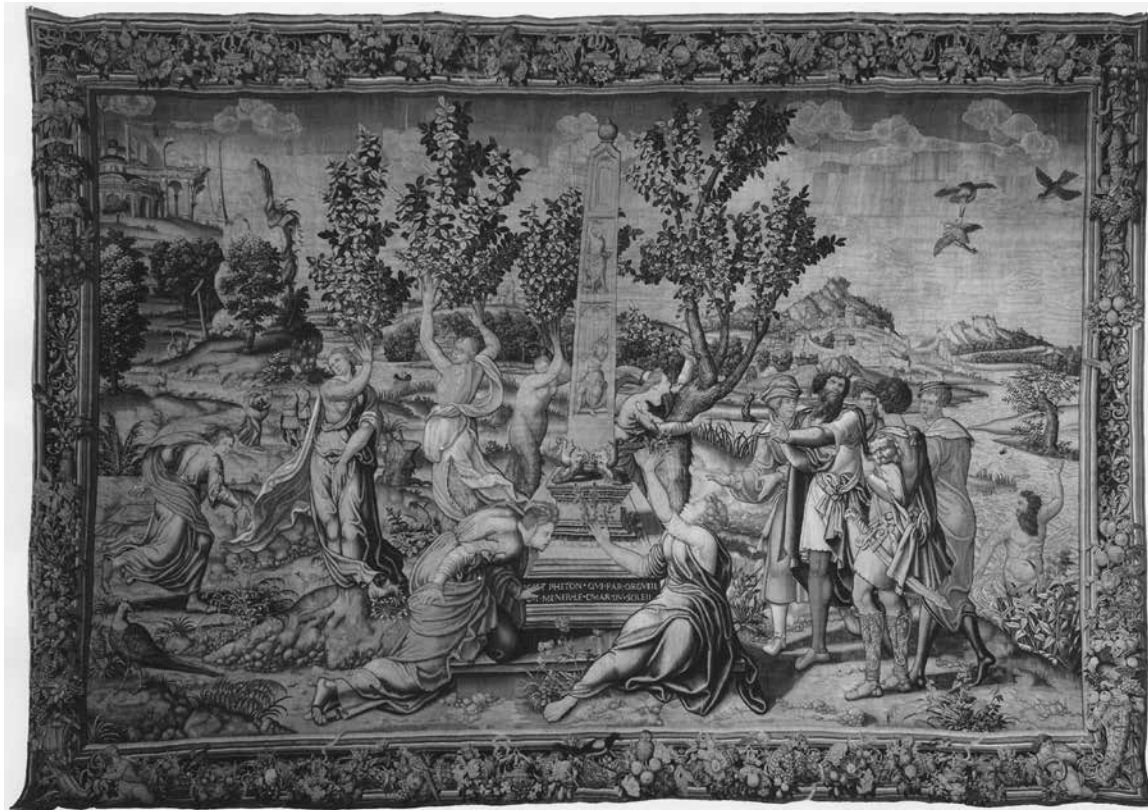
15. Phaetont eltemetik a nimfák, és a Heliasok fákká változnak. Falikárpit, Brüsszel, 1535 körül Écouen, Musée national de la Renaissance