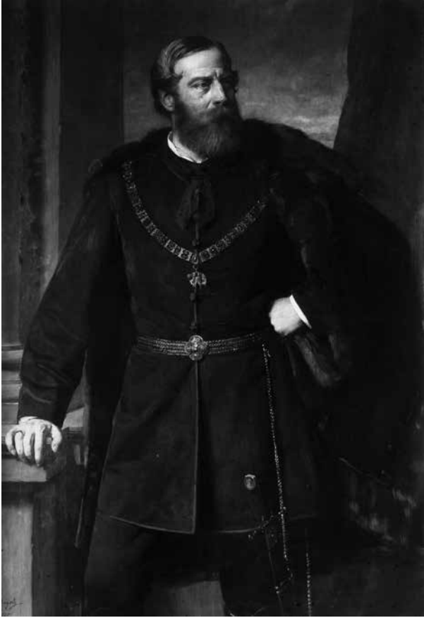
6. Heinrich von Angeli: Károlyi Alajos , 1880 Magántulajdon