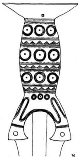
2. kép. Tiszalöki bronzkard (I.t.2) markolatának díszítése.

csésze függőlegesen átfúrt. A penge az alsó harmadában a legszélesebb. Felül a markolat alatt az egyik oldalán kis beugrás van, a másik oldala letöredezett. Közepén felül széles, alul elvékonyodó borda fut végig. Ezt a penge egész hosszában függőleges vonalcsoportokból álló minta kíséri. A kard hossza: 63,2 cm.