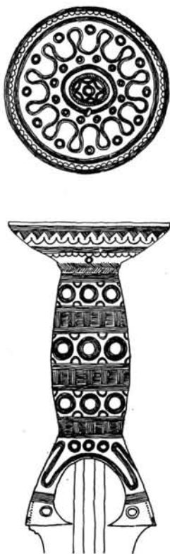
1. kép. Tiszalöki bronzkard ( I.t.1 ) markolatának díszítése.

A következő kardok tartoztak a leletbe: 1. Csészés markolatú bronz kard ( I.t.1 ). A markolatot gazdag díszítés borítja ( 1. kép ), a markolatcsésze függőlegesen átfúrt. A penge felső része keskeny, legnagyobb szélességét alsó