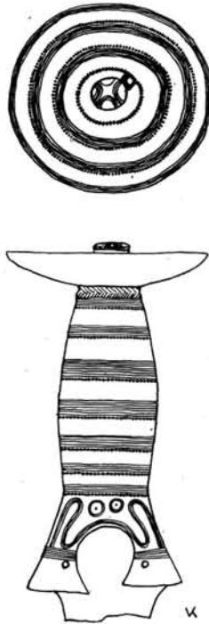
3. kép. Tiszalöki bronzkard ( II.t.2, III.t. ) markolatának díszítése.

A tiszalöki kardok közül egy a Müller-Karpe által meghatározott