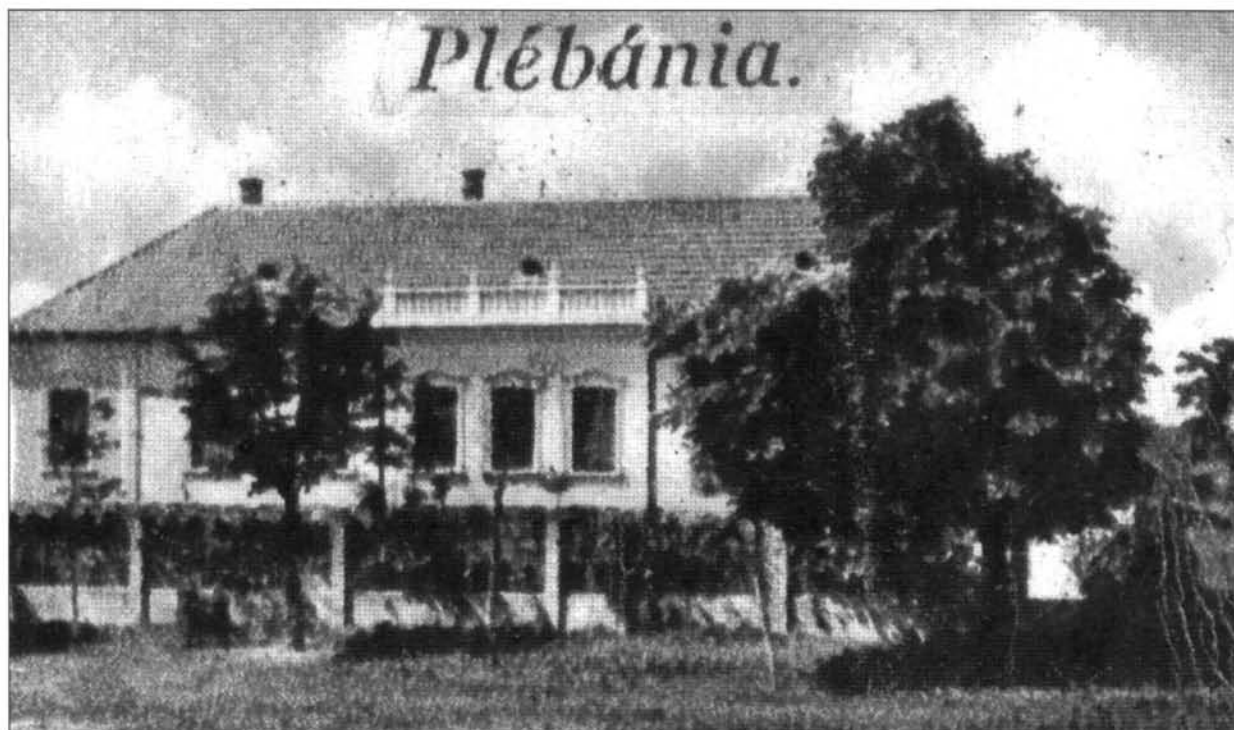
3. kép: Az új épület egy 1934-es képeslapon (részlet, KBM képeslap gyűjtemény, ltsz.: 2003.280.1.)