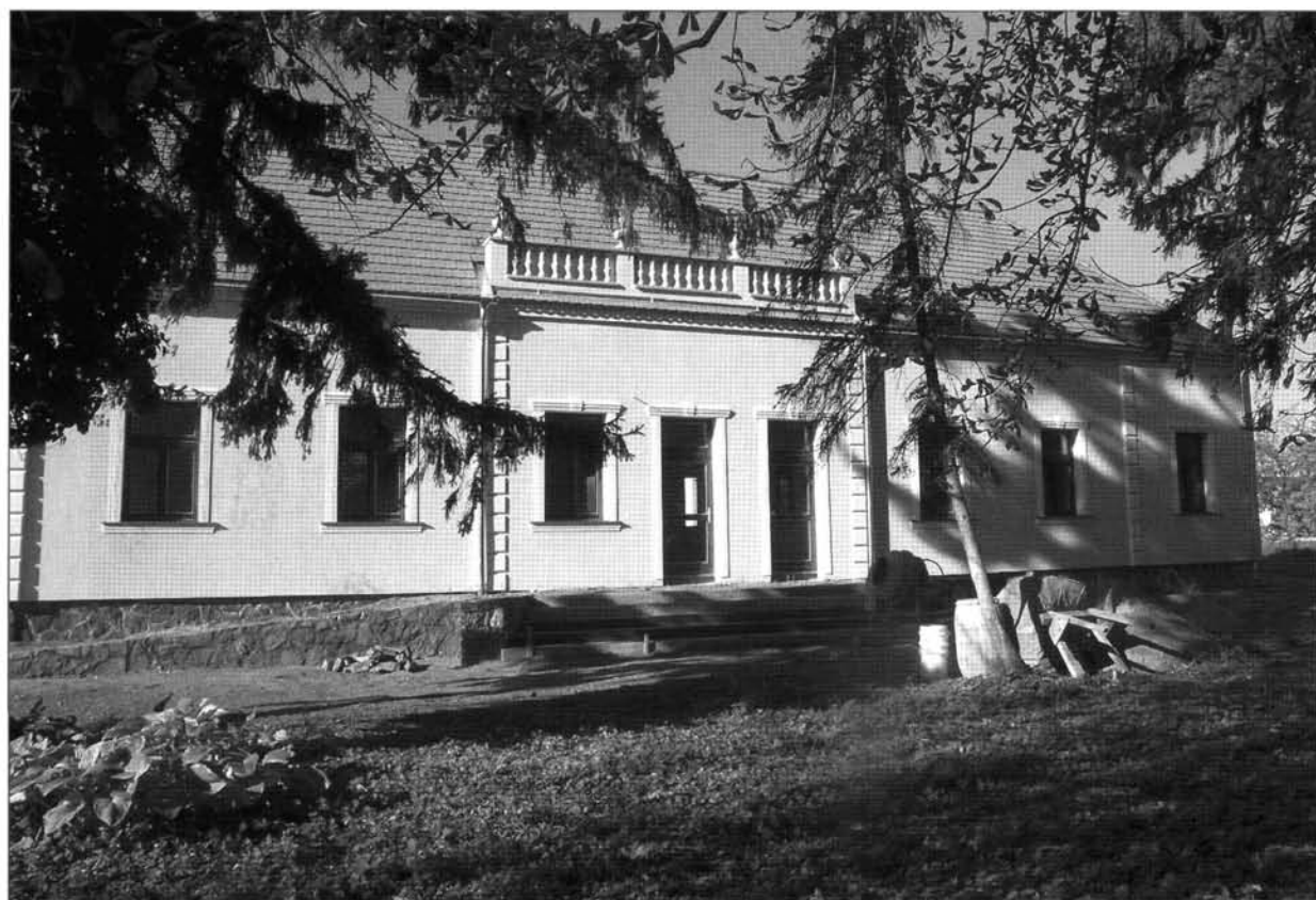
4. kép: Az újjáépített plébániaépület 2007 őszén