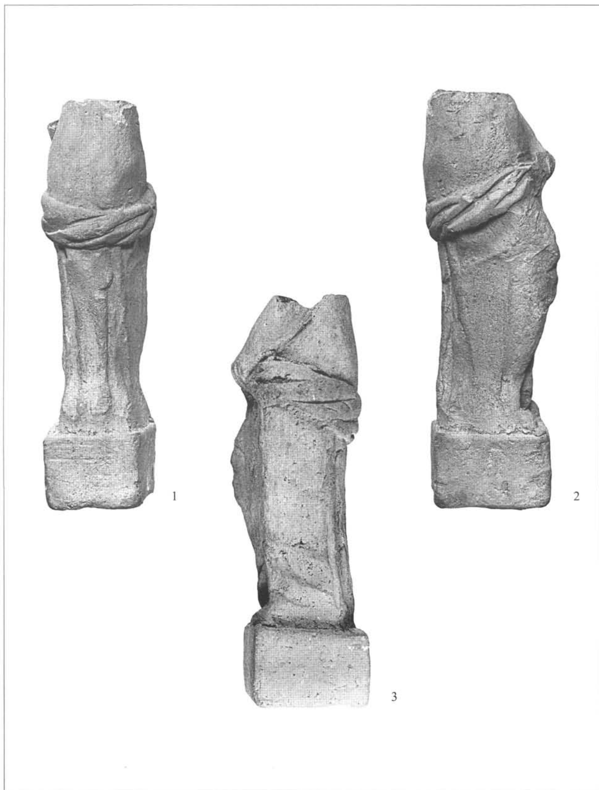
2. kép: 1: A balácai Venus szobrocska hátoldala – Back of the Venus figurine from Balácsa; 2: A balácai Venus szobrocska jobb oldala – Right side of the Venus figurine from Balácsa; 3: A balácai Venus szobrocska bal oldala – Left side of the Venus figurine from Balácsa