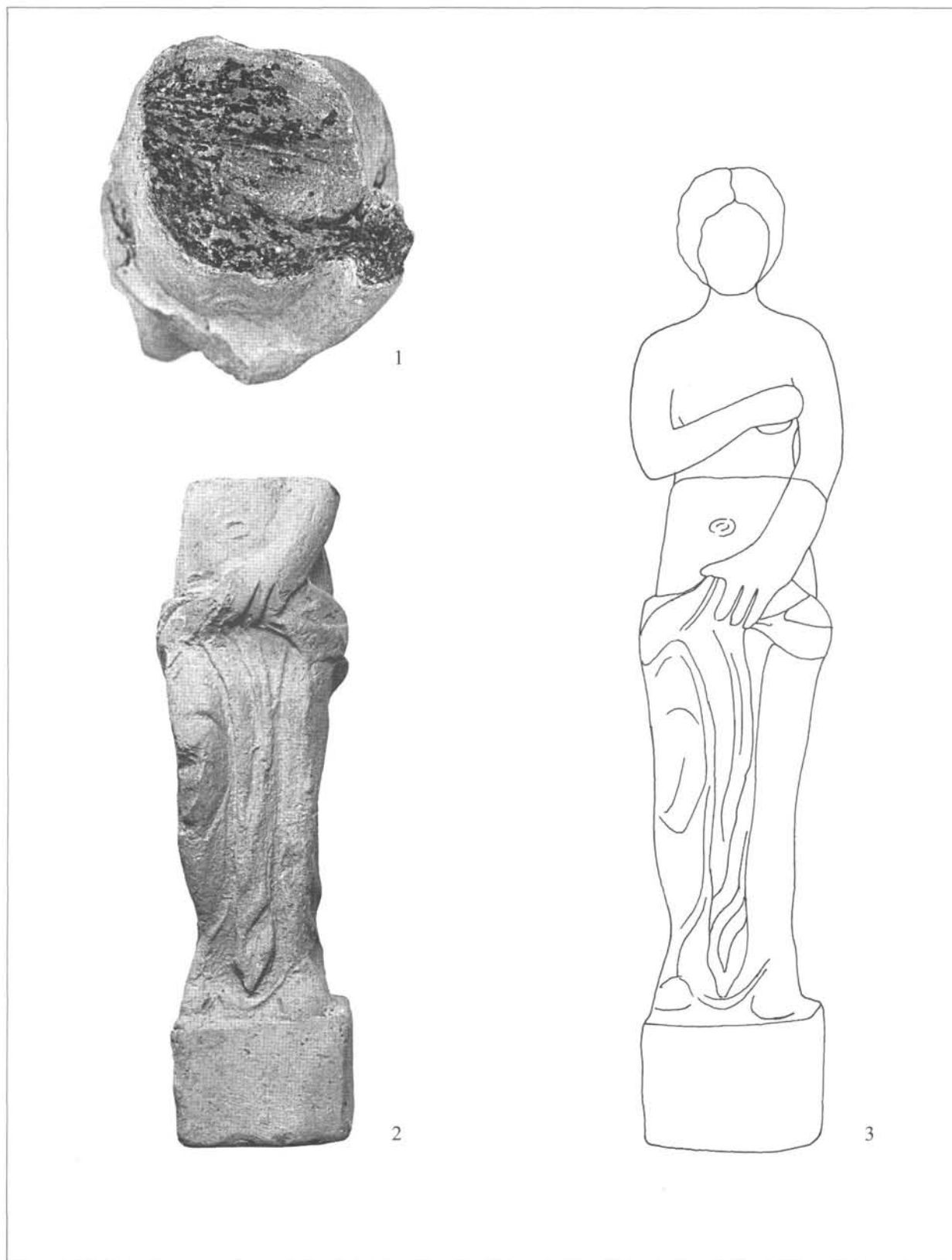
1. kép: 1: A balácai Venus szobrocska törésfelülete – Broken surface of the Venus figurine from Balácsa; 2: A balácai Venus szobrocska – The Venus figurine from Balácsa; 3: A balácai Venus szobrocska rekonstrukciós rajza – Reconstruction of the Venus figurine from Balácsa