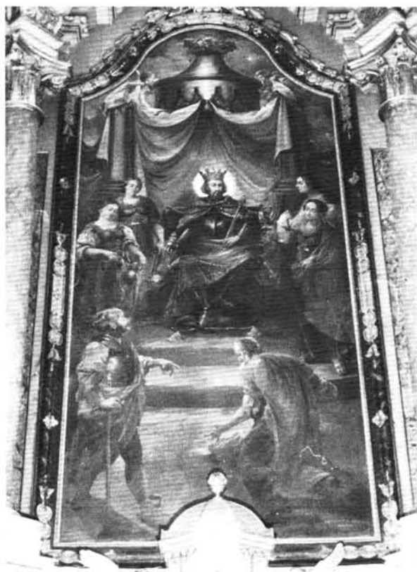
3. kép: Schmalzl Theotimus a kegyhely legendáját ábrázoló főoltárképe