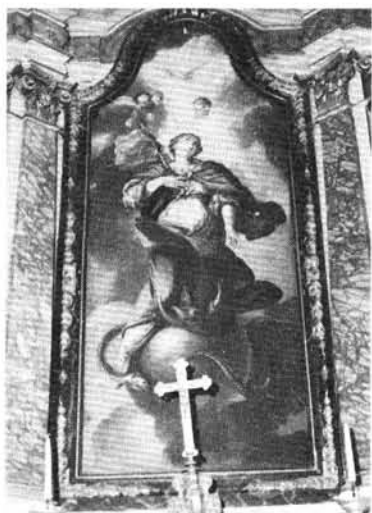
5. kép: Immaculata, oltárkép