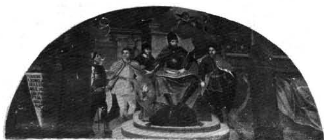
14. kép: Schmalzl Theotimus: Szent László főemberei körében