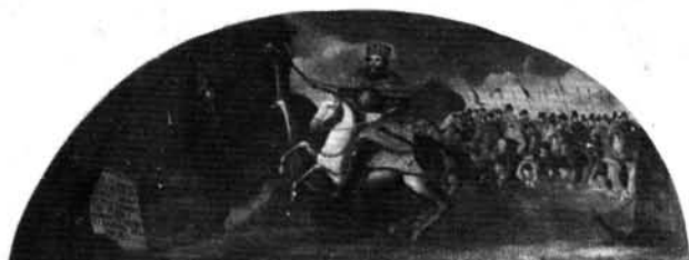
13. kép: Schmalzl Theotimus: Szent László vizet fakaszt a sziklából