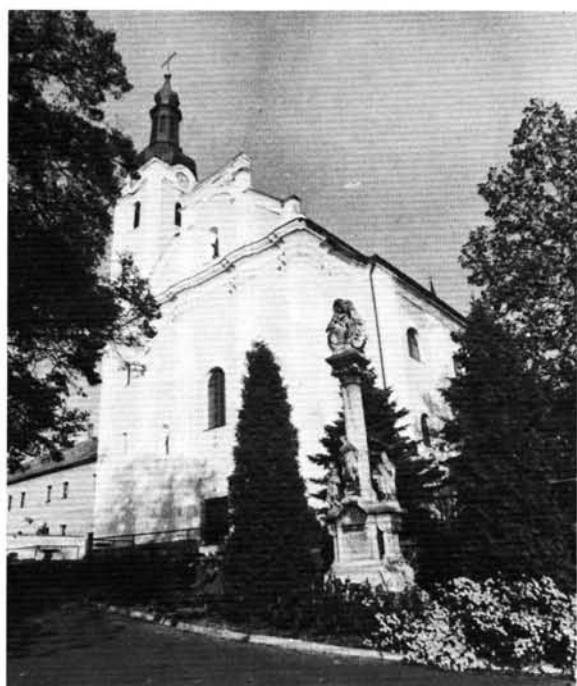
1. kép: A búcsuszentlászlói templom homlokzata