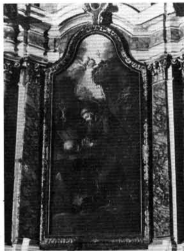
12. kép: Assisi Szent Ferenc, oltárkép