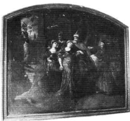
18. kép: Kálvária – Bűnbánó Magdolna Krisztus keresztje alatt