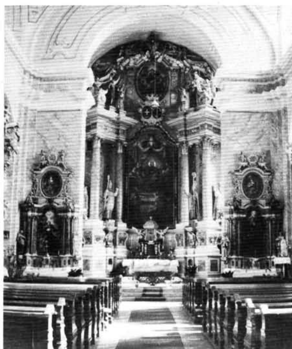
2. kép: A templombelső a főoltár felé nézve