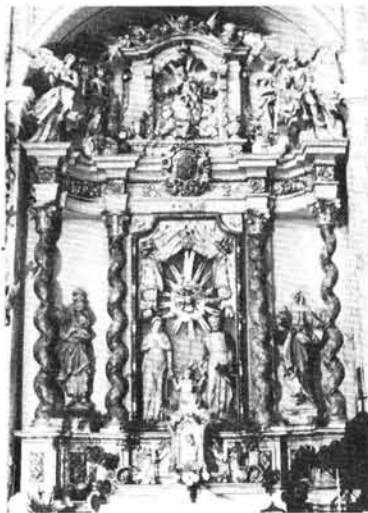
6. kép: A Szent Család-oltár