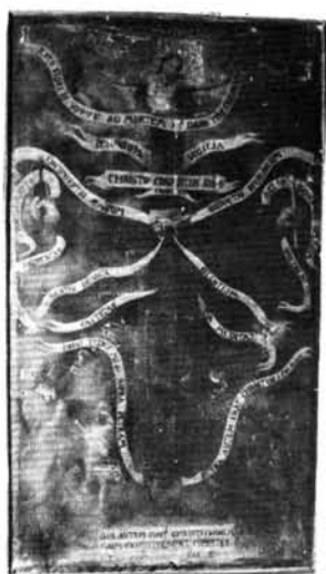
15. kép: Assisi Szent Ferenc stigmatizációja