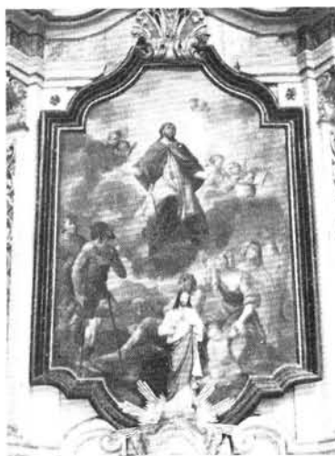
9. kép: Nepomuki Szent János, oltárkép