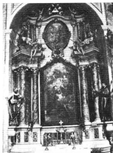
8. kép: Paduai Szent Antal, oltárkép