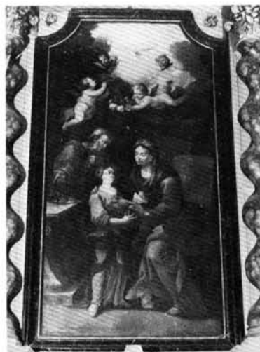
11. kép: Fr. An. Granister: Szent Anna, oltárkép