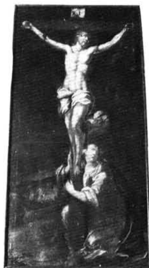
19. kép: A búcsújáró kápolna főoltára a kegyszoborral