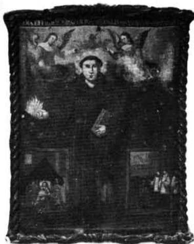
16. kép: Paduai Szent Antal Máriával és a gyermek Jézussal