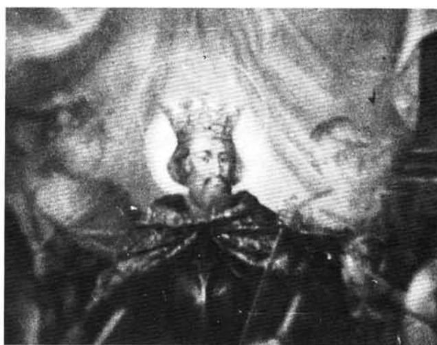
4. kép: A főoltárkép részlete infrakamerán keresztül. A felvételen jól látszik a Szent László két oldalán álló, átfestett nőalak sziluettje.