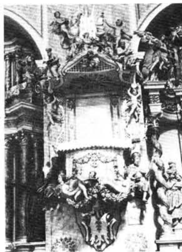
7. kép: A szószék