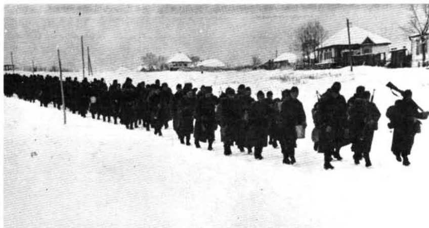
3. ábra. Menetoszlop a Donnál. (1942. december 5.)

A századparancsnok (a jelentésekből nem derül ki, hogy az ezred melyik zászlóaljának melyik százada hajtotta végre a harcállalkozást!) már három nappal előbb önkéntes jelentkezőkből válogatott össze egy 22 fős rohamosztágot (tíz géppisztolyost, két robbantót, három ködösítőt, négy lángkézigránátost és három kézigránát mesterdobót.) December 8-án este 20 órától a magyar tüzérség bénítótűzet lőtt a kiszemelt szovjet vonalakra. Ennek leple alatt a századparancsnok – két emberével – szemrevételezte a kijelölt szovjet állásokat. A másnapi tűztámogatásra a német 417. gyalogezred még ittlevő két gyalogsági ágyús üteget, saját aknavető szakaszt és öt géppuskásrajt rendelték ki. December 9-én hajnali 04 óra után a rohamosztag már a készenléti vonalban volt, mikor – minden valószínűség szerint