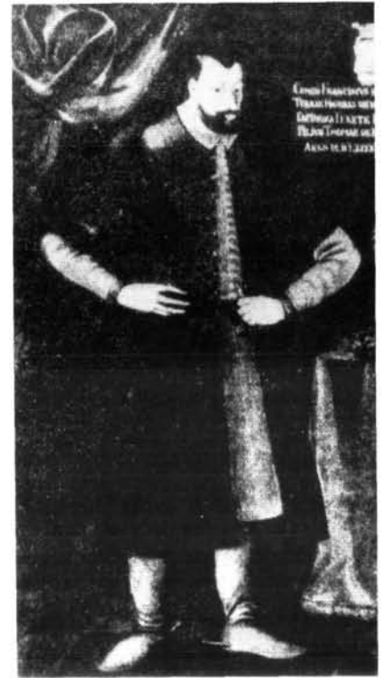
11. ábra. Nádasdy Ferenc, az „erős fekete bég”.