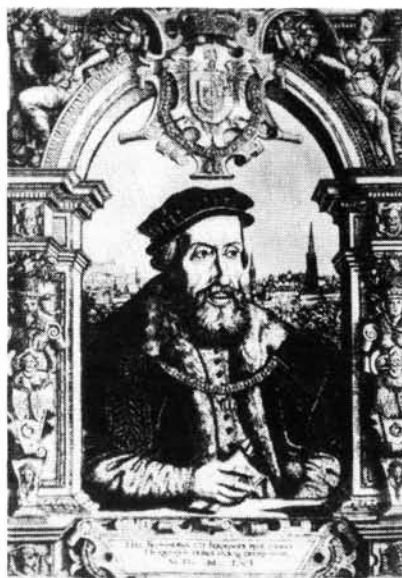
7. ábra. I. Ferdinánd német-római császár és magyar király.

6. ábra. Zrínyi Miklós gróf, a „szigetvári hős”.