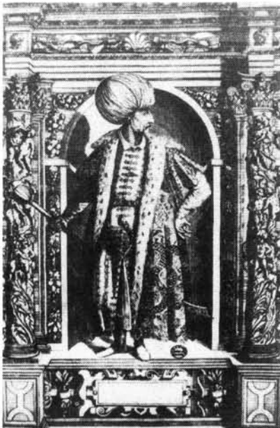
8. ábra. Nagy Szulejmán szultán. Dominicus Custos metszete a XVI. századból.

nem lévén elég vasszegük, a kötésekkel kissé hátramaradtak. A következő év januárjában pedig azt jelentette Kanizsáról Nádasdy Tamásnak, hogy a Rajky-bástya és a mellette húzódó palánkfal feltöltését elvégezték, s befejezték a kapu melletti bástya felépítését is. Ez utóbbi vastagsága – a tisztartó jelentése szerint – kívülről 3 öl, belső oldalán pedig 2 öl. Szele Jakab leveléből kiderül, hogy a Szalay Lénárt és a Máté diák bástyái között húzódó falakat is megfonták, továbbá a szükséges „lövő-