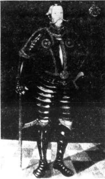
2. ábra. Nádasdy Tamás teljes vértzetben.

Ismeretes, hogy fiának, Ferencnek is jónéhány alkalommal vitái voltak a bécsi udvarral, főleg a tizenöt éves háború időszakában. Nádasdy Ferenc ugyanis nehezményezte, hogy a súlyos haditerhek és katonai veszteségek elsősorban a magyar lakosságot sújtották, de kifogásolta azt is, hogy a bécsi udvar nem elégséges támogatása miatt a háború értelmetlenül elhúzódik, ami újabb terheket ró a föld népére. 4 Köztudomású, hogy a Nádasdy-család leszármazottjai közül többen a 17. században a Habsburg-ellenes nemzeti függetlenségi mozgalmakhoz csatlakoztak. Így ott találjuk őket Bocskai István (1604–1606) és Bethlen Gábor (1613–1629) erdélyi fejedelmek felkelői között, akikkel vállelve a rendi és nemzeti sérelmek orvoslásáért küzdöttek. 5 A Wesselényi-összeesküvés idején Nádasdy Ferenc országbíró csatlakozott a Habsburg abszolutizmussal elégedetlen főurak csoportjához, amiért 1671-ben fej- és jószágvesztésre ítélték, ingó- és ingatlan vagyonát pedig elkobozták.