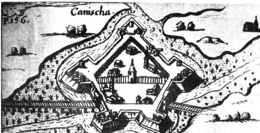
9. ábra. Kanizsa látképe.

Az új védőművek emelése, ágyúállások létesítésére alkalmas, széles bástyák kiépítése hatalmas költséget és nagyfokú műszaki tudást igényelt. Megfelelő anyagi fedezet hiányában azonban a főurak nagyobb része képtelen volt ezt megtenni, ezért már az 1543. év 7. tc. joggal állapította meg, hogy a nagybirtokosok – a török állandó pusztításai miatt – nincsenek abban a helyzetben, hogy várakat megerősítsék. Ezzel Magyaríazható, hogy az 1550–1560-as években mindinkább az uralkodó vette át a végvárak fenntartásának gondját, bár még mindig szép számmal maradtak egyes földesurak kezén is, akik főként familiáris magánkapataikkal igyekeztek azokat megvédeni. Ugyanakkor az 1547. évi nagyszombati országgyűlés elhatározta, hogy mindazokat a kastélyokat és erősségeket, amelyeket a király beleegyezése nélkül építettek – régebbi intézkedések értelmében – el kell pusztítani. Majd 1548-ban rendeletileg kimondták a kevésbé hasznavehető várak lerombolását. Teljes rendszerességgel aztán