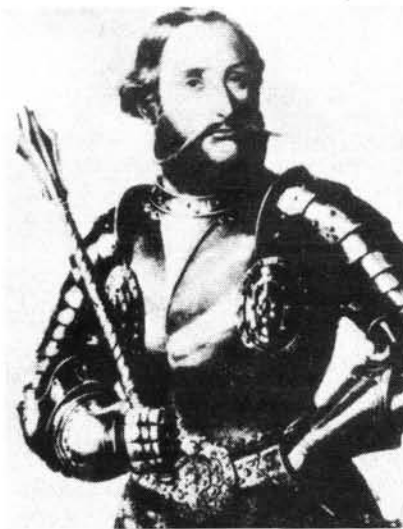
1. ábra. Nádasdy Tamás nádor portréja

Az 1550-es évek elejétől Nádasdy Tamás szinte teljes energiáját leköltötte a közügyekkel való foglalkozás, főként azután, hogy 1554-ben a magyar rendek nádornak választották meg. E tisztségen kívül ő látta el a helytartói teendőket is, ami azt jelentette, hogy az uralkodó és a rendek vitájában döntőbíróként kellett fellépnie. Munkáját mindenkor nagy körültekintéssel és tisztelettel végezte, bár feladata érthetően nem volt könnyű. Keserűen kellett ugyanis tapasztalnia, hogy a Habsburg uralkodó nem tekinti szívügyének a török elleni védelem hatékony megszervezését és a végvárak őrségének rendszeres fizetését. 3 Ezzel magyarázható, hogy elégedetlenségének az országgyűlés vitáiban többször is hangot adott, követelve a bécsi udvar erőlesebb katonai és gazdasági segítségnyújtását. Természetesen az ilyen jellegű megnyilatkozásai aligha találtak kedvező fogadtatásra Bécsben, s így érthetjük meg azt, hogy Nádasdy Tamás halálát követően közel fél évszázadig nem töltötték be a nádori tisztséget.