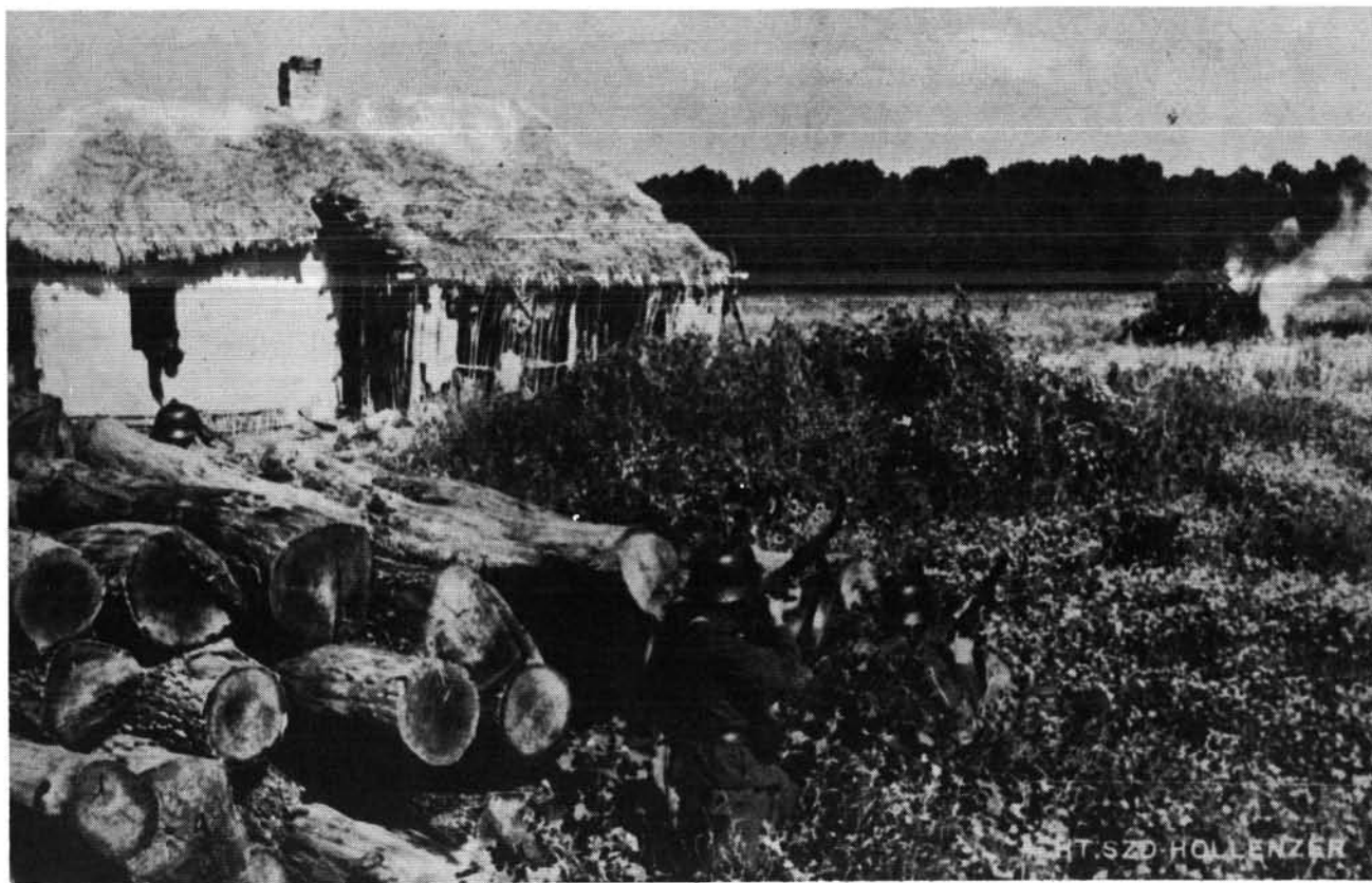
7. ábra. Magyar gyalogság tűzharcban a Don menti erdőben. (1942. augusztus 20.)

Augusztus 23-án a hajnali órákban a szovjet csapatok újra támadásba mentek át. Hajnali 04 óra 50 perc körül egy 120 főnyi csoport a 185.6 háromszögelési pont irányából