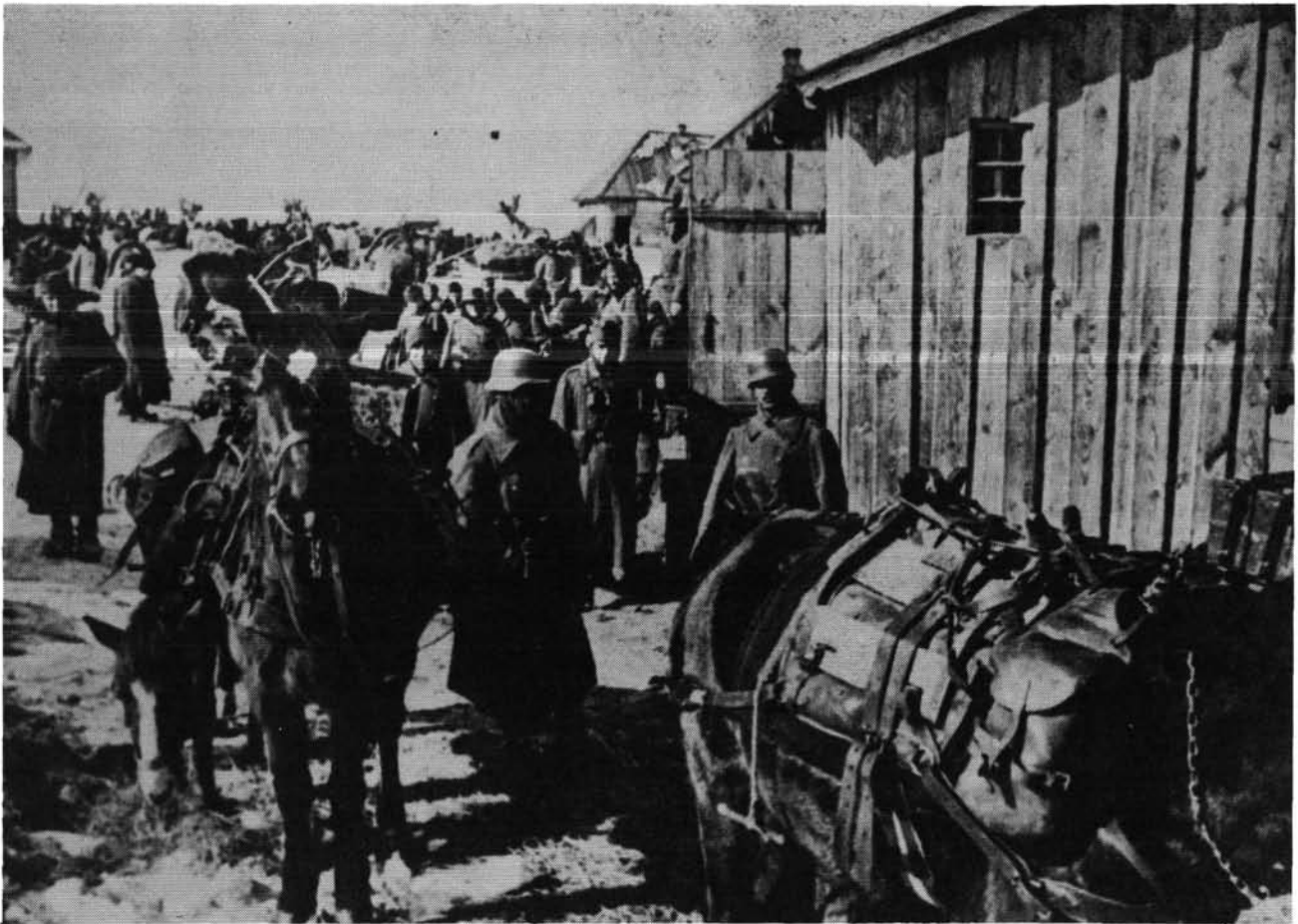
5. ábra. Magyar csapatok egy szovjet faluban (1942 nyár.)

megkezdte a támadást a Don-kanyarban levő szovjet hídfőállás ellen. Az É-i – bal – szárnyon előnyomuló 35. gyalogezred 35/II. zászlóalja benyomult Sztorozsevoje községbe. Mivel a zászlóalj megfelelő biztosítás nélkül támadott, váratlanul szovjet harckocsik rohanták meg a magyar gyalogságot. Annak ellenére, hogy egy harckocsit sikerült kilőniük, a zászlóalj (észak-erdélyi sorozású) román légénységű vonatoszlopánál pánik tört ki, a katonák megfutamodtak, ami jelentős veszteségekkel járt. Az ezred D-i szárnyán a 34/III. zászlóalj nyomult előre, s megközelítette a Sztorozsevojétől DK-re elterülő Ottocsihai-erdőt. A Bolgyirevka és Gyevica közti ívben a 4. gyalogezred nyomult előre Uriv irányába. Itt sem volt megszerveve az előbiztosítás, s a hídfőből 32 szovjet harckocsi tört előre. A harckocsik legázolták az ezred előrevetett osztagának páncéltörő lövegeit. Segítségükre a III. hadtest közvetlen légvédelmi tüzérosztály egy 29.M. Bofors 80 mm-es légvédelmi ágyús ütegét küldték előre, de ezek sem tudtak hatásosan tüzelni a szovjet nehéz harckocsikra. A 7. könnyű hadosztály parancsnoksága 16 óra 50 perckor a 4/1. bombázórepülő-századtól azonnali bombatámadást kért a Gyevicán és attól Ny-