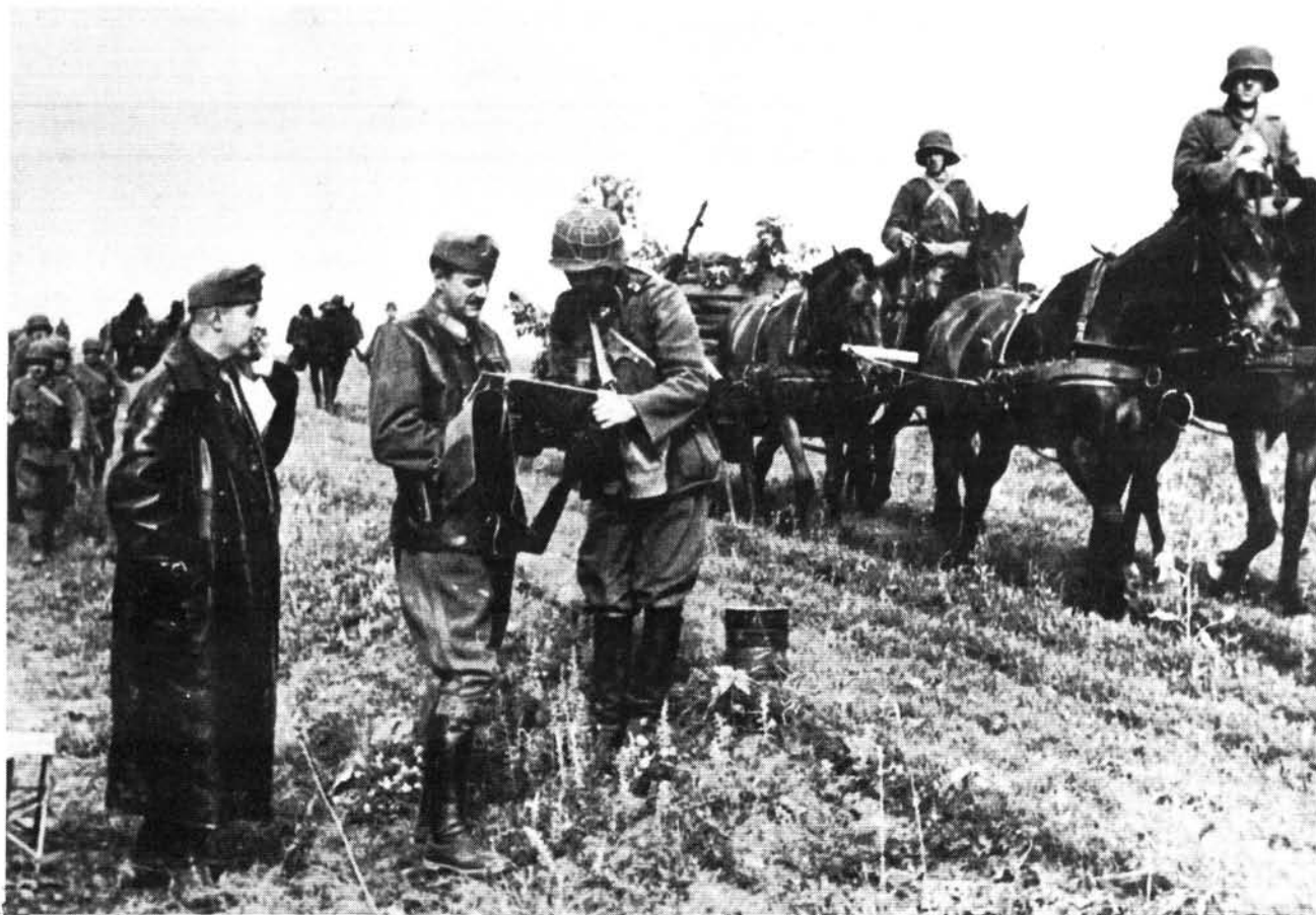
1. ábra. Egy ütegparancsnok jelentést tesz Rakovszky vezérőrnagynak (1942. jún. 27.)

A soproni 7. könnyű hadosztály 1942. május 12-re elfoglalta a német Gollwitzer-csoport téli – kiépített – védőállásait a Rozsgyesztvenszkoje és Korovino–Szolznevo (Szejm folyó)