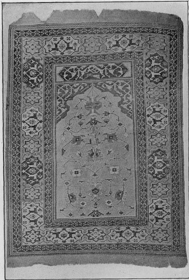
2. kép. Erdélyi inaszőnyeg. Kis Ázsia. XVII. sz. Br. Bruckenth. Múz. Nagyszeben. Fig. 2. Tapis de pierre transylvain. Asie Min. XVII e s. Musée baron Bruckenth. Nagyszeben.

3. Azok, melyeknek tükrében a „kis usák“ szőnyegekre jellemző középmédailon ékeskedik. (Lajstr. 168. sz., képpel).