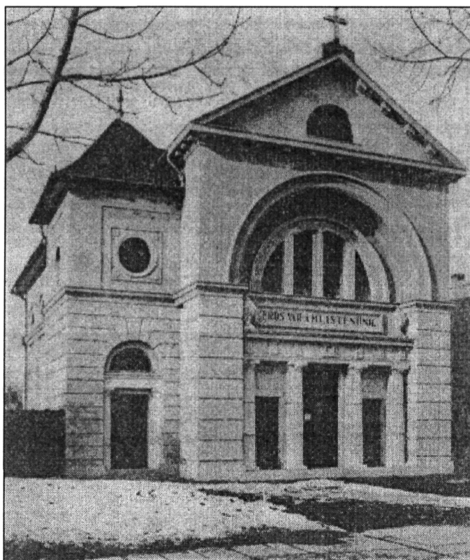
4. kép. Az elkészült gyulai evangélikus templom