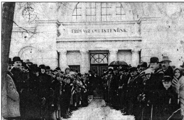
3. kép. A templom felszentelése 1927. december 18-án